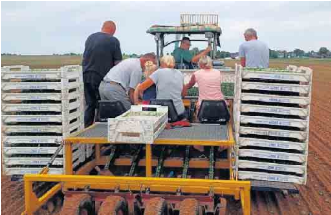
Dieses Jahr konnte der Landwirt und seine Familie es kaum abwarten, bis Mitte August die jungen Stiefmütterchen und Hornveilchen gepflanzt wurden

Blüten erinnern beim Anblick direkt an ein außergewöhnliches Kunstwerk. Eine Augenweide ist das Stiefmütterchen mit den Farben rot und gelb. Hier bei dieser Sonderfarbe ist jede Blüte ein Unikat und besticht durch einen besonderen farblichen Verlauf. Bei unserem Besuch in Enzen sind wir von beiden Sorten restlos begeistert. Ab sofort sind die Stiefmütterchen und Hornveilchen auf den Feldern zu bewundern und tauchen den Rand der Ortschaft Zülpich-Enzen in eine bunte Blütenpracht. FH