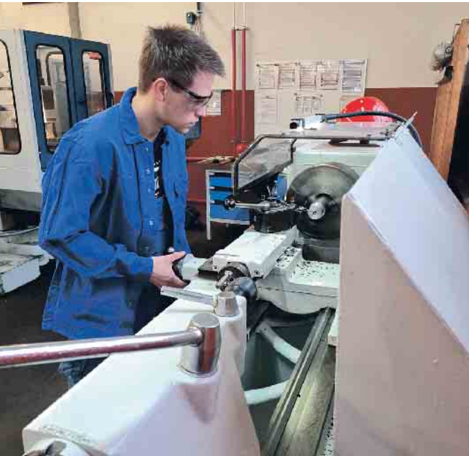
Mädchen und Jungen, die sich für den Werkstoff Kupfer interessieren, können zum Beispiel eine Ausbildung zum Zerspanungsmechaniker Drehtechnik (m/w/d) in Betracht ziehen.

aber auch Fachleute für erneuerbare Energien einen sicheren Arbeitsplatz. Mädchen und Jungen, die sich für den Werkstoff Kupfer interessieren, können zum Beispiel eine Ausbildung zum Verfahrenstechnologen, Stanz- und Umformungsmechaniker oder Zerspanungsmechaniker in Betracht ziehen oder über ein klassisches oder duales Studium einen Abschluss als Entwicklungsingenieur Metall oder Werkstoff Ingenieur erlangen. In ihrem späteren Berufsleben kümmern sie sich um die Planung oder Herstellung, Konstruktion oder Wartung, um die Weiterentwicklung von Anlagen und Anwendungen oder Verbesserung der Produktion. Unter www.kupfer.de und unter dem Hashtag #copperjobs finden Interessierte Berufsbilder in der Kupferindustrie sowie Firmen der Kupferbranche, die Ausbildungsplätze und offene Stellen auf ihren Unternehmenswebseiten anbieten. Unverzichtbares Funktionsmetall Kupfer ist mit seinen über 400 Legierungen wichtiger Bestandteil innovativer Entwicklungen - ob in der industriellen Anwendung, der Energietechnik, der Architektur oder in der Informations- und Kommunikationstechnologie. Kupfer ist ein relativ weiches und dehnbares, aber auch widerstandsfähiges Metall, das