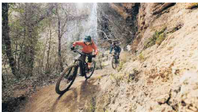
Das E-Bike ist das passende Trainingsgerät für alle, die gezielt ihre Fitness verbessern möchten.

So lässt sich das E-Bike als digitaler Trainer und Sportgerät nutzen