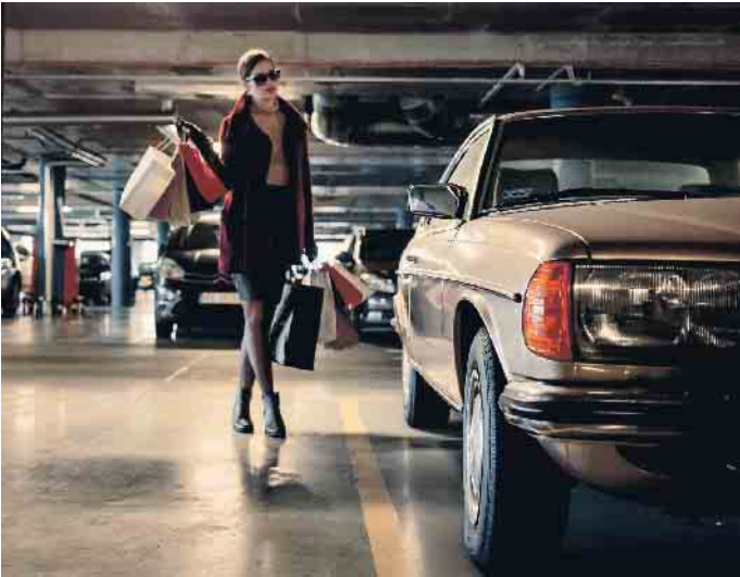
In Parkhäusern ist Vorsicht und gegenseitige Rücksichtnahme notwendig.

Parkhäuser sind oft voll, eng und unübersichtlich. Um Stress und Unfälle zu vermeiden, sollte man sich unbedingt an die dort geltenden Regeln halten. Grundsätzlich gilt in allen öffentlichen Parkhäusern die Straßenverkehrsordnung, ganz gleich, ob ein Schild darauf hinweist oder nicht. Allerdings sind die Fahrstreifen in vielen Häusern so eng, dass es sich nicht um Straßen im klassischen Sinn handelt. So ist es zum Beispiel nicht immer möglich, sich nach den Vorfahrtsregeln zu richten. Daher sind beim Fahren im Parkhaus Vorsicht und gegenseitige Rücksichtnahme notwendig. So sieht es die Straßenverkehrsordnung vor. Das heißt: Die Fahrweise muss den besonderen Bedingungen im Parkhaus angepasst werden. Langsam und umsichtig zu fahren, ist gerade in sehr engen Parkhäusern wichtig. Blickkontakte und Handzeichen sind