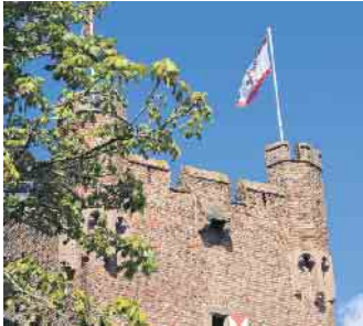
Die Ecktürmchen sind aus einem Achteck konstruiert und ruhen auf fein profilierten Kragsteinen mit hohen, gestelzten nasenbesetzten Spitzbögen.

rer Vorfahren und gesellschaftliche Werte. Darüber hinaus können Denkmale auch persönliche Wahrzeichen sein: Die Dorfkirche, in der Taufen oder Hochzeiten gefeiert wurden oder der Park, in dem wir gern unsere Wochenenden verbringen, haben eine emotionale Bedeutung für uns. Jedes Denkmal kann in diesem Sinne zum „Wahr-Zeichen“ werden. Für die Prinzengarde Zülpich 1910 e.V. ist das Münstertor ihr „Wahr-Zeichen“. Neben dem Museum der Badekultur und der Burg am Wallgraben hatte das Münstertor seine Türen für große und kleine Besucher geöffnet. Mehr als 100 Besucher kamen der Einladung nach. Präsident Horst Wachendorf, der erste stellvertretende Präsident Simon Deuster sowie weitere ehrenamtliche Helfer der Prinzengarde standen den Gästen Rede und Antwort. So erfuhren Interessierte, dass das Münstertor im Jahr 1357 als erstes der vier Zülpicher Stadttore am südlichen Ende der Münsterstraße errichtet wurde. Im 2. Weltkrieg wurde der Turm schwer beschädigt und 1953 und 1976 restauriert. Durch den Turm führte die Straße nach Bad Münstereifel. Ursprünglich handelte es sich wohl um ein Doppeltor. Der Turm ist dreistöckig durch einen Zinnenkranz abgeschlossen. Die Ecktürmchen sind aus einem Achteck