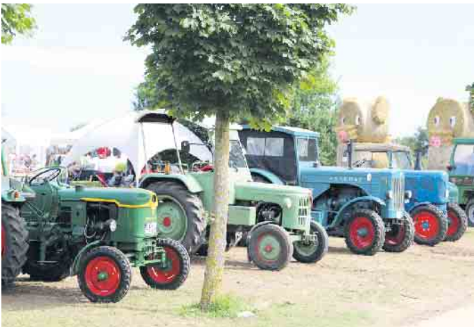
Sehenswert waren auch die ausgestellten Oldtimer Traktoren