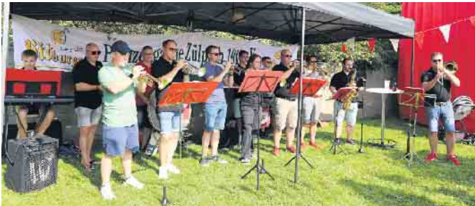
Bei karnevalistischen Klängen des vereinseigenen Fanfarencorps konnten sich auch manche Neuzugänge des Vereins untereinander kennenlernen und einfach ein kleines Schwätzchen halten