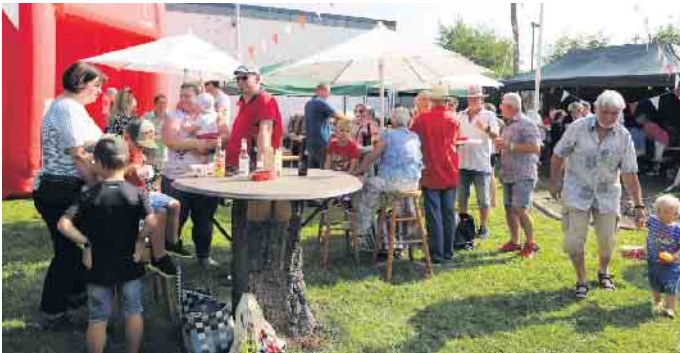
Prinzengarde im Sunnesching: Gelungenes Familienfest des ältesten Traditions-corps der Stadt Zülpich in Langendorf