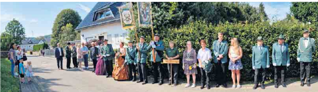
Aufstellung vor der Königsparade.