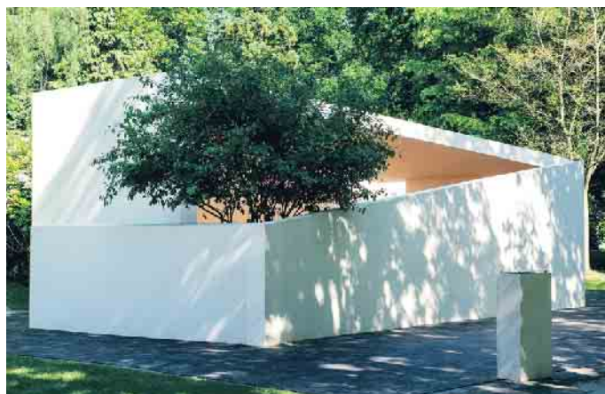
Ein alternativer und konfessionsübergreifender Trauerort auf dem größten Parkfriedhof der Welt.

Der Friedhof der Zukunft passt sich den Bedürfnissen einer modernen und individualisierten Gesellschaft an. Umweltbewusstsein und funktionale Entwicklung werden berücksichtigt, Traditionen und die Würde des Ortes werden respektiert. In urbanen Gebieten bietet er gestressten Stadtbewohnern und Familien einen besonderen Erholungsraum als innerstädtische Grünfläche. Pflegefreie Grabkonzepte gewinnen an Bedeutung, da unsere Gesellschaft immer mobiler wird und die gesamte Familie oft nicht