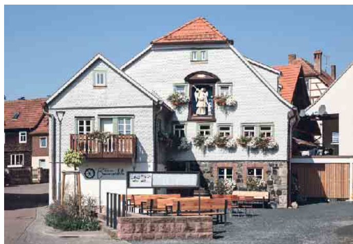
Wer die alte Mühle kannte, kommt aus dem Staunen nicht heraus.

Die Nachwuchsförderung und damit die Zukunft der „Next Generation“ im Maler- und Lackiererhandwerk ist wesentlicher Bestandteil der Caparol-Firmenphilosophie. Mit der Initiative „Mal Dir Deine Zukunft aus!“ werden Berufseinsteiger oder frischgebackene Selbstständige - mit einem breiten Förderangebot unterstützt. Mehr unter www.caparol.de/nachwuchsforderung (akz-o)