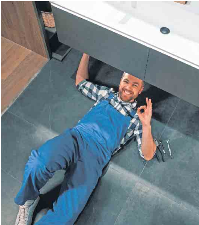
Im Einsatz für mehr Lebensqualität: Badberater entwickeln individuelle Badräume, SHK-Handwerker wie Anlagenmechaniker, Fliesenleger und Elektriker setzen sie um.

dabei, persönliche Wohlfühl-Oasen mit innovativem Komfort und ansprechender Ästhetik einzurichten. Sie sorgen zudem dafür, dass das neue Bad sorgsam mit der Ressource Trinkwasser umgeht und dass die Qualität unseres wichtigsten Lebensmittels sicher ist. Zur Umsetzung eines neuen Badezimmers sind neben SHK-Anlagenmechanikern auch Fliesenleger und Elektriker erforderlich, um den Kunden eine optimale Lebensqualität zu bieten. (DJD)