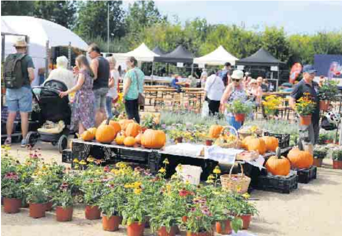
Große Vorfreude auf die neue Jahreszeit entfacht