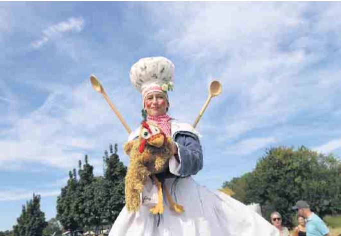
Die Stelzenläuferin sorgte mit ihrer Huhn-Handpuppe für Begeisterung sowohl bei Jung als auch Alt

se und unverbindliche Gartenberatung vom Profi. Die individuelle Beratung konnten die Gäste mit und auch ohne Anmeldung in Anspruch nehmen, allerdings sind aussagekräftige Fotos oder grobe Pläne des Gartens von Vorteil. Für ein abwechslungsreiches Speisenangebot im Park war ebenfalls bestens gesorgt. Verschiedene Stände boten eine vielseitige Imbissauswahl unter anderem mit regionalen und saisonalen Köstlichkeiten. Die Strandbud bot zudem Cocktails, Eis und erstmalig auch Bubble Tea an. Gern wurden von den zahlreichen Besucherinnen und Besuchern die Sonnenstunden und warmen Temperaturen auch am Strand genossen: die Badestelle im Seepark war noch geöffnet und im Preis inbegriffen. FH