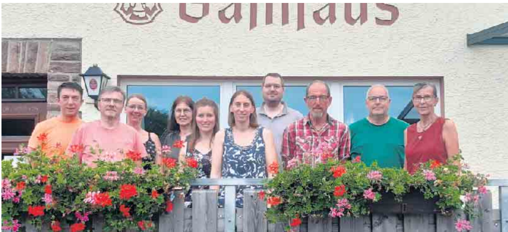
Die diesjährigen Akteure der Theaterbühne Zingsheim

Die Vorführungen des Lustspiels „Der goldene Schlüssel“ finden an den folgenden Terminen statt: Freitag, 25. Oktober, 20 Uhr, Samstag, 26. Oktober, 19 Uhr, Sonntag, 27. Oktober, 16 Uhr, ab 14 Uhr Kaffee und Waffeln Freitag, 1. November, 20 Uhr, Samstag, 2. November, 19 Uhr, Sonntag, 3. November, 16 Uhr, ab 14 Uhr Kaffee und Kuchen Generalprobe, wie in jedem Jahr