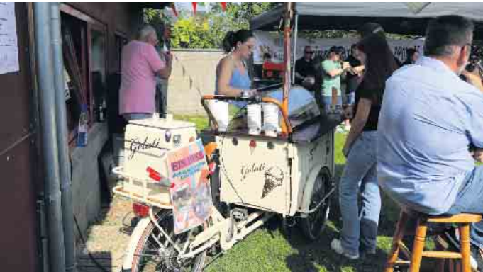
Erstmals sorgte ein Eis-Bike für kühle Erfrischung von innen