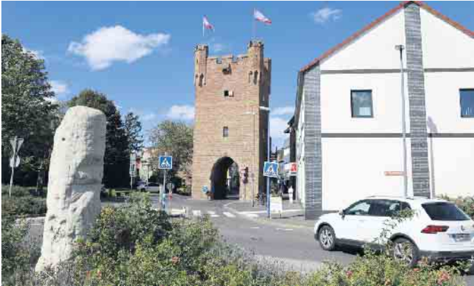
Wahr-Zeichen: Das Münstertor in Zülpich präsentiert sich als Zeitzeuge der Geschichte

Der Tag des offenen Denkmals wird seit 1993 bundesweit durch die Deutsche Stiftung Denkmalschutz koordiniert. Der Aktionstag, an dem viele sonst nicht zugängliche Denkmale für die Bürger geöffnet werden, findet jährlich am zweiten Sonntag im September statt und verzeichnet jeweils mehrere Millionen Besucher. Das diesjährige Motto „Wahr-Zeichen. Zeitzeugen der