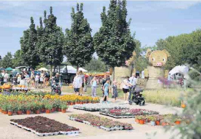
Buntes Herbsttreiben im Seepark Zülpich

Große Vorfreude auf die neue Jahreszeit entfacht