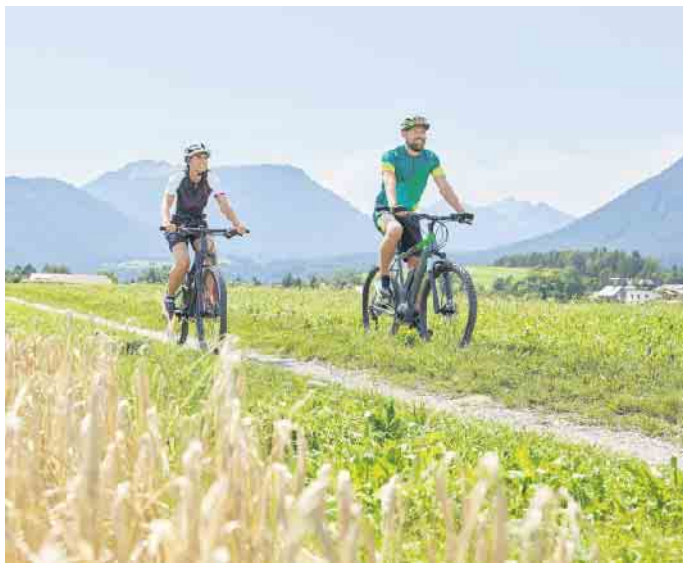
Nach längeren Ausflügen kennen die meisten Radlerinnen und Radler das Phänomen, dass Po, Rücken und Nacken immer wieder mal schmerzen. Mit der richtigen Einstellung des Bikes lässt sich das vermeiden.