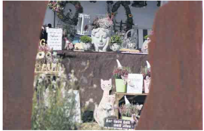
Es wurde für Jung und Alt ein buntes Programm-Potpourri geboten, unter anderem mit zahlreichen Kunsthandwerkständen