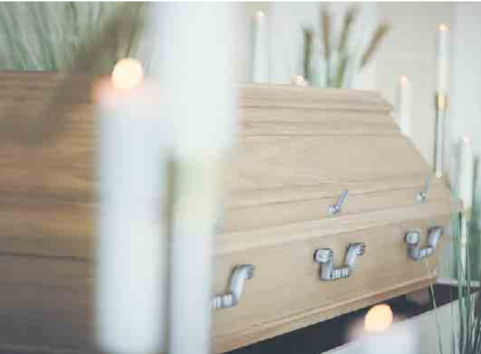
Für sehr große und sehr schwere Menschen gibt es maßangefertigte Särge.

Alle gesellschaftlichen Trends spiegeln sich, früher oder später, auch in der Bestattungskultur wider. Sei es die Digitalisierung, die Individualisierung, die Zunahme der Nomadisierung, einhergehend mit einer zunehmenden Mobilität der Gesellschaft, aber eben auch eine veränderte Ernährungs- und Lebensweise oder andere Dispositionen, die zu Übergewicht und infolgedessen zu Adipositas führen können. Über die Hälfte der Erwachsenen in Deutschland ist übergewichtig, fast ein Viertel ist sogar adipös. Betroffene können sich an den Adipositas-Selbsthilfe-Verein wenden. Dem Lauf der Dinge folgend, werden auch diese Menschen einmal sterben. Die Bestatter des Bundesverbandes Deutscher Bestatter e.V. engagieren sich dafür, für alle Menschen eine würdige Beisetzungsform zu finden, ganz gleich ob groß, klein, schwer oder leicht, geboren oder ungeboren, verstorben. Natürlich muss man auf die besonderen Bedingungen reagieren und entsprechend planen. Ob Erd- oder Feuerbestattung, für beide Abschiedswege wird ein Sarg benötigt. So kümmert sich der Bestatter zum Beispiel um einen maßangefertigten Sarg, denn Standardsärge sind nur 65-70 cm breit. Ist eine Feuerbestattung gewünscht, nimmt er zum nächstgelegenen Krematorium Kontakt auf, welches auch Kremierungen adipöser Verstorbener durchführen