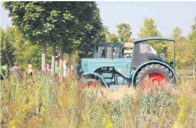
Unterstützung erhielt der Markt auch in diesem Jahr durch zahlreiche Traktorenfreunde mit ihren historischen Landmaschinen