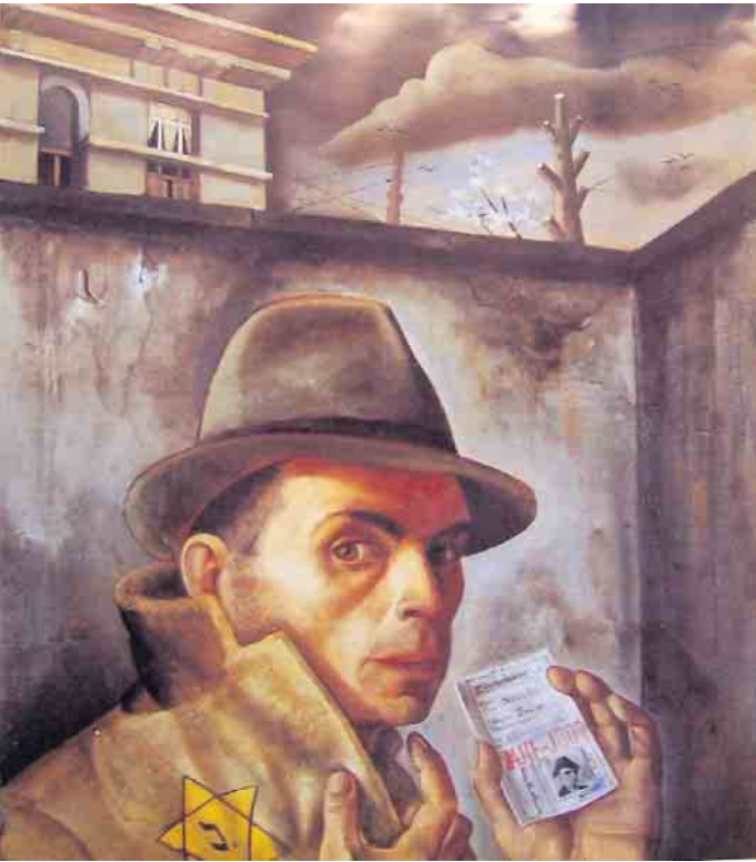
Auf der Flucht

Treffpunkt: Parkplatz Bahnhofstraße 7, 53940 Hellenthal 4 Kilometer Spaziergang, kostenlos, Spenden sind willkommen.