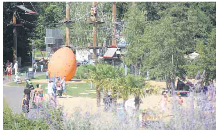
Gern konnten die großen und kleinen Besucher die Sonnenstunden und warmen Temperaturen auch am Strand genießen