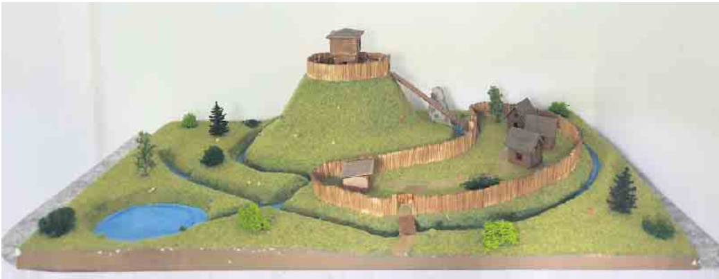
Modell der Burgwüstung „Burchkopp“

Infos zur Veranstaltung: Bei der geführten Wanderung durch den Wald bei Giescheid (5 Kilometer) wird die Rolle des Waldes in unserer Gesellschaft von der Vergangenheit über die Gegenwart bis in die Zukunft dargestellt. Als