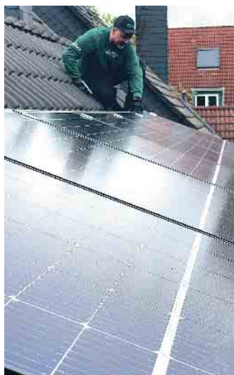
Dachdecker: Ihr Ansprechpartner, wenn es um PV geht.

Dachdeckerfachbetriebe haben die Erfahrung und Routine, all die genannten Punkte umzusetzen. Sie beraten, führen alle Arbeiten fachgerecht durch und bauen in Kooperation mit Betrieben aus dem Elektro-Handwerk sichere und nachhaltige Anlagen ein. Auch kennen sie sich mit den aktuellen Förderprogrammen aus. (akz-o)