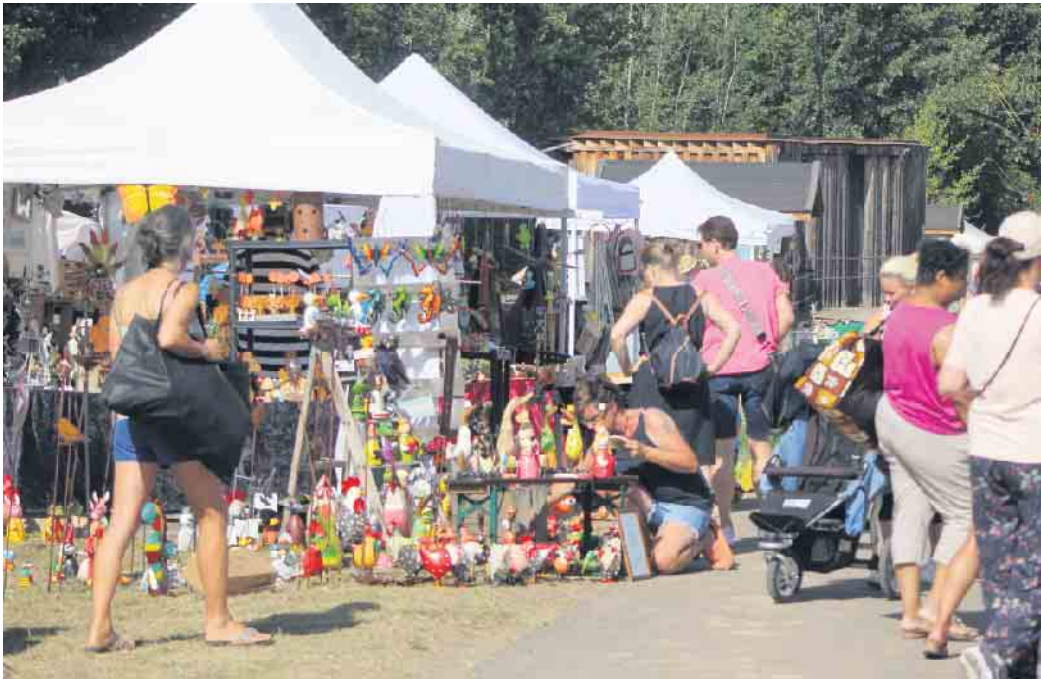
Die ersten Herbstboten beim Familien-Herbstmarkt am 9. und 10. September im Seepark Zülpich

Familien-Herbstmarkt lockte bei bestem Wetter wieder in den Seepark Zülpich