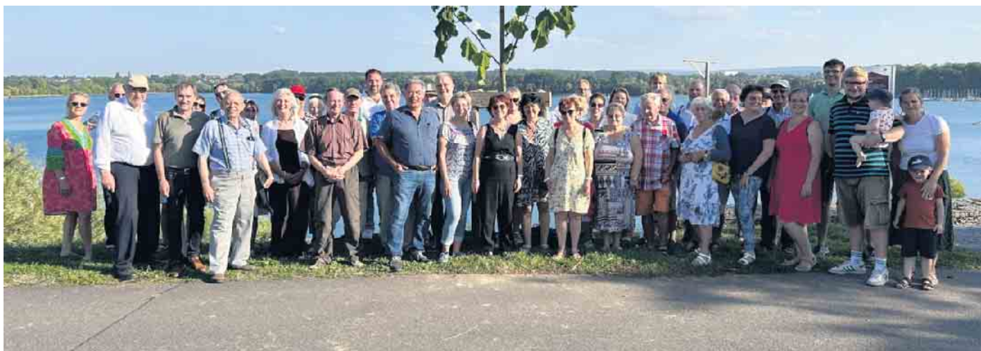
Der offizielle Empfang der Stadt Zülpich aus Anlass des 50-jährigen Bestehens der Städtepartnerschaft zwischen Blaye und Zülpich fand im Seepark Zülpich statt.

Fünf Jahre nach dem bis dato letzten Besuch war jetzt eine neunköpfige Delegation aus der französischen Partnerstadt Blaye vier Tage lang in Zülpich zu Gast, um, mit einjähriger Verspätung, das 50-jährige Bestehen der Partnerschaft zu feiern.