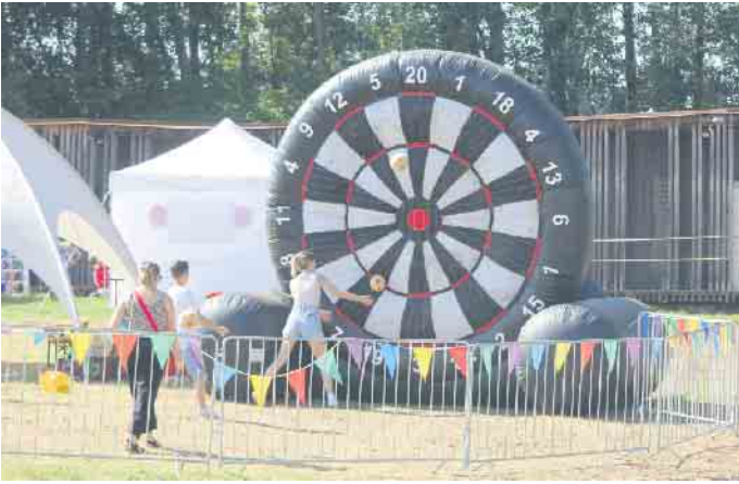
Beim Familienprogramm stand das Fußball-Dart hoch im Kurs