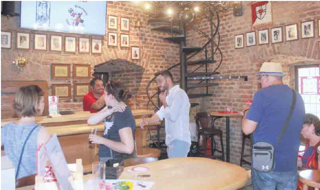
Am Gardequartier Münstertor öffneten sich für Interessierte einen Tag lang die Türen des Tores. Wer die Stufen der Wendeltreppe hinaufgestiegen ist, konnte die beiden Ebenen des Münstertores erkunden.

Was vor 30 Jahren mit einigen Einzelvents verstreut in ganz Deutschland begonnen hat, ist inzwischen zur größten Kulturveranstaltung hierzulande herange-