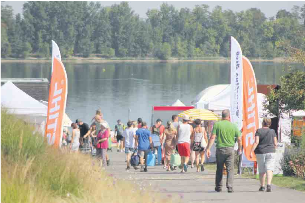
Buntes Markttreiben und reichlich Herbstgefühle erwarteten die Besucherinnen und Besucher im Seepark