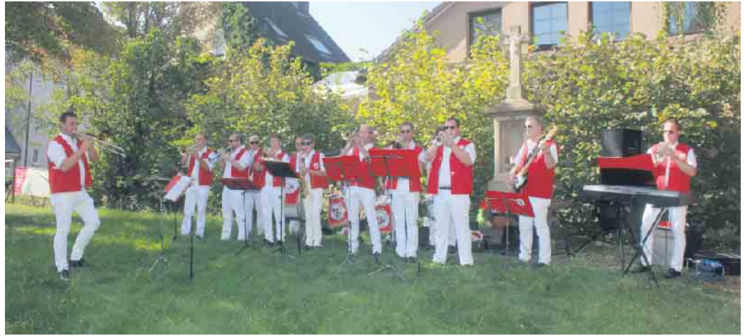
Zur Musik des Fanfarencorps der Prinzengarde konnte bei herrlichem Sonnenschein die ein oder andere Stunde der Tag des offenen Denkmals genossen werden.

die großen und kleinen Gäste. Diese kamen über den Tag verteilt im Scharen. Gibt es einen solchen Blick doch nicht aller Tage. Beide standen für Fragen rund um die Geschichte des ehrenwürdigen Ortes zur Verfügung. Im Zuge der Stadtbefestigung durch den Kölner Erzbischof Friedrich III. von Saarwerden Ende des 14. Jahrhunderts wurde das Münstertor in der heutigen Erscheinungsform errichtet. Im II. Weltkrieg wurde das Tor stark in Mitleidenschaft gezogen. In den 1950er- und 1970er-Jahren wurden Restaurierungs- und Wiederaufbaumaßnahmen ergriffen. Erst in den 1970er-Jahren wurden die zinnengekrönten Eckwarte wiederhergestellt. Seit 1993 ist das Münstertor das Gardequartier der Prinzengarde Zülpich 1910 e.V. Zu Fuß des Tores stand den Kindern eine Hüpfburg zur Verfügung. Kühle Getränke und ein kleiner Imbiss wurden zudem angeboten. Zur Musik des Fanfarencorps der Prinzengarde konnte bei herrlichem Sonnenschein die ein oder andere Stunde der Tag des offenen Denkmals genossen werden. Auch das Köln-