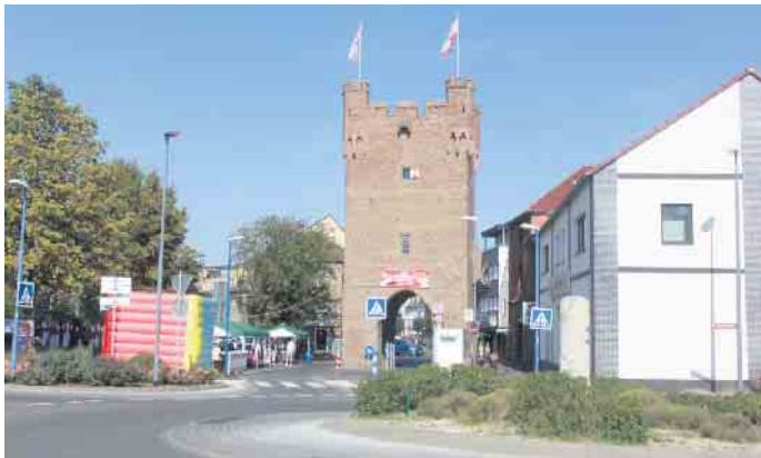
Seit 1993 ist das Münstertor das Gardequartier der Prinzengarde Zülpich 1910 e.V.