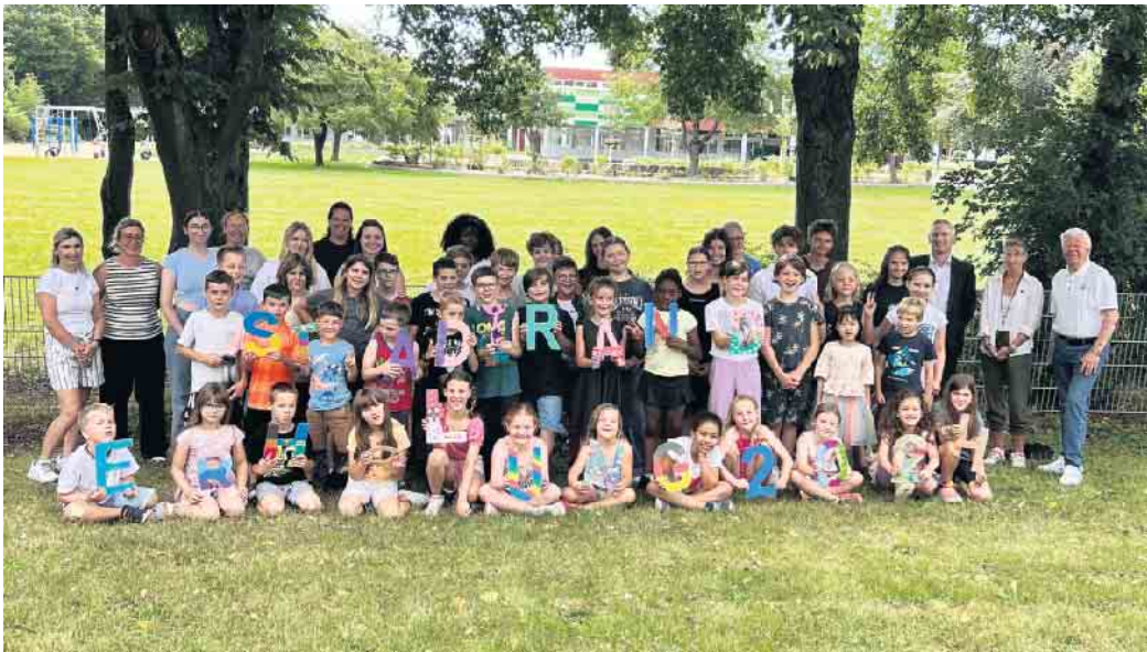
Tolle Erlebnisse und spannende Aktionen wurden auch in diesem Jahr wieder rund 80 Mädchen und Jungen aus dem Stadtgebiet bei der Zülpicher Stadtranderholung geboten hat.