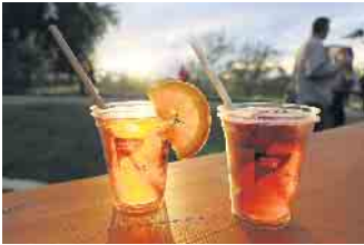
Die Seepark-Gastronomie „Strandbud“ legte am Veranstaltungstag eine temporäre Außenstelle ein und bot Spezialitäten vom Grill sowie sommerliche Cocktails

Die Seepark-Gastronomie „Strandbud“ legte am Veranstaltungstag eine temporäre Außenstelle ein und bot Spezialitäten vom Grill sowie sommerliche Cocktails. Eine ästhetische Beleuchtung der Burgmauern rundete den Abend ab, bevor die Gäste im Anschluss durch die Kneipen der Stadt weiterzogen oder den abendlichen Spaziergang durch Zülpich genießen konnten. FH