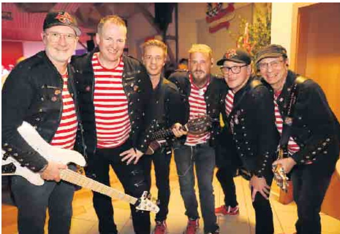
Das Finale bestritten die sechs Jungs der „Domstadtbande“ mit einem Best Off aus ihrem aktuellen Showprogramm und setzten den wunderbaren Schlusspunkt dieses wirklich erfolgreichen Abends