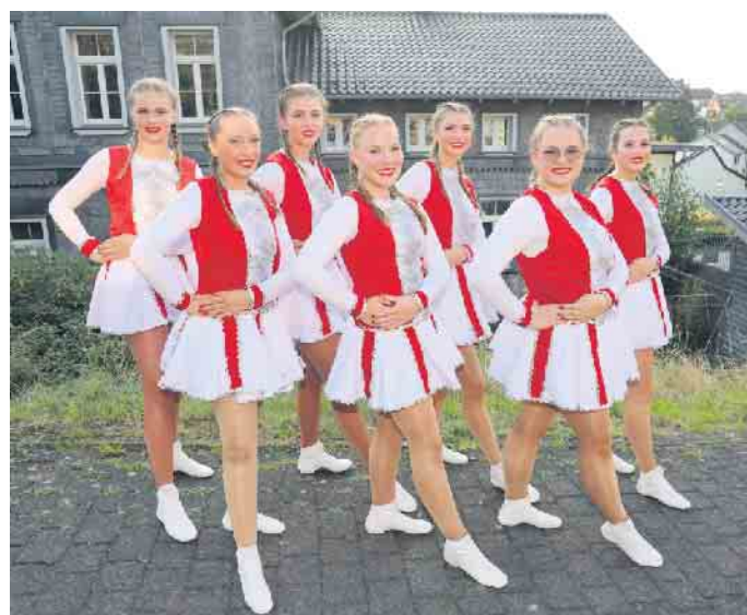
Klasse Leistung: die Sessionsmariechen der Löstige Hündche

ankam. Danach ging es musikalisch mit dem „Don de Cologne“ sowie der Band „Kappes & Co.“ weiter, bevor dann die „Bonte Pitter“ die Leute mit ihrer Rede von den Stühlen riss. „Ne Jeck noch Note“ konnte anschließend überzeugen. Den tänzerischen Abschluss bildete das Tanzkorps „Blaue Jungs“ der Karnevalsgesellschaft Lövenicher-Neustädter 1903 e.V. aus Köln. Die Büttensprecher „Ne närrische Kommissar“ und „Da Knubbelisch“ zeigten einen fantastischen Auftritt. Altbewährt im Programmablauf der Auftritt des Duos „De Neppeser“. Das