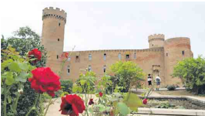
Direkt am historischen Gemäuer der kurkölnischen Landesburg erwartete die Gäste das neue Veranstaltungsformat „BeatZ an der Burg“