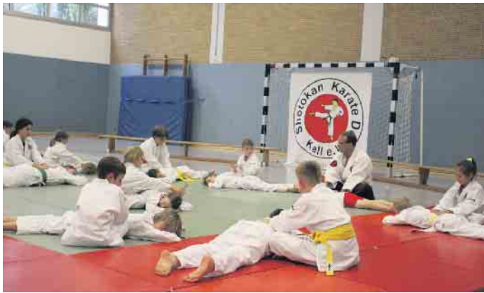
Gegenseitige Entspannungsübungen sind Übungen, die zu zweit oder in einer Gruppe durchgeführt werden, um Entspannung und Wohlbefinden zu fördern.