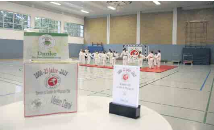
Wieder eine tolle Aktion zu Gunsten der Hilfsgruppe Eifel.

sondern auch eine wertvolle Bereicherung für unsere pädagogische Arbeit.“ Ein weiterführendes Seminar findet am Samstag, 6. September, von 10 bis 13 Uhr, in Kall statt. Ab 6 Jahre und 10 Euro Mindestspende für die Hilfsgruppe Eifel. Es richtet sich an Kinder, Trainerinnen und Trainer sowie Assistenzen, die Aiki-Spiele kennenlernen oder vertiefen möchten. Jetzt wieder Anfängerkurse für Kinder, Jugendliche und Erwachsene in Kall, Auelstraße 47. Fragen und Info: Udo Koch 0176 57879707 (gerne auch über WhatsApp) www.karate-kall.de