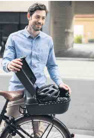
Sicherer Transport auch für den vereinigten Freund.

Wer regelmäßig mit dem Rad fährt, hält sich körperlich fit. Es tut nicht nur gut, sich an der frischen Luft zu