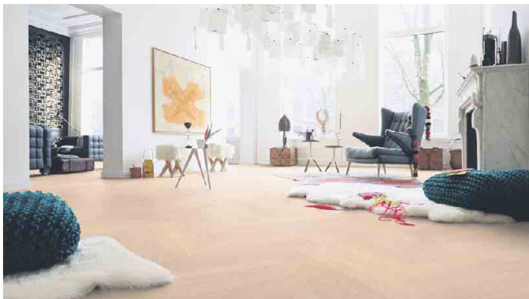
Parkett im Fischgrätmuster gibt weitläufigen Räumen Struktur.

Hell oder dunkel, weitläufig oder kompakt - die Wahl des Fußbodens setzt die Stimmung im Raum.