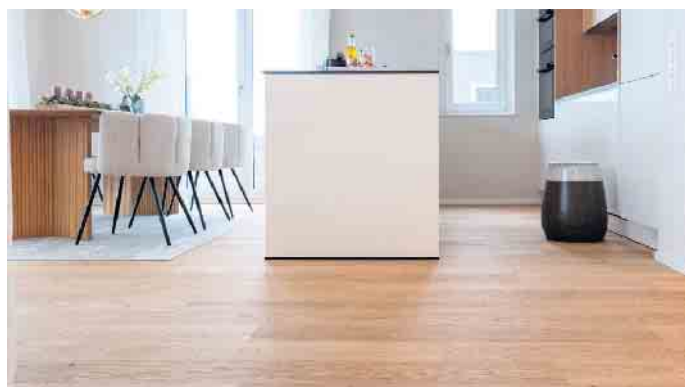
Eng abgemessene Räume profitieren optisch von parallel verlegtem Parkett.