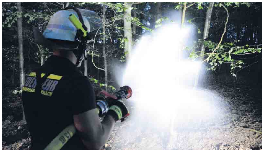
Bei einer Großübung der Freiwilligen Feuerwehr im Jahr 2023 wurde im Bereich Wolfgarten ein Waldbrand simuliert, um den Ernstfall zu üben.

Auch im Stadtgebiet Schleiden, insbesondere im Nationalpark Eifel besteht aufgrund der anhaltenden Trockenheit derzeit eine große Waldbrandgefahr - Schleidener Feuerwehr sieht sich für den Ernstfall bestens gerüstet und vorbereitet.