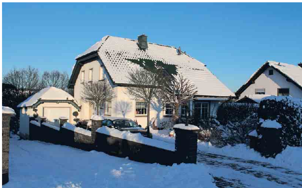
Dächer werden durch vielfältige Witterungen und Temperaturunterschiede beansprucht. Ein regelmäßiger Check sorgt für Sicherheit.

Der Zentralverband des Deutschen Dachdeckerhandwerks (ZVDH) rät daher allen Hausbesitzern und Hausverwaltungen, nach dem Winter das Dach und seine Bauteile überprüfen zu lassen. Nur so können mögliche Schäden rechtzeitig behoben werden. Im Rahmen eines DachChecks wird das gesamte Dach einer gründlichen Sichtprüfung unterzogen. Dabei erkennen erfahrene Dachdecker-Innungsbetriebe Schwachstellen bereits durch eine erste