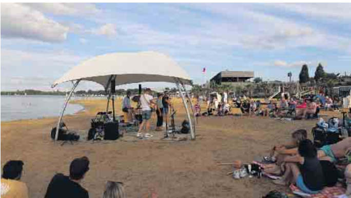
Beste Live-Musik mit Seeblick.

Diese Besuchergruppe genoss sichtlich die Konzertreihe und kam schon zum wiederholten Male zur Strandkultur vorbei.