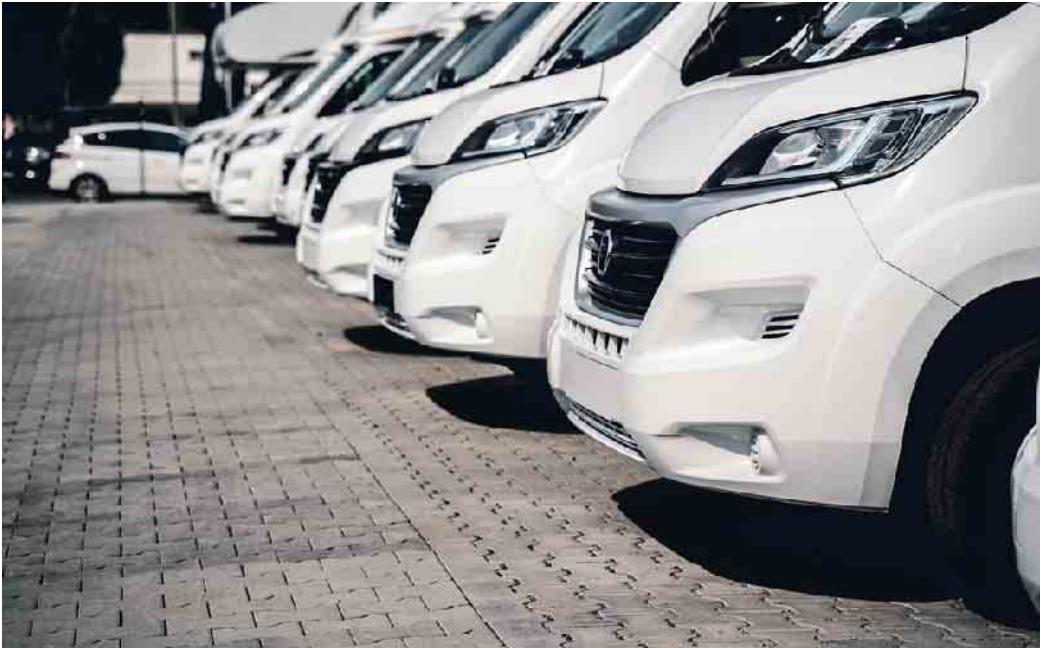
Wohnwagen sind aktuell sehr beliebt.