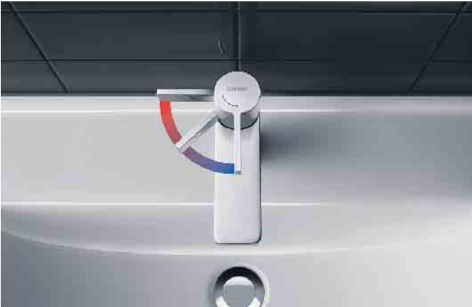
Die energiesparende FreshStart-Funktion bei Einhebelmischern sorgt dafür, dass die Beimischung von Heißwasser erst erfolgt, wenn der Hebel bewusst nach links bewegt wird.

ab. Das Wasser fließt also nur dann, wenn es wirklich genutzt wird. Manche Armaturenhersteller versprechen dadurch Einsparungen bis zu 70 Prozent. Angenehmer Nebeneffekt sind die