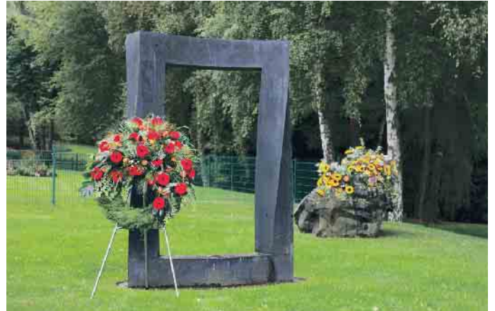
Tor zwischen den Welten.

Früher waren Krankheit, Sterben und Tod in der Großfamilie unter einem Dach vereint, genauso wie Romanze, Heirat und Geburt. Heute haben viele Menschen nie lernen und auch nie erfahren können, was Sterben und Tod bedeuten und wie sie von einem geliebten Menschen Abschied nehmen und richtig trauern können. Hinzu kommt, dass viele Angehörige nicht mehr an einem einzigen Ort leben und kaum einen Bezug zum örtlichen Friedhof haben. Mit der Trauer kommt die schmerzliche Erkenntnis der Endlichkeit. Die Einsicht reift, dass ein Partner, Freund oder Verwandter nach einem Todesfall tatsächlich nicht mehr da ist. Viele Bereiche des täglichen Lebens werden nicht mehr so sein wie bisher. Diese Einsicht ist oft so schmerzhaft, dass Menschen manchmal meinen, im Trauerfall besonders stark sein zu müssen, oder versuchen, sich anders abzulenken. Dabei ist es wichtig, die Trauer und damit auch den Schmerz zuzulassen, um den persönlichen Weg der Trauerbewältigung besser finden können.