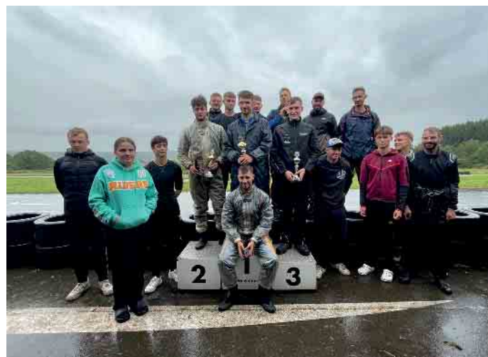
Siegerehrung der Rotax-Senior Klasse.

Das nächste Rennen des Kartclub Burg Brüggen findet am 31. August