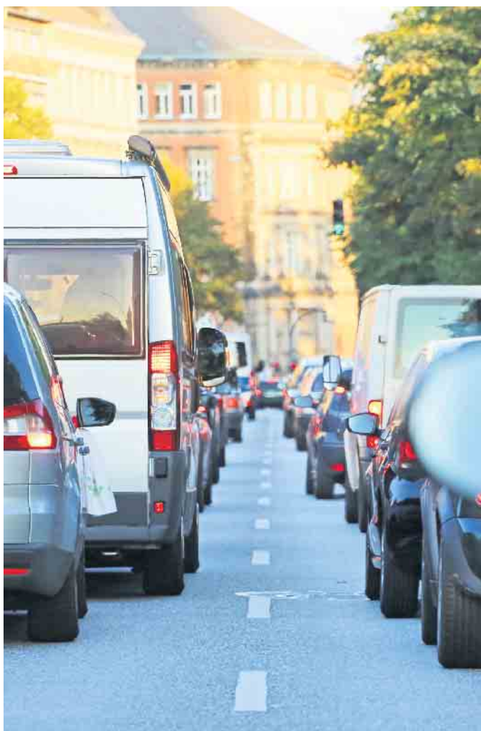
Der Stadtverkehr mit permanentem „Stop-and-go“ bietet geradezu ideale Bedingungen für die Rekuperation von Elektro- und Hybridautos.