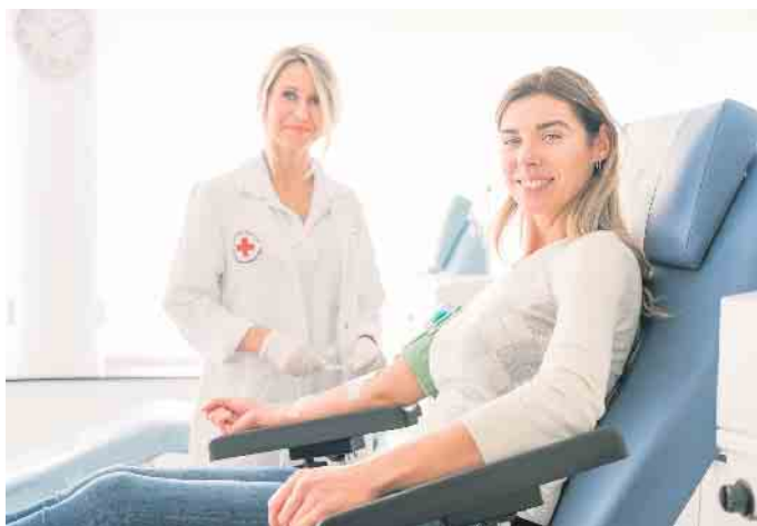
Während der Blutspende ist auch eine fachärztliche Betreuung durch den Blutspendedienst gewährleistet.

Die Situation bei der Versorgung mit Blutspenden ist immer noch angespannt. Darum bittet das DRK verstärkt um Blutspenden, um bei