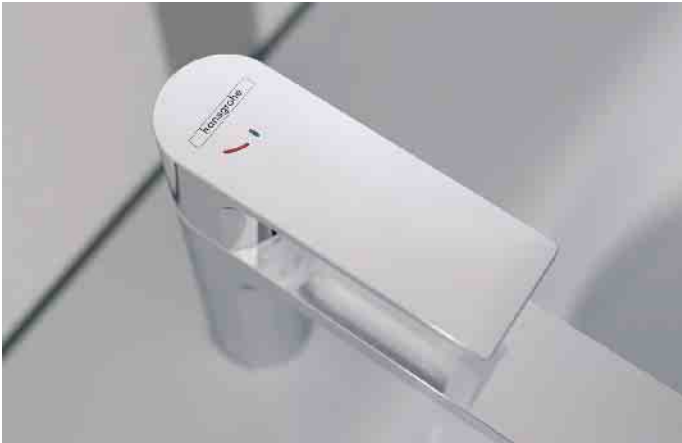
Wasserspar-Kartuschen in Einhebelmischern bewirken einen Widerstand im Hebelweg, der verhindert, dass der Hebel gleich bis zum Anschlag öffnet und mehr Wasser fließt als nötig.

bessere Hygiene und Reinigungsfreundlichkeit der Armatur. In den Fachausstellungen des Großhandels und beim SHK-Fachhandwerk sind viele weitere Ideen rund ums Energiesparen im