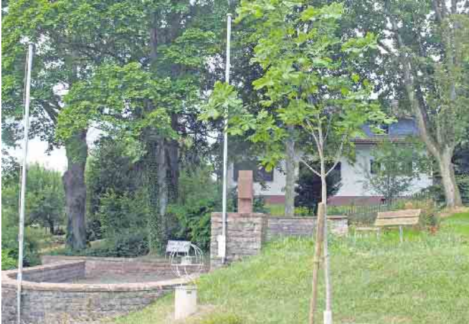
Ehrenanlage mit Anne Frank Skulptur und Gedenkbaum in Uedelhoven

Vor 84 Jahren begann am 1. September 1939 der Zweite Weltkrieg. Er brachte millionenfach Leid, Gewalt und Tod über die Welt. Unter den Opfern steht Anne Frank für die unmenschliche Verfolgung derer, die nicht in das rassistische Weltbild der Nationalsozialisten passten. Wenn man heute in die Welt blickt, stellt man erschreckt fest, dass sich wenig verändert hat. Kriege und Leid findet man auf fast allen Kontinenten der Erde. Trotz der internationalen Bemühungen zeigt sich, dass die Arbeit für die Frieden nie endet. Die Gemeinde Blankenheim, der Volksbund Deutsche Kriegsgrä-