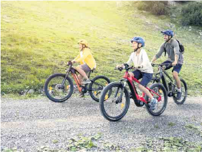
Reisen mit dem Rad: Das ist nachhaltig, abwechslungsreich und ein Spaß für die ganze Familie. Die elektrische Unterstützung eines E-Bikes erhöht dabei die Reichweite deutlich.

Nützliche Tipps für einen relaxten Urlaub mit dem elektrisch angetriebenen Rad