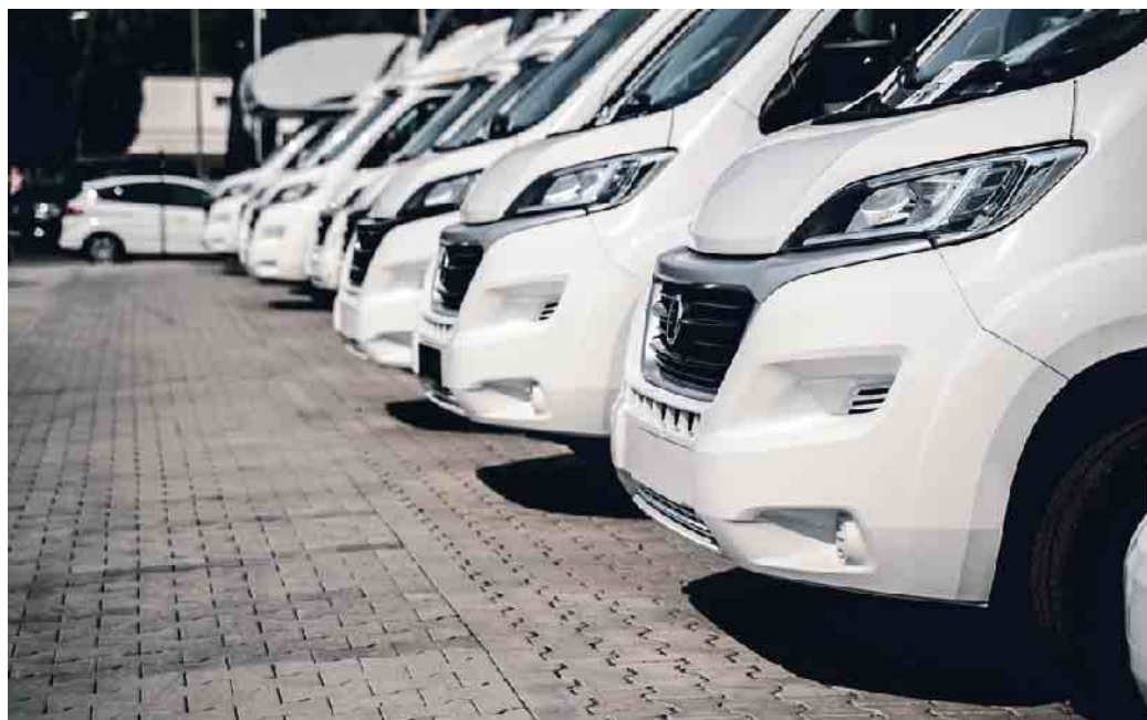
Wohnwagen sind aktuell sehr beliebt.