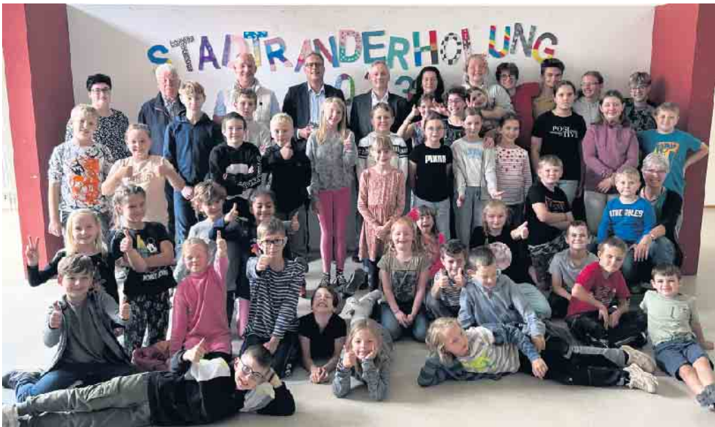
Tolle Erlebnisse und spannende Aktionen wurden auch in diesem Jahr wieder rund 75 Mädchen und Jungen aus dem Stadtgebiet bei der Zülpicher Stadtranderholung geboten hat.

Stadtranderholung 2023 bot erlebnisreiche Ferienwochen für rund 75 Kinder