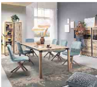
Zeitlos schöne Qualitätsmöbel bereiten ihren Besitzern lange Freude.

Fünf Tipps für eine nachhaltige Kaufentscheidung im Möbelhaus