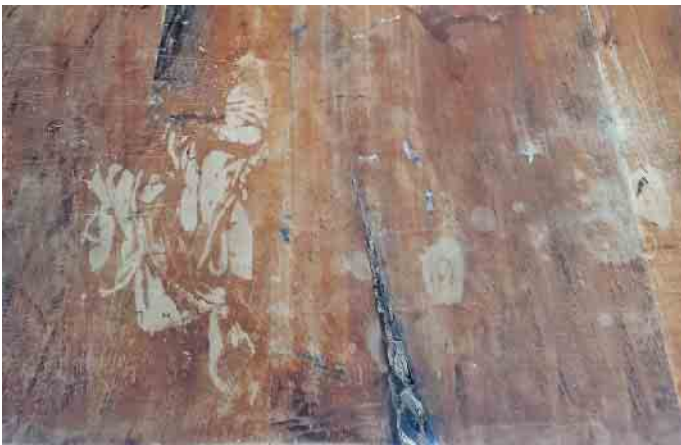
Eine alte Tischplatte mit zahlreichen Gebrauchsspuren...

Slany: „Es sollte sich unbedingt um ein Vintage-Möbelstück handeln, also eines, das zwischen 1920 und 1980 hergestellt wurde. Diese bestehen in der Regel aus