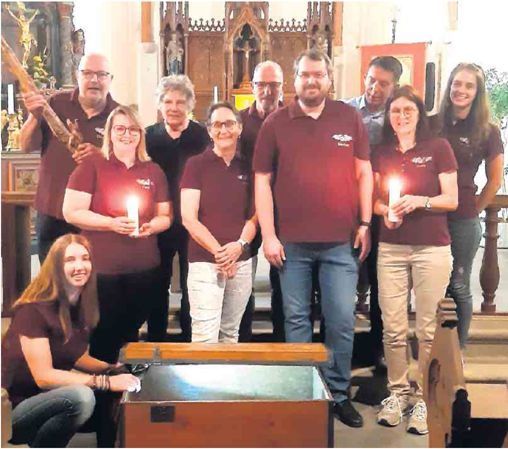
„Der Holz-Rudi“ oder „Die unheilige Wallfahrt“ heißt die Komödie die die Theaterbühne Zingsheim gleich sechsmal aufführen wird.

Die Vorführungen der Komödie „Der Holz-Rudi“ in drei Akten, aus der Feder von Ralf Kaspari, finden an den folgenden Terminen statt: Freitag, 24. Oktober, 19 Uhr, Samstag, 25. Oktober, 19 Uhr Sonntag, 26. Oktober, 16 Uhr ab 14 Uhr Kaffee und Waffeln Freitag, 31. Oktober, 19 Uhr, Samstag, 1. November, 19 Uhr Sonntag, 2. November, 16 Uhr ab 14 Uhr Kaffee und Kuchen