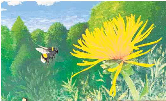
Eine eifrige Hummel mit gelber Blume schmückt mittlerweile einen Flur des Hauses Effata in Blankenheim. Dabei ist das Motiv nicht nur schön, sondern dient auch der Orientierung.

Die Idee ist so einfach wie wirkungsvoll: Jeder Wohnbereich erhält ein eigenes Thema - und damit ein eigenes Gesicht. Im zweiten Obergeschoss zieht nach und nach der „Bauernhof“ ein. Die erste Etage soll künftig mit Gartenmotiven gestaltet werden. Das Ganze entsteht direkt vor Ort - sichtbar für alle. „Konnten Sie schon immer so gut malen?“ ist dabei die wohl meistgestellte Frage an die künstlerisch begabte Mitarbeiterin Ursula Binnen, die