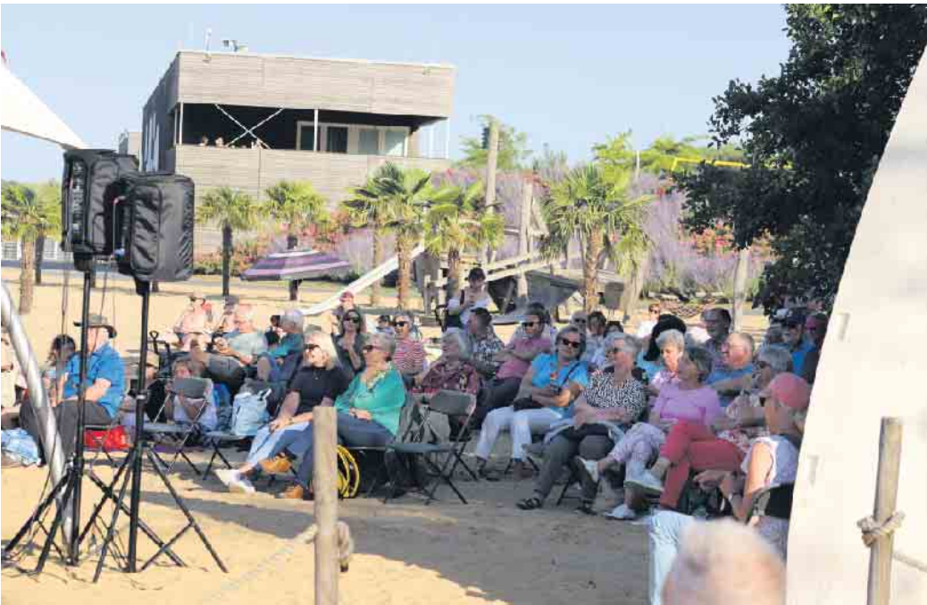
Regelmäßig finden im Sommer kleine, akustische Konzerte am Strand im Seepark Zülpich statt. Die Resonanz der Besucherinnen und Besucher ist durchweg positiv

schätzte Lieder in Eifeler Mundart und Hochdeutsch sowie einige Coverstücke in Englisch, Französisch und Italienisch. Nicht zu vergessen die launigen Ansagen des Eifeler Songpoeten. Die im Jahr 2020 etablierte Konzertreihe Strandkultur mit Live-Musik am Seepark-Strand wird auch in diesem Jahr fortgesetzt. Lokale