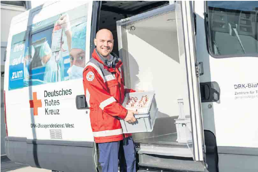
Der Rotkreuz-Kreisverband Euskirchen und der DRK-Blutspendedienst West rufen zu drei Blutspende-Terminen im August auf.

DRK im Kreis Euskirchen und DRK-Blutspendedienst West rufen zu drei Blutspende-Terminen im August auf - Kleiner Gesundheits-Check