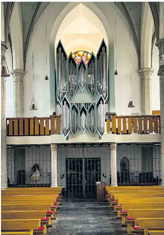
Orgel Gemünd.

Eine weitere Orgelführung findet statt in der Schlosskirche in Schleiden am Donnerstag, 14. August, um 11:30 Uhr, im Anschluss an das Konzert zur Marktzeit.