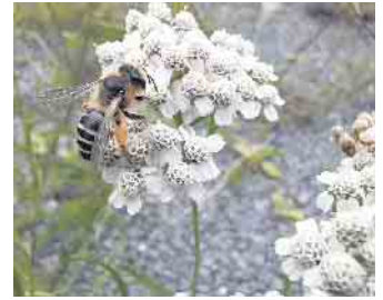
Die Gemeine Sandbiene ( Andrena flavipes ), eine häufige Sandbienenart.

Gestaltung von Kopf, Beinen, Fühlern oder charakteristischer Behaarung (z.B. zum Pollensammeln) können die Arten unterschieden werden. Wichtige Wildbienenfamilien werden vorgestellt, wie auch die häufigsten Insekten am Bienenhotel - wobei nicht nur Bienen, sondern eine ganze Lebensgemeinschaft dort ihr Auskommen findet. Anmeldung unter anfrage@nabear.de . Anmeldung: anfrage@nabear.de