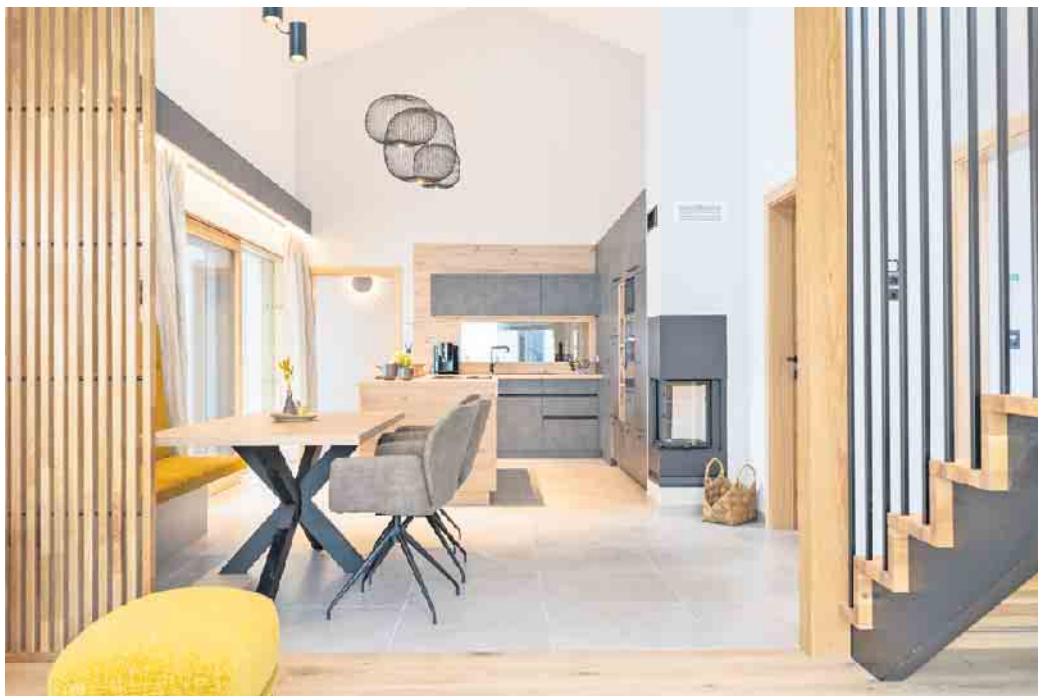
Unterschiedlich zonierte Bereiche und kurze Wege zwischen Küche, Essen und Wohnen unterstützen einen reibungslosen Familienalltag.

Wer ans Älterwerden in den eigenen vier Wänden denkt, setzt auf barrierefreie Übergänge, breite Flure sowie vielseitig nutzbare Räume. Auch eine Umstrukturierung des Familien-Grundrisses, wenn die Kinder aus dem Haus sind, sollte bedacht werden. „Bei einem Fertighaus können viele Lebensphasen - vom Alltag mit kleinen Kindern über das Arbei-