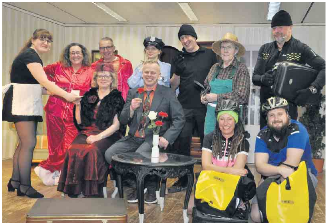
Am Samstag, 14. März, gibt der Theaterverein Einigkeit Rinnen 1920 e. V. ein Gastspiel in Gemünd - das Stück wird noch bekannt gegeben.

Weitere Informationen unter www.theaterfreunde-schleidenertal.de oder Tel. (0 24 49) 911 618.