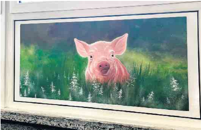
Auch ein Schwein, Teil des Themas „Bauernhof“, weckte bereits das Interesse der Bewohnerinnen und Bewohner.

Blankenheimer Seniorenpflegeeinrichtung verschönert Wohnbereiche