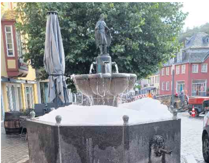
Schaum zu seinen Füßen beobachtete heute Morgen König Zwentibold auf seinem Sockel.

Ob Zwentibold in der Nacht im Schaumbad geplänscht hat, konnten die Mitarbeiter des städtischen Bauhofs am 3. August nicht mehr feststellen. Die Figur des einstigen Königs stand wie eh und je mit ausgebreiteten Armen erhaben über dem Brunnen auf seinem Platz. Das Wasser im Becken unter ihm war allerdings von einer dicken Schaumschicht bedeckt. Auch wenn er sich bei der Entdeckung unmittelbar am „Tat-