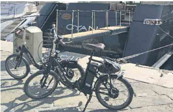
Im Urlaub sind die kompakten E-Falträder ideale Begleiter.

gewinnt, wer ein kompaktes E-Faltrad mit an Bord hat und am Urlaubsziel Ausflüge auf zwei Rädern unternehmen kann. Das gilt nicht nur, aber vor allem auch für Wohnmobilreisende. Kompakte Größe ist ideal - nicht nur für Wohnmobilsten Moderne E-Falträder haben mit den Klapprädern aus den 70er- und 80er-Jahren wenig zu tun. Sie lassen sich zwar noch immer in der Mitte zu einer handlichen, leicht transportablen Größe zusammenklappen, nunmehr ist