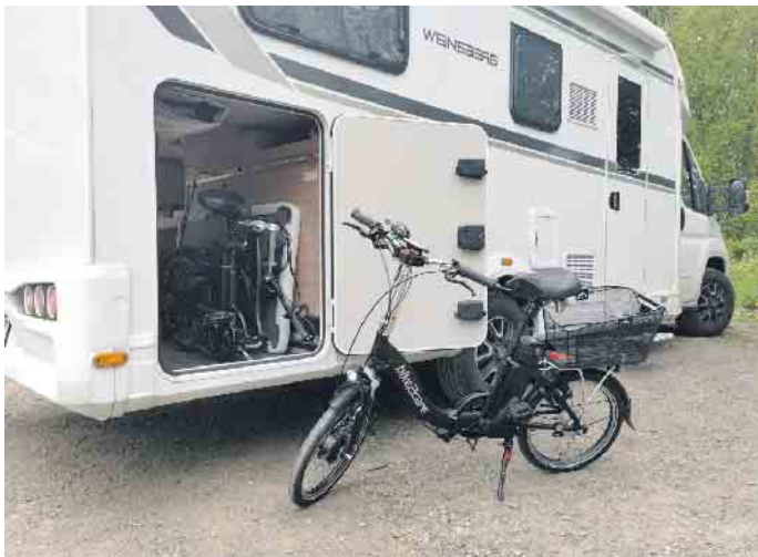
E-Falträder lassen sich in jedem Kofferraum und auch im Wohnmobil transportieren.

Gefühl der Sicherheit. Dafür sorgen der tiefe Einstieg der Räder und die Tatsache, dass man mit beiden Füßen sicher auf den Boden kommt. Vom Anbieter bike2care etwa gibt es zudem komfortable und bequeme E-Falträder mit und ohne Rücktrittbremse. Das Design hat einen Hauch von Retro-Chic, die verwendeten Anbauteile stammen ausschließlich von Markenherstellern. Mehr Infos, einen Online-Shop mit dem passenden Zubehör und der Möglichkeit zur Konfiguration der Räder