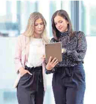
Fachkräfte der Fitness- und Gesundheitsbranche haben verschiedene Möglichkeiten, fundierte Kenntnisse und Fertigkeiten im Bereich Management zu erlangen.