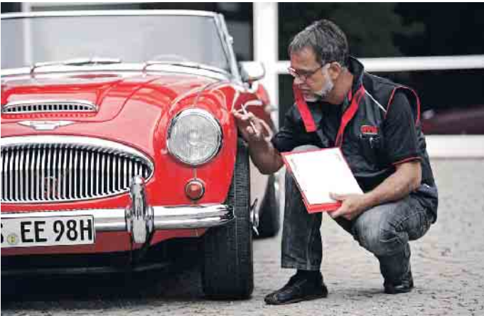
Vor der Erteilung eines H-Kennzeichens muss erst ein Ingenieur das Auto überprüfen und die Originalität beurteilen.

Exakt drei Jahrzehnte nach ihrer Erstzulassung können Autos ein H-Kennzeichen bekommen. Aber längst nicht alle Oldtimer fahren auch mit H. Denn das ist nicht immer günstiger und hat zudem einige Verpflichtungen zur Folge. Wann sich ein H-Kennzeichen lohnt, schildert die Zeitschrift Auto Straßenverkehr in ihrer aktuellen Ausgabe 16.