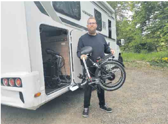
E-Falträder werden durch einen leistungsfähigen Elektromotor angetrieben und lassen sich in der Mitte bequem zu einer handlichen, leicht transportablen Größe zusammenklappen.