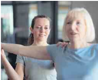
Über alle Lebensphasen hinweg trägt von Fachkräften betreutes Fitness- und Gesundheitstraining maßgeblich zur Gesunderhaltung bei.