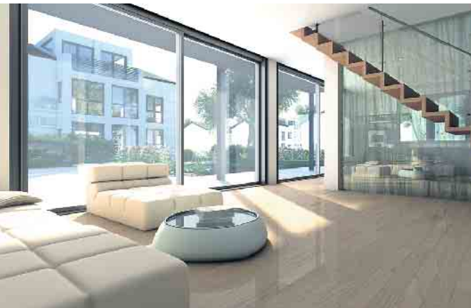
Gerade bei frei zugänglichen Terrassentüren bietet sich Sicherheitsglas besonders an.

Warum Sicherheitsglas auch zu Hause sinnvoll ist