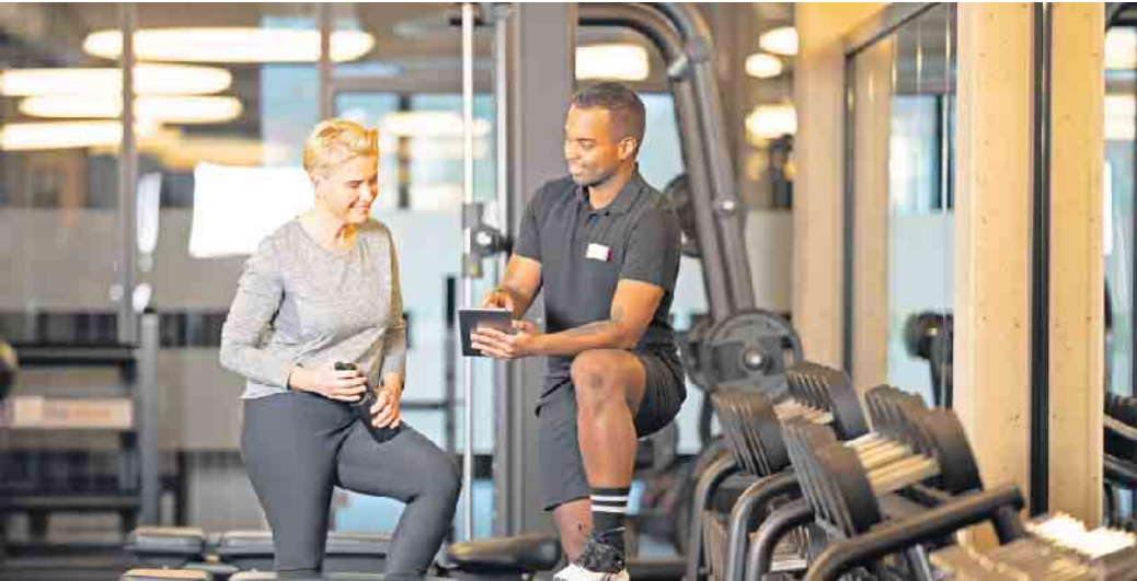
Wer trainiert, möchte dabei gut betreut sein: Fachkräften bieten sich in der Fitness- und Gesundheitsbranche sehr gute berufliche Perspektiven.

Studium/Ausbildung: Gute Perspektiven in der Fitness- und Gesundheitsbranche