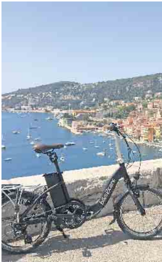
Urlaubsglück mit Ausblick: Auch im Urlaub sorgen die kompakten E-Falträder für viel Bewegungsfreiheit.

cket ist ebenfalls nicht nötig. Zu Stoßzeiten sind öffentliche Verkehrsmittel ohnehin meist so voll, dass Fahrräder nur mit Mühe transportiert werden können, für das Faltrad findet man immer ein Plätzchen. Das gilt allerdings auch nur dann, wenn das Faltrad qualitativ hochwertig ist und entsprechend schnell und bequem klein gemacht werden kann. (djd)