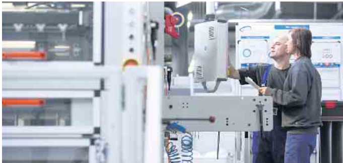
Ausbildung an hochmodernen Produktionsmaschinen in der Faltschachtel-Industrie.

Kennen Sie Unboxing-Videos? Das sind Filme, die Menschen beim Auspacken von Produkten zeigen. Auf YouTube gehören sie schon seit vielen Jahren zu den beliebtesten Formaten und werden millionenfach angeklickt. Man kann das kurios finden. Der Unboxing-Trend zeigt aber, wie inspirierend Verpackungen auf Menschen wirken können. Ob Lebensmittel, Kleidung oder Kosmetik - wir schätzen es, wenn die Dinge des täglichen Lebens in ansprechenden Faltschachteln, Beuteln, Dosen oder Flaschen angeboten werden.