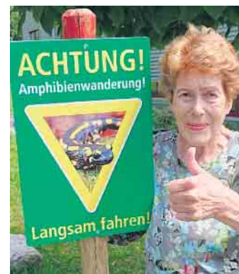
Das Warnschild zum Schutz der Salamander ist endlich angebracht.

Ende: Aus der Arbeit der Parteien FDP Hellenthal