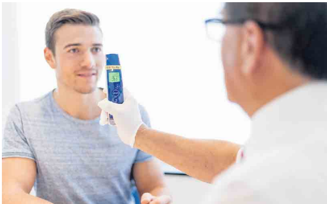
Zu einem Blutspendetermin gehören natürlich auch entsprechende Untersuchungen und ärztliche Beratung.

Es wird weiterhin darauf hingewiesen, dass bei den Blutspendeterminen die 3G-Regelung gilt. Zutritt ist also nur Personen gestattet, die den Status geimpft, genesen oder getestet (Antigen-Schnelltest nicht älter als 24 Stunden oder PCR-Test nicht älter als 48 Stunden) vorweisen können.