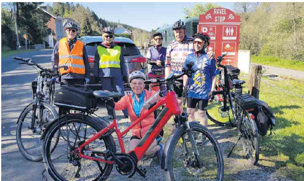
Mit dem Rad auf Tour