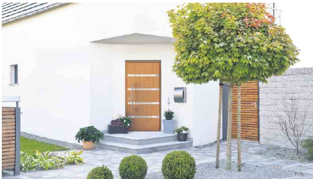
Natürlich anmutende Tür in modernem Design.