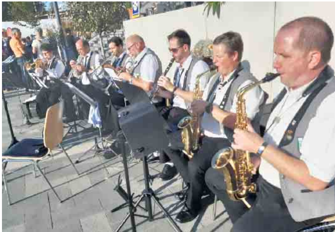
Bereits zum Jahrestag des Hochwassers Mitte Juli spielte die Musikkapelle Kall auf dem Bahnhofsvorplatz. Am 21. August lädt sie dort zum Sommerfest.

Nach zwei Jahren Pause startet die Musikkapelle mit einem eintägigen Fest - in früheren Jahren begann das Sommerfest bereits am Samstagabend. Bei der Bewirtung der Gäste mit Speisen und Getränken unterstützen diesmal externe Dienstleister, auch, da die Musikkapelle durch das Hochwasser eigene Buden und Geräte verloren hat. Für das Kuchenbüfett am Sonntagnachmittag sorgen Vereinsmitglieder und Angehörige. Die Musikkapelle probt freitags ab 19.30 Uhr in der Alten Schule (Aachener Str. 51). „Wir freuen uns über Musikinteressierte, die im Orchester mitspielen wollen. Wer Lust hat, kann gerne bei einer Probe vorbeikommen“, sagt Reinders. www.musikkapellekall.de , Facebook: MusikkapelleKall Instagram: musikkapellekall