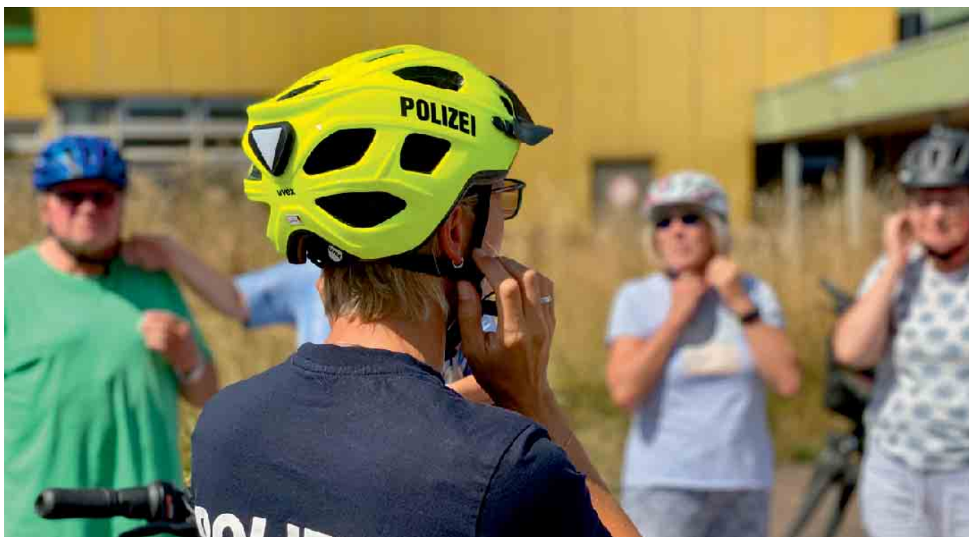
Kostenfreie Pedelec-Trainings für Seniorinnen und Senioren ab 65 Jahren - Polizei Euskirchen erweitert Angebot erstmals kreisweit.