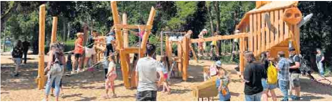
Zahlreiche Kinder erfreuten sich über den neuen Spielturm im „Wildschwein-Design“.

dient nicht nur der Bewegung und körperlichen Fitness, sondern auch als Kommunikationsplatz, auf dem man sich austauschen und nebenbei etwas für die Gesundheit tun kann.