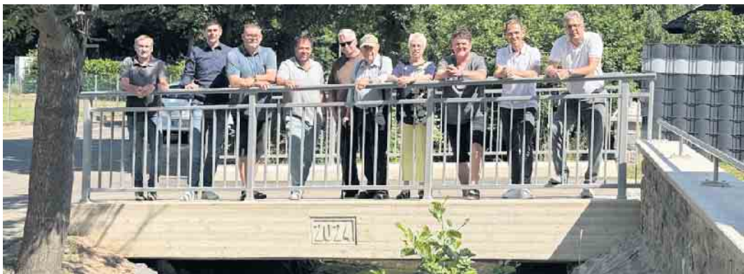
Zufrieden zeigten sich alle Beteiligten beim Ortstermin an einer der beiden neuen Rotbach-Brücken auf der Alten Bachstraße in Schwerfen.

In der Alten Bachstraße sowie der Straße An der Güllichsburg in Schwerfen fließt der Rotbach direkt neben der Straße. Die östlich gelegenen Grundstücke sind deshalb seit jeher ausschließlich über mehrere, kleinere Brücken zu erreichen. Auf der Alten Bachstraße wurden drei dieser Brücken bei der Flutkatastrophe im Juli 2021 so stark beschädigt, dass sie abgerissen werden mussten. Mit Mitteln aus dem Wiederaufbaufonds des Landes NRW wurden an selber Stelle zwei neue Brücken errichtet, die mittlerweile auch in Betrieb genommen werden konnten. Zwei Brücken deshalb, weil zwei der zerstörten Brücken derart nah beieinander standen, dass in Abstimmung mit den Anwohnern entschieden wurde, dort nur noch eine leistungsfähigere Brücke zu errichten, um somit Hemmnisse für den Durchfluss des Rotbachs zu verringern. Die beiden Stahlbetonbrücken wurden nach neuesten technischen und