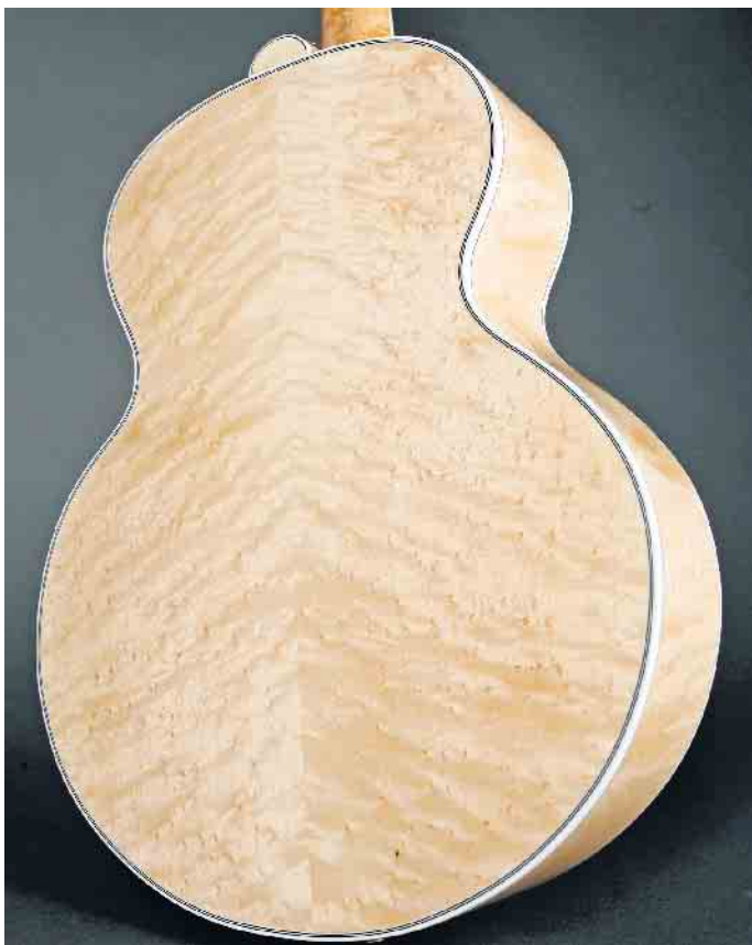
Ahorn-Furnier verleiht dieser Gitarre das gewisse Etwas.