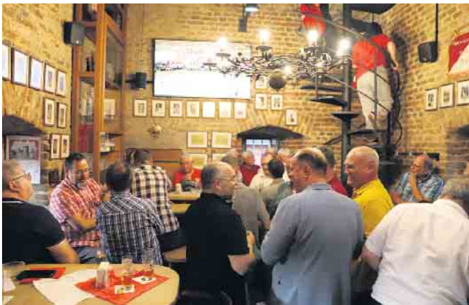
Ein Gefühl von Heimat: das Gardequartier platzte beim Münstertor-Abend sprichwörtlich wieder aus allen Nähten.

Gardequartier platzte beim Münstertor-Abend sprichwörtlich wieder aus allen Nähten