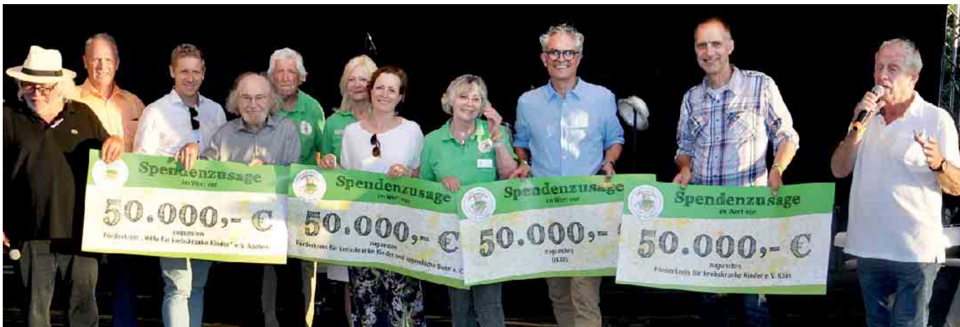
Vier symbolische Schecks über je 50.000 Euro übergaben Mitglieder der Hilfsgruppe Eifel an die Deutsche Knochenmarkspenderdatei und an die Fördervereine der Universitäts-Kinderkliniken Bonn, Köln und Aachen.

25. Jubiläum mit Peter Orloff, furioser Abba-Show und 200.000 Euro für die Hilfsgruppe Eifel