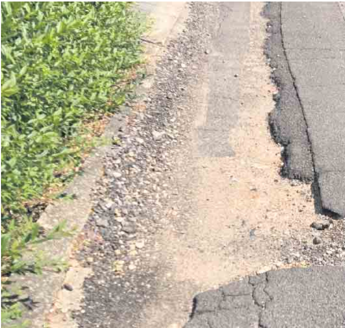
Mittlerweile das übliche Straßenbild in Kall

Ende: Aus der Arbeit der Parteien CDU Kall