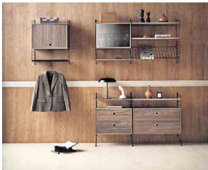
Edel und einzigartig: Furnierte Möbel.

ebenenmäßiger Wuchs und der Stamm muss für eine perfekte Verarbeitung möglichst rund und kenzengerade sein. „Auch ein gleichmäßiges Rindenbild ist wichtig - am besten ohne störende, große Äste“, so Groh. Spuren von Blitzschlag, Hagel oder Insektenbefall führen ebenfalls dazu, dass ein Baum als Furnierlieferant ausscheidet. Ist das richtige Exemplar schließlich von einem geschulten Auge ausgesucht und ins Furnierwerk transportiert worden, wird der Baumstamm nachhaltig und materialschonend Schicht für Schicht mit verschiedenen Methoden in attraktives Furnier verwandelt. Die vielen Anwendungsbereiche von Furnier