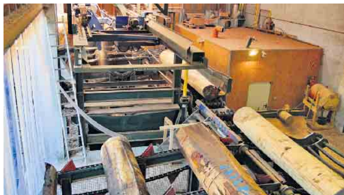
Furnierbäume bei der Verarbeitung.