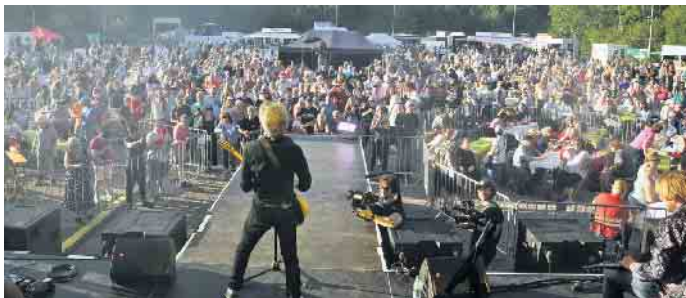
1700 Zuschauer wurden bei der 25. Eifeler Oldienacht auf dem Papstar-Gelände in Kall gezählt. Die segensreiche Veranstaltungsreihe hatte im Jahr 2000 als „Mechernicher Oldienacht“ begonnen.