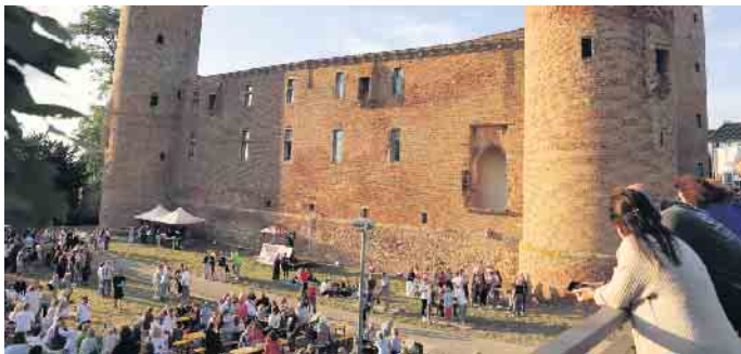
Die gewaltige Kulisse zwischen Burg und dem Rosengarten Rosarium Tolbiacum bot dabei Raum für ein entspanntes Zusammensein unter Freunden.

Beleuchtung der Burgmauern rundete den Abend ab, bevor man im Anschluss durch die Straßen der Stadt weiterziehen oder einen abendlichen Spaziergang durch Zülpich genießen konnte. FH