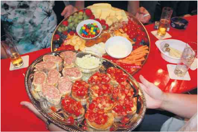
Bei gekühlten Getränken und gutem Essen verging der gesellige Abend wie im Flug