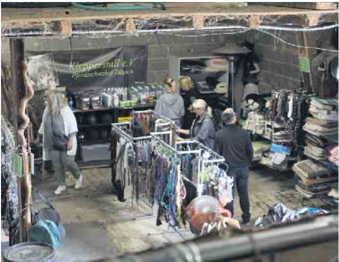
Die hofeigene Scheune lud zum Schlendern und Shoppen ein