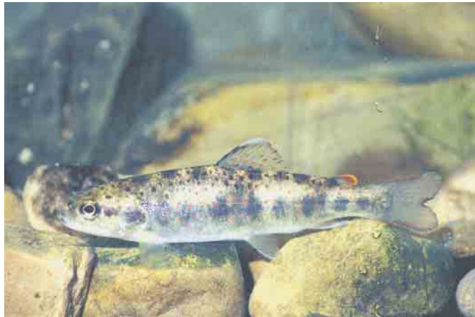
Die Bachforelle erholt sich offenbar gut von den Folgen der Flut.