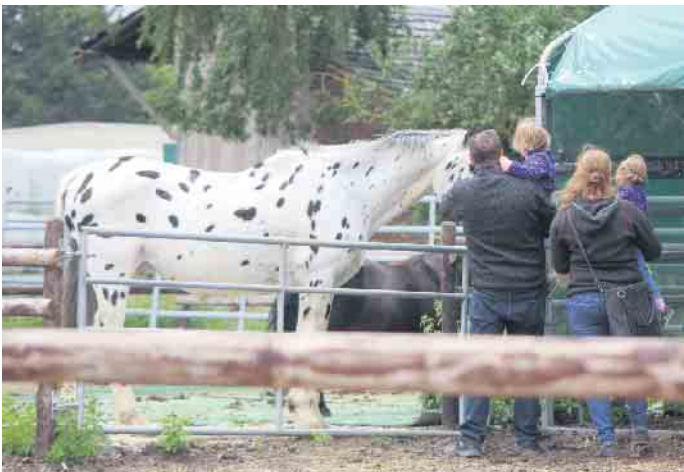
Pferde zum streicheln fanden Interessierte auch vor Ort