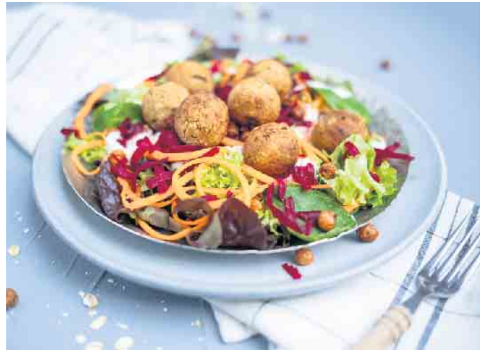
Hafermahlzeiten wie eine Salat-Bowl mit Haferbällchen lassen sich gut vorbereiten.

Trend ist, dass man ganz bewusst frische gesunde Zutaten verwendet. So lassen sich beispielsweise zahlreiche Gerichte und Snacks mit Hafer gut vorbereiten und mitnehmen. Die Vollkornflocken liefern dem Körper wertvolle Ballaststoffe und Vitamine wie Vitamin B1, welches das Nervensystem und die Konzentration unterstützt. Zudem helfen Hafermahlzeiten dabei, den Cholesterinspiegel zu senken. Sie sind wahre Energiebooster und halten lange satt, ohne den Magen-Darm-Trakt zu belasten. Overnight Oats oder ein Porridge mit Früchten und Nüssen für das zweite Frühstück im Büroalltag sind schnell am Abend vorher zubereitet. Leckere Snacks zum Mitnehmen sind auch ein Bananen-Haferbrot oder „Italian