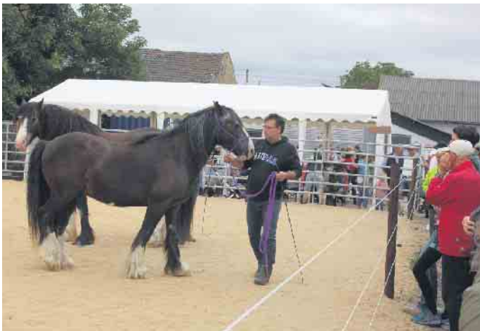
Beim Hof-Fest wurde den Besucherinnen und Besuchern den ganzen Tag über einiges geboten