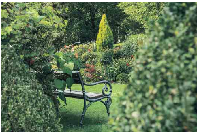
Rasengrab oder Bestattung im Blumengarten.

Urnenwand, Blumengarten oder klassische Beisetzung