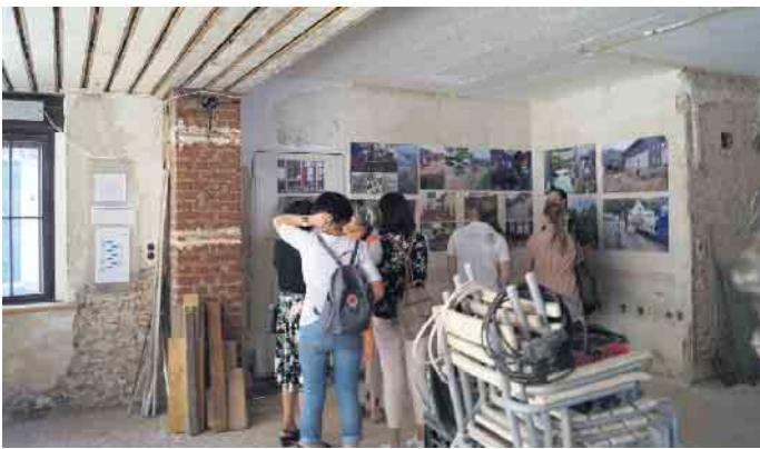
Die Fotodokumentation, gezeigt in den noch weitgehend unrenovierten Räumen der Familie Obertreis, stieß beim Publikum ganztägig auf sehr viel Interesse.

Interesse. Fotos und eine Videopräsentation zeigten Bilder von Straßen, Gebäuden, Gärten und Gewässern in Nettersheim, die in der Flutnacht und den Tagen danach aufgenommen worden sind. Weiter auf der Bahnhofstraße und auf der Steinfelder Straße war das Angebot dann mehr auf das ausgerichtet, was ein Jahr nach der Flutkatastrophe wieder möglich ist. Im Gebäude neben der Dokumentation waren Werke der Künstlerin Gisela Gross zu sehen (Bilder) und von Irene Lösener (Bücher). Bei bestem Sommerwetter spielte der Jugendspielmannszug, nutzten u.a. viele betroffene Gewerbetreibende die Gelegenheit, für sich zu werben, darunter die Textilschmiede Bauerfeind, das Reisebüro „Reise erleben“, der „Raum zum Dasein“ der Bioladen „nature“. Auch die lange Schlange vor der Eisdiele gehörte ganztägig mit zum Bild. Die örtlichen Gaststätten und Cafés waren gut besucht. Viele positive Rückmeldungen erhielt Inhaber Martin Schwall, der die zukünftigen, noch