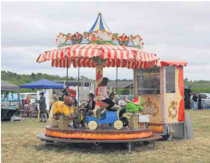
Nicht nur das Kinderkarussell ließ die Augen der Kinder strahlen