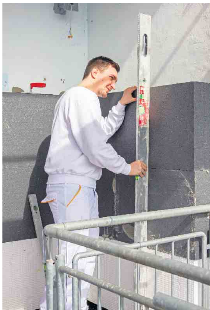
Die Ausführung durch einen erfahrenen Fachbetrieb sorgt für Langlebigkeit und Wirksamkeit der Dämmung.