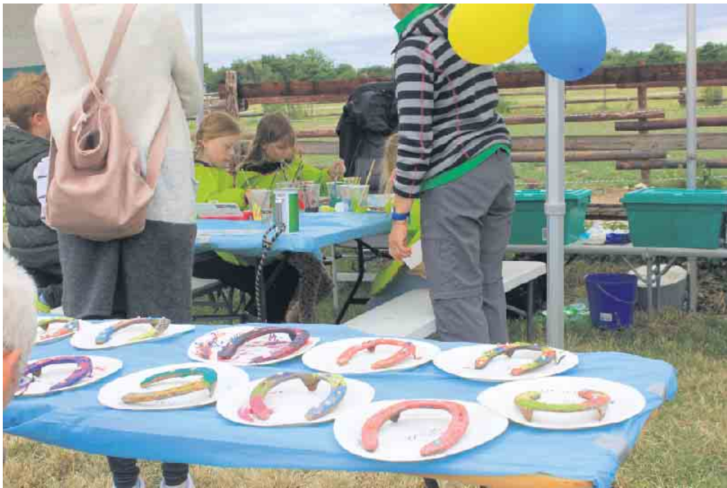
Das bemalen von Hufeisen war sehr gefragt - sollen ja richtig aufgehungen Glück bringen

off weiter: „Wie das in den nächsten Monaten weiter geht wissen Wir noch nicht, aber Wir