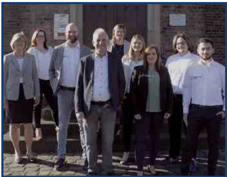
Wir sind Ihr Team und freuen uns, Ihnen weiterhelfen zu können.

Hörsysteme sind heute so klein und unscheinbar, dass man sie kaum wahrnimmt. Technisch auf höchstem Niveau bieten sie einen optimalen Tragekomfort, der es Ihnen erlaubt, sich schon nach kurzer Zeit an Ihr Hörgerät zu gewöhnen.