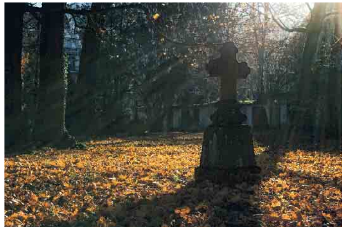
Sterben und Abschiednehmen gehören zum Leben dazu und jeder hat ein Recht auf seine persönlichen Trauerrituale.

„Die Frage, ob sich ein Verlust ohne diese Ausnahmesituation