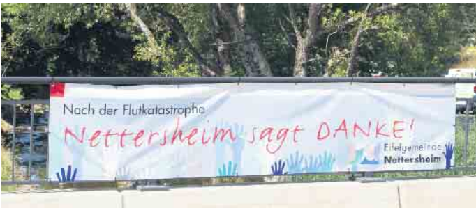
„Nettersheim sagt Danke“ - für die erfahrene große Hilfsbereitschaft und Solidarität.