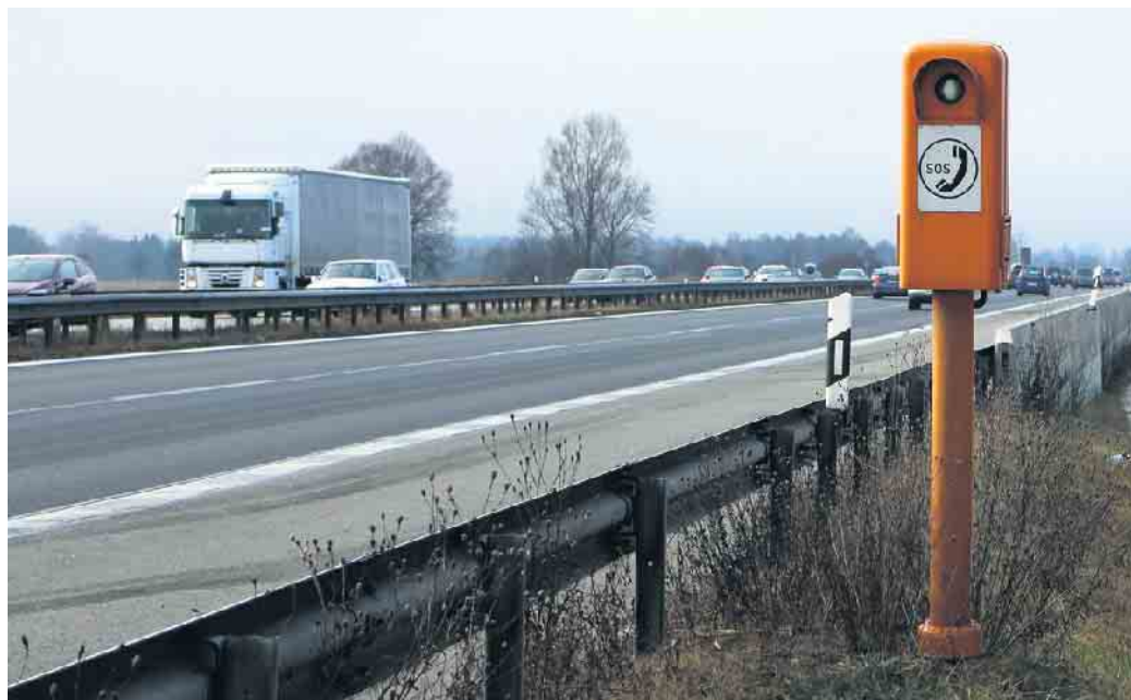
Alle zwei Kilometer steht eine Notrufsäule an der Autobahn. Ein Pfeil und eine Zahl auf den Leitpfosten geben Richtung und Abstand an.

Notrufsäulen haben eine selbst-erklärende Funktion: Bei Notfällen kann dort Hilfe gerufen werden. Aber auch wenn das Auto eine Panne hat und nicht mehr weiter möchte, kann man dort die rettenden Engel bestellen. Obwohl die meisten Menschen in Notfällen zum Handy greifen, laufen diese schon mal Gefahr, dass ihnen der Saft ausgeht - natürlich