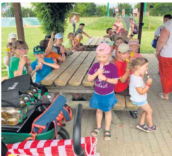
In Bubenheim hatten die Kinder und Jugendlichen bei schönstem Wetter so viele Möglichkeiten, eine tolle Zeit zu verbringen, dass ein Tag an sich eigentlich gar nicht ausreichte

es Abschied zu nehmen. Mit vielen tollen Erinnerungen und Eindrücken trat man am frühen Abend den Heimweg gen Zülpich an. Und es wird sicherlich nicht der letzte Ausflug ins Bubenheimer Spieleland gewesen sein. Auf Wiedersehen. FH