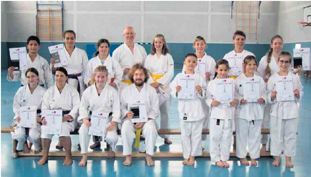
Kyu-Prüflinge nach bestandener Prüfung