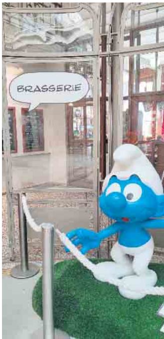
Die Schlümpfe im Comicmuseum

kehrte die Reisegruppe am späten Abend wieder nach Schleiden zurück. Ein großer Dank auch an den Förderverein SLEIDANIA und