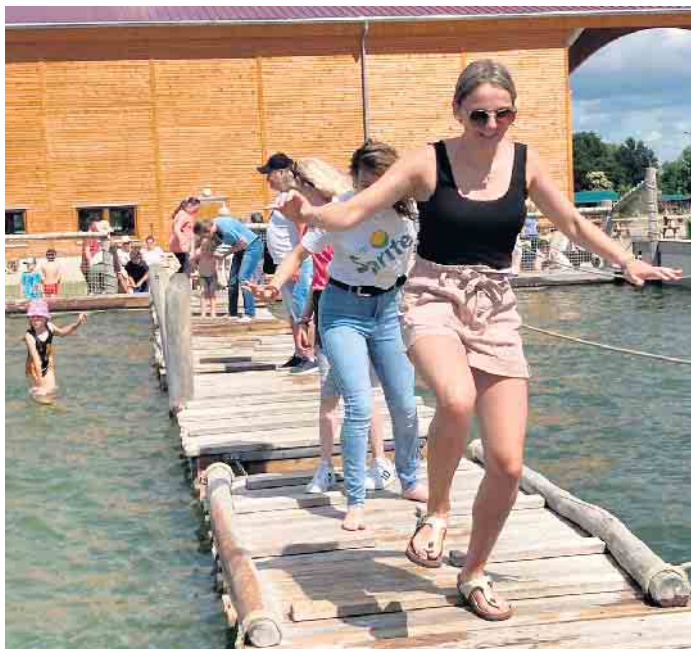
Die Erweiterung des Spielgeländes um 30.000 m 2 mit riesiger Wasserlandschaft, Floßbecken und bespielbarem Wasserturm ist seit dem letzten Sommer das neue Highlight

Fleißig wurde getobt, gespielt, gesprungen und geklettert - und das alles inmitten von Feldern und Bäumen auf dem Land. Die Kombination aus Spiel und Land- erleben ist das Alleinstel- lungsmerkmal des Freizeitparks und wurde von allen Teilneh- menden sehr genossen und wert- geschätzt. Zur Stärkung gab es eine leckere Verpflegung für Alle. Klar, dass die Kinder und Jugendtanzgarde auch den großen Abenteuerspielplatz mit Kletter- park, Wasserspielplatz, Boots- Wasser- und Riesenteppich- rutsche, Gokart-Bahn, Fußball- arena, Kletterpyramide, Tramp- poline, Affenschaukel, Wasser- und Sandspielplatz ausprobierte. Die