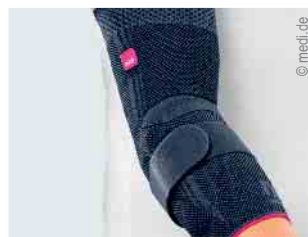
Versorgung von Ellbogen und Schulter