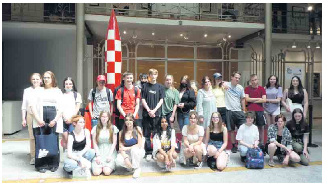
Die Gruppe im Comixmuseum.

Französischkurse des JSG Schleiden auf Exkursion im Brüsseler Europaparlament