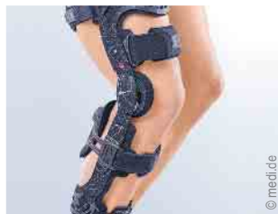
Versorgung des Kniegelenks