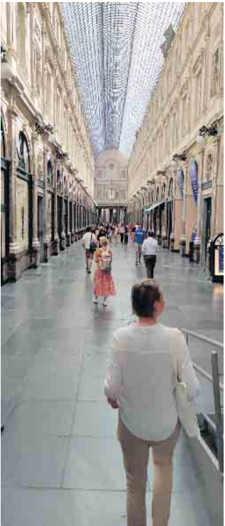
Impressionen aus der Einkaufsstadt Brüssel: Die Galerie Hubert

zum Besucherzentrum des Europaparlaments selbst. Im Parlamentarium konnten die Schülerinnen und Schüler die aktuelle Zusammensetzung des Parlaments mit Legofiguren erfahren, Arbeitsfelder und Aussagen der jetzigen Mitglieder verfolgen und vor allem ihre eigenen Wünsche für Europa formulieren. Auf einer Videowand wurden sie mit einem Selfie der Verfasserinnen gleich veröffentlicht. Wünsche an Europa formulierten die Schülerinnen und Schüler gerne, besonders wichtig war ihnen der Friede aber auch das Eintreten für Frauenrechte und der Kampf gegen Homophobie. Bei heißem Sommerwetter war der klimatisierte Museumsbesuch insgesamt sehr angenehm. Etwas bunter wurde es danach im „Musée de la bande dessinée belge“, dem Comicmuseum in Brüssel. Dort warteten die Schlümpfe, aber auch andere berühmte Comichelden wie Tim und Struppi, Astérix und Lucky Luke auf die jungen Besucher. Mit den passenden Souvenirs ausgestattet ging es dann noch in die Brüsseler Altstadt, wo neben den Sehenswürdigkeiten auch die belgischen Köstlichkeiten wie Pralinen, Waffeln und Pommes Frites erkundet wurden. Nebenher zeigte der ortskundige Busfahrer noch die Botschaftsmeile und den Königspalast. So viel erstrahlte nun im renovierten Glanz und die Schülerinnen und Schüler waren sich einig, dass Brüssel nicht nur viel zu bieten hat, sondern auch einfach wunderschön ist. Mit vielen lebendigen Eindrücken und einem positiven Europagefühl