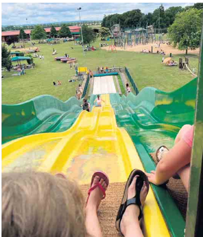
Ausblick von der Riesenteppichrutsche

3000 qm große Allwetterhalle mit 16er Trampolinanlage, Kletter- gerüst und Kletterwand und vielen weiteren Spielmöglichkeiten wurde auch sehr gut ange- nommen.