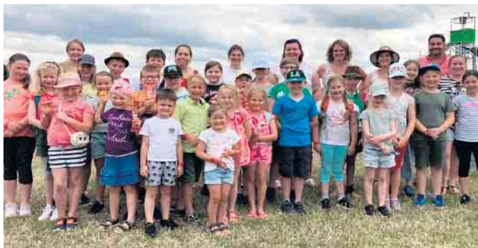
Das Bubenheimer Spieleland war das Ziel des Ausfluges Ende Juni

Kinder- und Jugendtanzgarde besuchte das Bubenheimer Spieleland