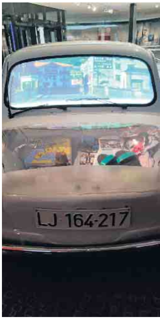
Haus der europäischen Geschichte: Die neuen Urlaubsmöglichkeiten