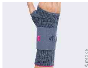
Versorgung der Hand