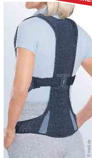
Versorgung des Rumpfs

NEU in Mechernich: Mittwochs bis 18 Uhr geöffnet und jeden 1. & 3. Samstag im Monat von 09-13 Uhr!