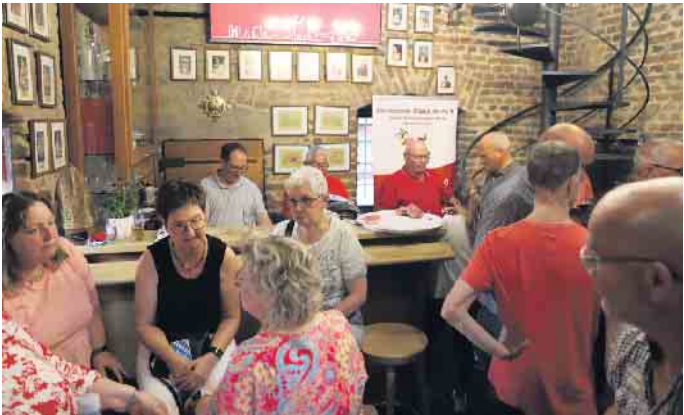
Das Gardequartier wurde beim Münstertor Abend wieder zum Ort der Heimat und des Wohlfühlens

der Prinzengarde begrüßen zu dürfen. Was wäre die Prinzengarde ohne ihre Mitglieder und was wäre der Münstertor-Abend ohne seine Gastgeber. Wir sehen hier die große Ecke mit unseren Freunden aus Rövenich. Darunter befinden sich auch die heutigen