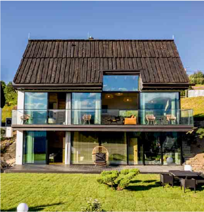
Wo viel Glas für wohngesundes Tageslicht gefragt ist, sollte auch an einen Schutz vor Überhitzung der Innenräume gedacht werden.