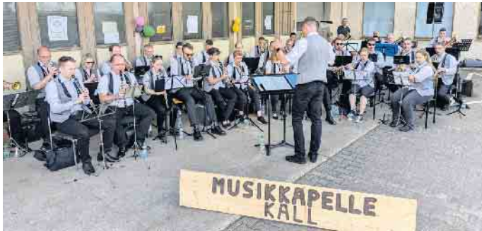
Wie im vergangenen Jahr lädt die Musikkapelle Kall unter Leitung von Marco Leibach auch für dieses Jahr wieder zu ihrem Sommerfest hinter der alten Post in Kall ein.