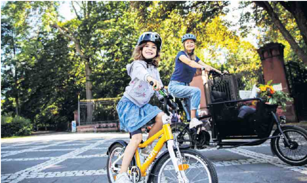
Radeln für ein gutes Klima: Vom 23. Juni bis 13. Juli findet zum vierten Mal die Aktion STADTRADELN in Zülpich statt.

Auf die Räder! Fertig! Los! Vom 23. Juni bis 13. Juli sind alle Zülpicherinnen und Zülpicher wieder eingeladen, sich aufs Fahrrad zu schwingen und bei der Aktion „STADTRADELN“ mitzumachen. An insgesamt 21 Tagen wird dabei in die Pedale getreten, sodass möglichst viele Kilometer gesammelt werden können. Beim STADTRADELN geht es um den Spaß am Fahrradfahren, aber vor allem auch darum, möglichst viele Menschen für den Umstieg auf das Fahrrad im Alltag zu gewinnen und dadurch einen Beitrag zum Klimaschutz zu leisten. Denn etwa ein Fünftel der klimaschädlichen Kohlendioxid-Emissionen in Deutschland entstehen im Straßenverkehr. Sogar ein Viertel der CO 2 -Emissionen des gesamten Verkehrs verursacht der innerörtliche Verkehr.