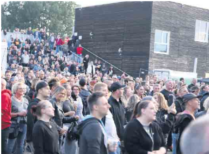
Die große Rammstein-Tributshow beeindruckte 750 Besucher im Seepark Zülpich