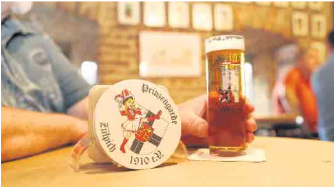
Gardequartier wurde beim Münstertor Abend wieder zum Ort der Heimat und des Wohlfühlens