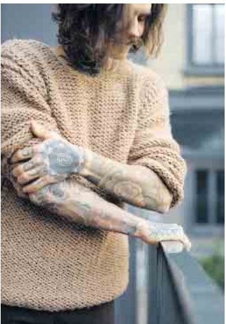
Zwischen den Behandlungen darf kein Sonnenlicht an die Haut kommen. Deshalb sollte man eine Tattooentfernung möglichst für die kühlere Jahreszeit einplanen.

Mit einem Tattoo ist es ein bisschen wie mit einer Ehe: Eigentlich soll es das ganze Leben halten, macht aber nicht immer dauerhaft glücklich. Mancher möchte dann den Körperschmuck wieder loswerden - vielleicht, weil das Motiv über die Jahre verblasst und unschön geworden ist, womöglich aber auch, weil das in Urlaubs-laune gestochene Bild nach der Rückkehr in den Alltag einfach peinlich ist. Heute ist es mit einer Laserbehandlung möglich, Tattoos recht effektiv wieder zu entfernen. Dabei werden die Farbpigmente