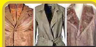
Leder & Lammfell

Wir prüfen kostenlos Ihren schmuck auf Echtheit