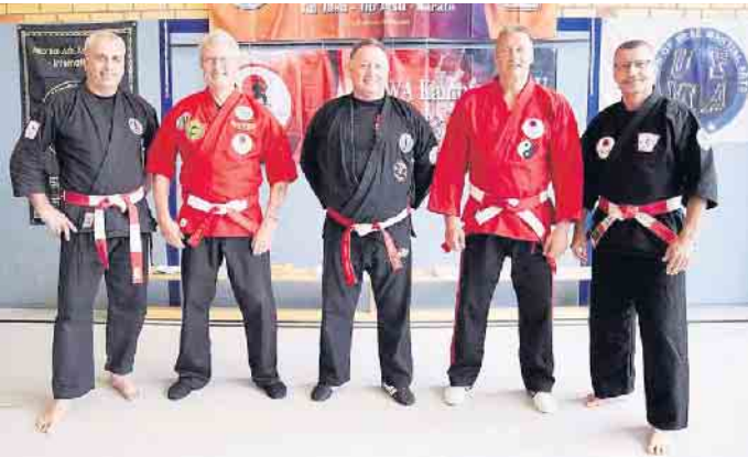
Organisatoren des Budo Seminar Eifel

ausgesucht und so können Sportler andere Menschen mit ihrem Sport unterstützen. Die Übergabe des symbolischen Spendenschecks und einer Spendensumme von 1.208 Euro fand zwischen den Organisatoren der Budo Abteilung des TuS Schleiden 08 und der Taiwa Style QinNa Züllich statt. Infos zur Hilfsgruppe Eifel: www.hilfsgruppe-eifel.de Organisatoren Taiwa Style QinNa: taiwa-style-qinna.de Budo Abteilung TuS Schleiden: www.jiu-jitsu-schleiden.com Bei Interesse kann kostenlos an einem Probetraining teilgenommen werden.