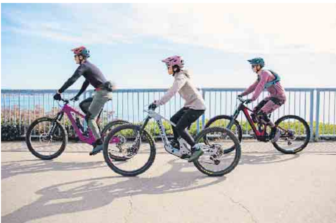
Sicher mit dem Fahrrad unterwegs: Dafür sind unter anderem die richtige Ausrüstung und eine gute Sichtbarkeit wichtig.

Helm, denn immer noch steigen 53 Prozent der Radl-Fans ohne Kopfschutz auf den Sattel. Allerdings ist Helm nicht gleich Helm. Die meisten Helme werden nur für den Fall eines linearen Aufpralls auf ihre Sicherheit getestet. Der Aufprall des Kopfes erfolgt bei einem Sturz aber meist nicht linear, sondern in einem Winkel. Dabei können gefährliche Rotationsbewegungen hervorgerufen und auf den Kopf des Fahrers übertragen werden. Gravierende Verletzungen durch Rotation „Unser Gehirn ist sehr komplex aufgebaut, unter anderem aus Millionen feiner Fortsätze der Nervenzellen. Durch Rotationsbewegungen können diese Nervenverbindungen und unter Umständen auch Blutgefäße regelrecht zerrei-