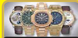
Markenuhren aller Art