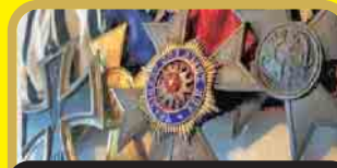
Militariat und Orden