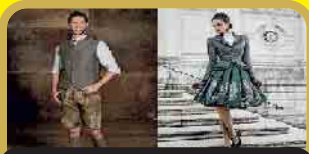
Trachtenmode aller Art