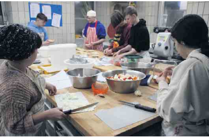
Der Belag wird vorbereitet.

die Koch-AG am JSG unter der Leitung von Carsten Schlott großer Beliebtheit. Gekocht wird zumeist mit regionalen und