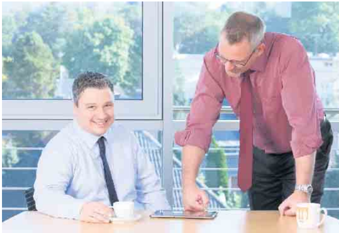
Immer häufiger wenden sich Jobsuchende an qualifizierte Personaldienstleister, die nicht nur Zeitarbeit anbieten, sondern Bewerbern auch dabei helfen, eine Festanstellung zu finden.