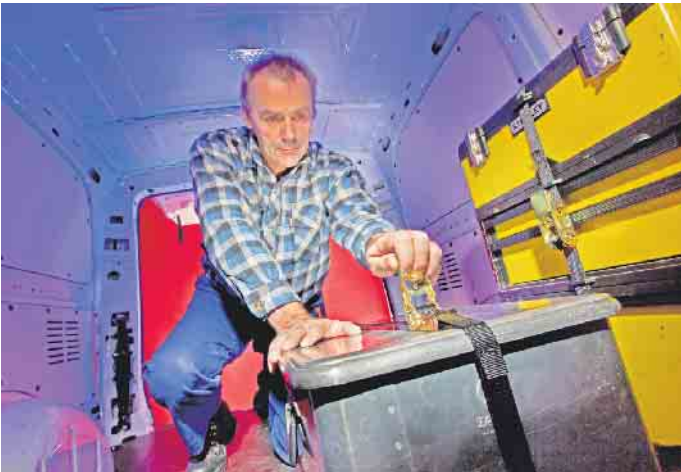
Fest verzurrt: Vor Fahrtantritt muss der Fahrzeugführer die Ladungssicherung kontrollieren. Dabei ist es egal, ob es sich um Baustellen- Utensilien oder das Urlaubsgepäck handelt.

Für die ordnungsgemäße Sicherung der Ladung ist stets der Fahrer verantwortlich