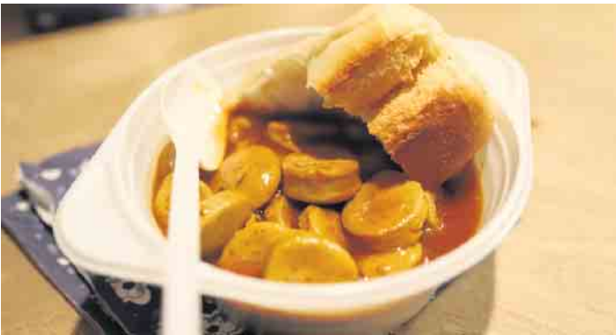
Bei gekühlten Getränken und gutem Essen, dieses Mal leckere Currywurst, verging der gesellige Abend wie im Flug

eine große Freude den Abend ausrichten zu dürfen. Sie freuten sich über den regen Zuspruch und ein volles Münstertor. Sodann verbrachte man gesellige Stunden zusammen. In gemütlicher Runde mit den Vereinskameradinnen und Kameraden sowie Freunden und Förderern wurden viele schöne Gespräche geführt. Bei gekühlten Getränken und gutem Essen, dieses Mal leckere Currywurst, verging der gesellige Abend wie im Flug. Was ein herrliches Ambiente. Ein rundum gelungener Abend im Zeichen der Traditions- und Brauchtumspflege im Gardequartier Münstertor der Prinzen- garde Zülpich 1910 e.V. FH