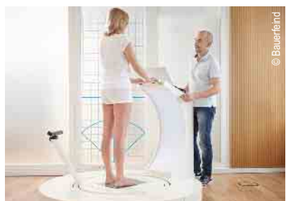
3D-Vermessung für Kompressionsstrümpfe und orthop. Einlagen