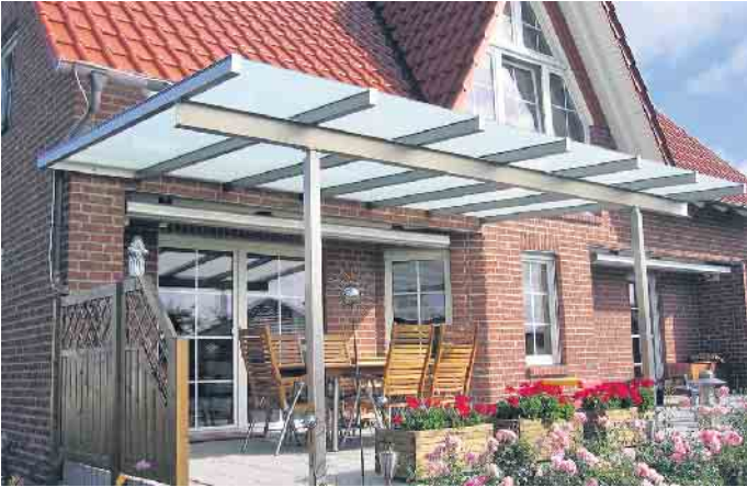
Terrassendächer sind vielseitig einsetzbar und bieten das besondere Etwas.

Verband gibt Tipps für die richtige Verglasung