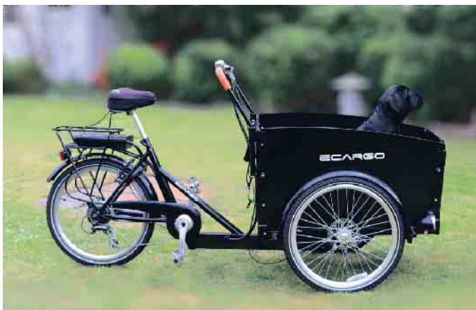
Grundsätzlich ist das Lastenrad eine sichere Methode, nicht nur Güter, sondern durchaus auch Kinder oder Tiere zu befördern.

müssen auf der Straße fahren. Eine Ausnahme zum verpflichtenden Fahrradweg ist nur vorgesehen, wenn das Rad zu breit ist oder die Qualität des Weges nicht zumutbar. Außerdem dürfen Lastenradfahrer auf dem Gehweg fahren, wenn sie unter Achtjährige begleiten.