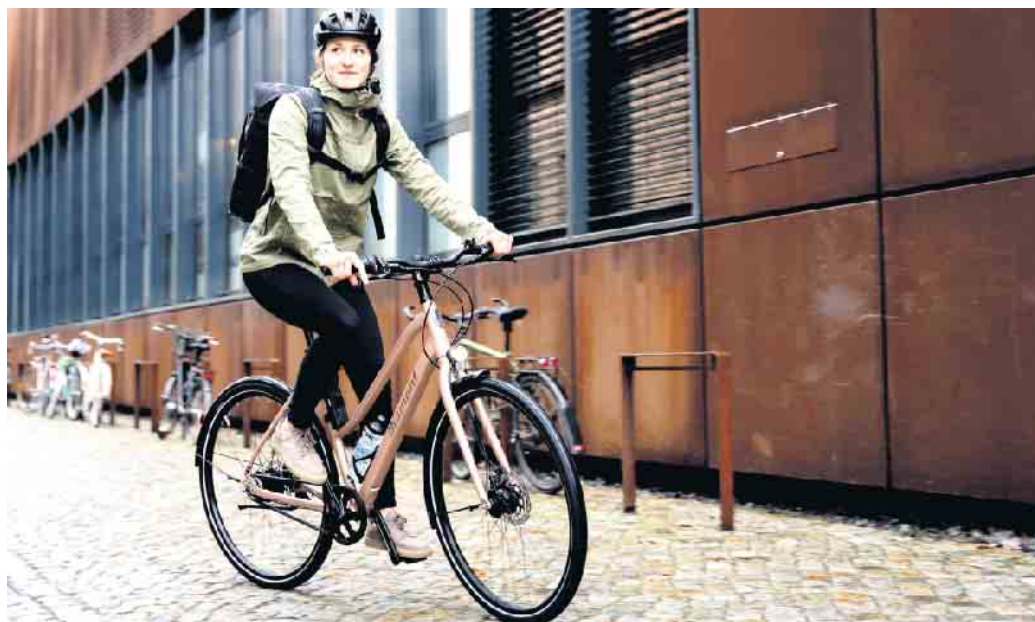
Ohne Stau zum Job: Gerade in Städten bietet sich das Rad als Alternative zum Auto an.

Wer sich für ein Dienstrad interessiert, findet zum Beispiel unter www.bike24.de Modelle für jeden Bedarf - vom Urban Bike über das MTB bis zum Lastenrad. Hier kann man zwischen acht renommierten Leasing-Anbietern wie JobRad, Bike-Leasing, BusinessBike oder anderen wählen. „Die Voraussetzung ist, dass man einen Arbeitgeber mit Sitz in Deutschland hat, der Fahrrad-Leasing anbietet“, so Martin-Birner. Das gewünschte Bike wird dann als Leasingfahrzeug bestellt, der Kundenservice leitet durch die weiteren Schritte. Am Ende der Leasingzeit kann das Rad entweder zurückgegeben oder günstig erworben werden. (DJD)