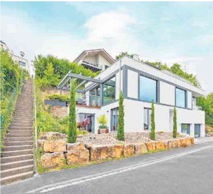
Fertigkeller sind ein sicheres Fundament für den Hausbau am Hang und bieten gegenüber kellerlosen Häusern dauerhaft mehr Wohnkomfort und Flexibilität. Foto: GÜF/Braun. Ihr Keller.

die ganze Familie bieten. Talseitig empfehlen sich große Räume und Fensterflächen, sodass stockwerksübergreifend reichlich Tageslicht ins Haus strömen kann“, sagt Stephan Braun. Gerade an kalten, aber sonnigen Tagen lassen große Fenster nicht nur den Wohnkomfort, sondern auch die Wärmegewinne merklich ansteigen, während die Heizkosten sinken. Auf Wunsch helfen moderne Sonnenschutzsysteme dabei, die im Sommer als angenehm empfundenen Temperaturen im Keller zu wahren. „Ein Untergeschoss am Hang ist dann auch ein idealer Platz für die Schlafzimmerr“, schließt Braun. (GÜF/FT)