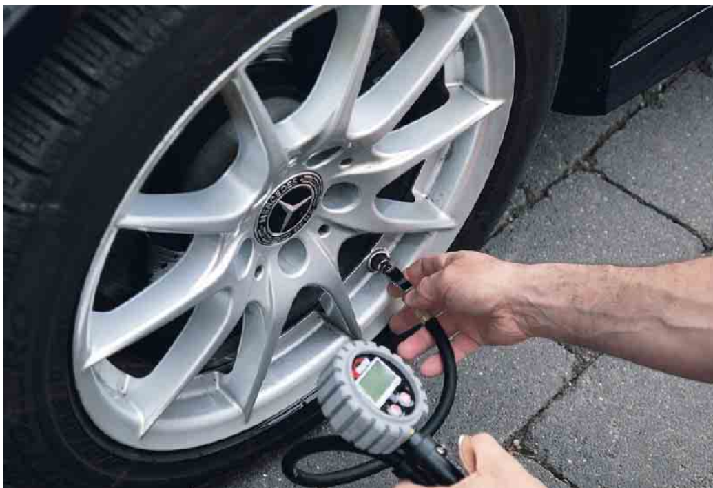
Autofahrer sollten den Reifendruck bei jedem Tankstellenbesuch überprüfen und gegebenenfalls anpassen.

Ebenfalls wichtig: Autofahrer sollten den Reifendruck bei jedem Tankstellenbesuch überprüfen und gegebenenfalls anpassen. Den werksseitig emp-