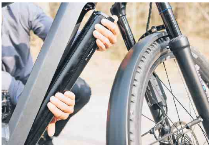
Der Akku bildet das Herzstück des E-Bikes. Mit dem richtigen Laden, Lagern und einigen Tipps zur Pflege lässt sich die Lebensdauer des Energiespenders verlängern.

Für die Reinigung des Akkus ist ein feuchtes Tuch empfehlenswert. Die Steckerpole sollten ab und zu gesäubert und leicht gefettet werden.