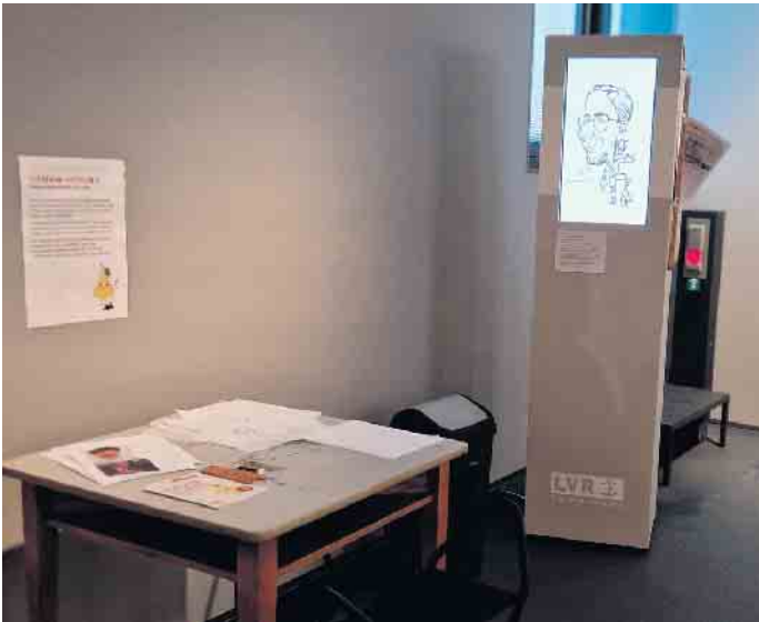
Mitmachstation 4 - Karikaturen selber zeichnen.

Ein kleines Begleitheft für Kinder samt Bastelutensilien ist kostenfrei. Ein Begleibuch zur kompletten Ausstellung, mit historischer Einführung und Bezug zur Entstehung des Museums, ist für 9,80 Euro im Museumsshop zu erwerben. Weitere Sonntagsführungen zu der Ausstellung finden am 4. August, 6. Oktober und 1. Dezember sowie am 5. Januar statt und sind kostenlos, man muss lediglich den Eintritt bezahlen. Eintrittspreise, Öffnungszeiten und weitere Informationen sind der Website zu entnehmen: roemerthermen-zuelpich.de MKe