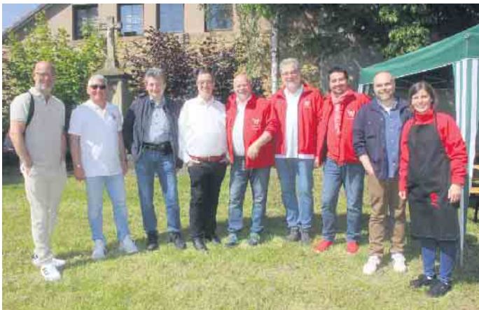
Vatertag bei der Prinzengarde Zülpich 1910 e.V.

Platz am Gardequartier Münstertor lud zum gemütlichen Beisammensein ein