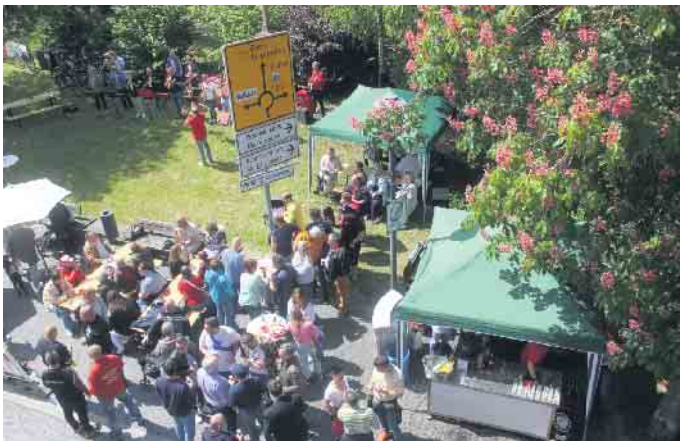
Der Platz am Gardequartier lud zum gemütlichen Beisammensein ein

Münsterstr. 15 · 53909 Zülpich · Telefon: 02252-8375714 Markt 11 · 50374 Erftstadt · Telefon: 02235-75123 mail@dost.nrw · www.dost.nrw