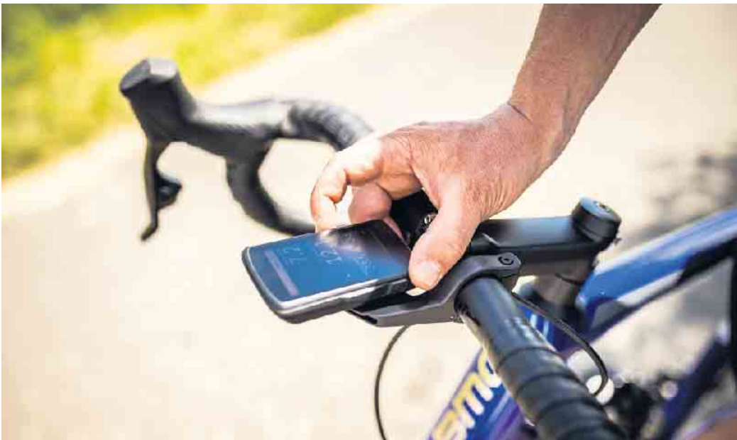
Mit zeitgemäßem Zubehör lassen sich auch ältere Räder gestiegenen Anforderungen anpassen.

Noch bequemer wird es mit Elektroantrieb: „E-Bikes werden von Jahr zu Jahr beliebter. Sie bieten eine tolle Möglichkeit, auch längere Strecken ohne große Anstrengung zurückzulegen.“ Außerdem sind E-Bikes mit vielen Zusatzfunktionen ausgestattet, die sich zum Teil auch für klassische Räder nachrüsten lassen: GPS-Tracker, Streckenmesser oder elektronischer Diebstahlschutz - Angebote gibt es etwa unter www.bike24.de . „Fahrräder und Zubehör werden immer smarter. Viele Funktionen lassen sich mit Apps auf der Uhr oder dem Handy verknüpfen“, so Martin-Birner. Seine Empfehlung für kaufwillige Fahrradfans: „Mit Blick auf die