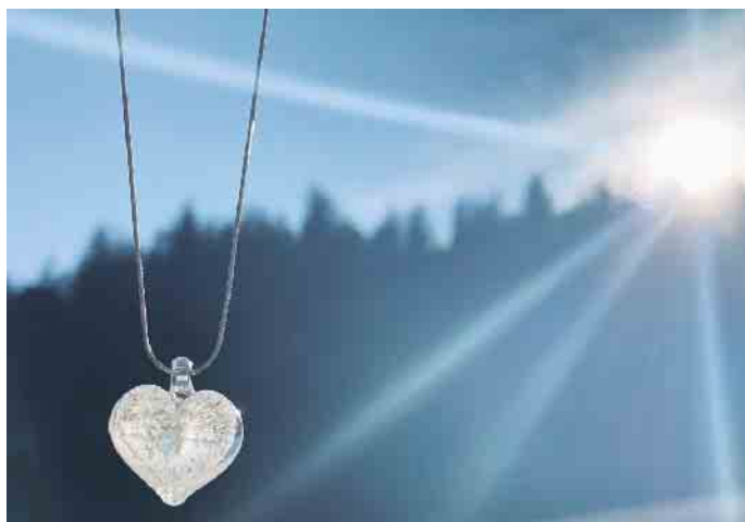
Der Herzanhänger ist zugleich ein Schmuckstück und ein Andenken.

Erinnerung für zu Hause: Kristallbestattungen als neue Form des Totengedenkens