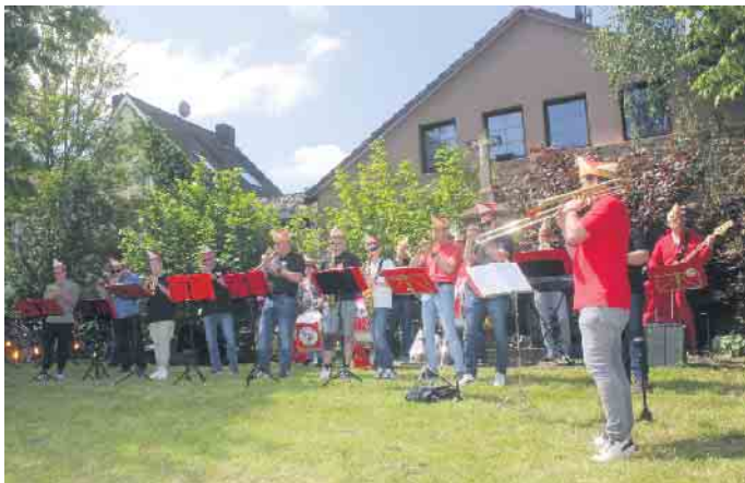
Für die musikalische Unterhaltung war das vereinseigene Fanfarencorps zuständig