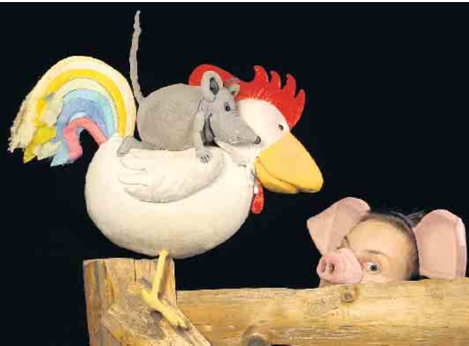
Franz von Hahn, Johnny Mauser und der dicke Waldemar.

Freunde träumen voneinander. Christiane Remmert schlüpft in die Rolle des dicken Waldemar und spielt die Geschichte fantasievoll und mit feinem Gespür für Komik, so dass das Publikum sich am Ende freut, die Drei aus dem Buch einmal persönlich kennengelernt zu haben. Tickets gibt es an der Tageskasse; Kartenzahlung ist nicht möglich. Es wird empfohlen, unter 02257-4414 oder unter kulturhaus@theater-1.de zu reservieren. Reservierungswünsche, die erst am Tag der Veranstaltung eingehen, können möglicherweise nicht mehr berücksichtigt werden.