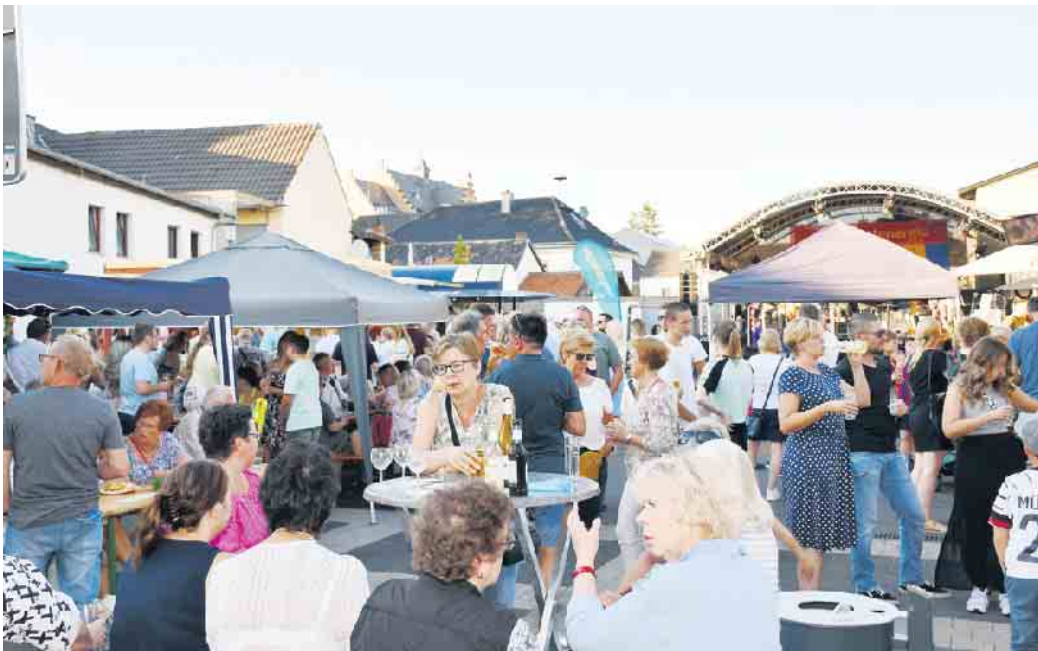
Archivfoto: pp/Agentur ProfiPress

Ein kostenloses Seminar über Veranstaltungssicherheit für Vereine bietet die Ehrenamtsagentur des Kreises Euskirchen am Dienstag, 6. Mai, von 18 bis 20 Uhr im Nettersheimer Kloster an. Referent ist Falco Zanini. Er gibt wertvolle praxisnahe Tipps und Informationen zur sicheren Durchführung von Veranstaltungen und zur Risikominimierung. Die Vereinsvertreter sollen lernen, wie man Gefahren minimieren und unvorhergesehene Vorfälle professionell handhaben kann. Auch rechtliche Aspekte sollen vermittelt werden. Aufgrund der begrenzten Teilnehmerzahl ist eine Anmeldung unter Angabe des Vereins oder der Organisation erforderlich an ehrenamt@kreis-euskirchen.de Kontakt auch unter (0 22 51) 15- 13 61. pp/Agentur ProfiPress