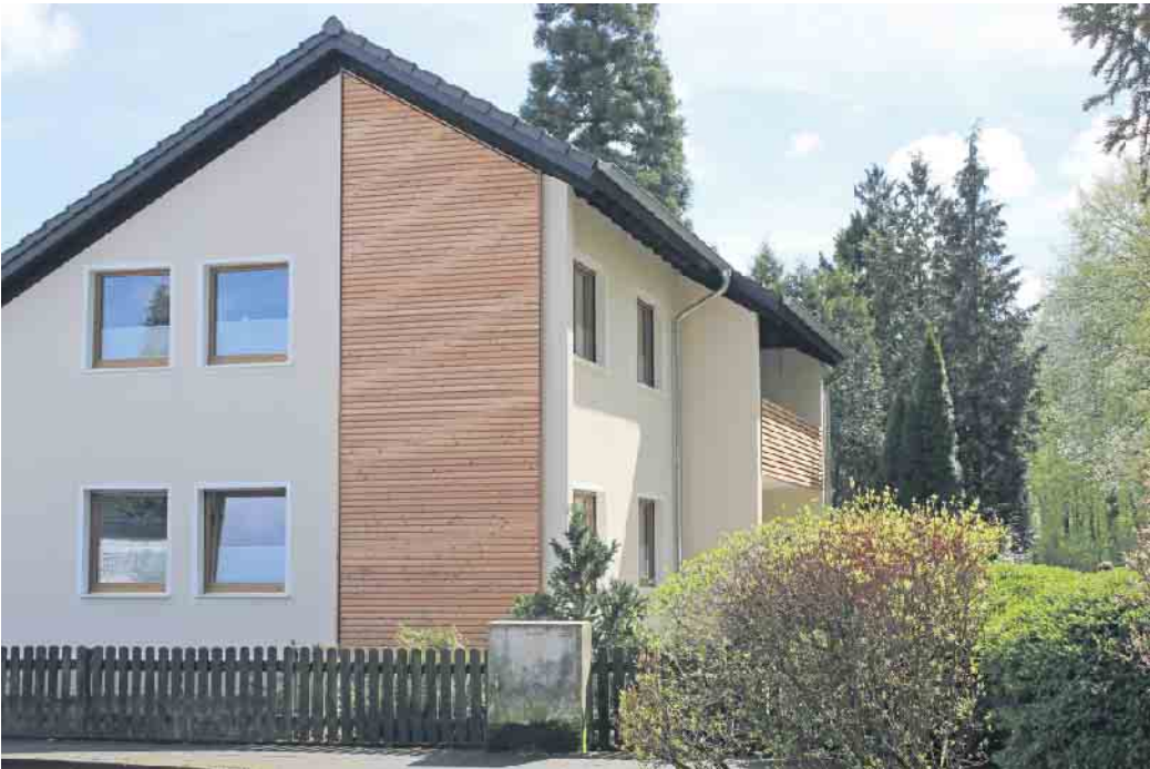
Natürlich mit Holz: Das Naturmaterial bietet fürs Bauen zahlreiche Vorteile in Sachen Umwelt- und Klimaschutz - und wertet das Zuhause auch optisch auf.