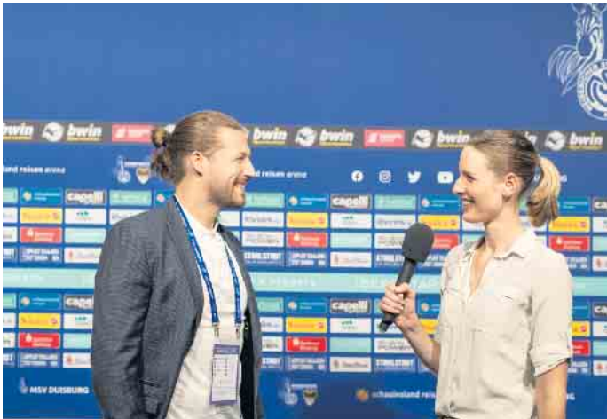
Reporter und Journalisten sind ganz nah dran an den wichtigen Leuten des Sportbusiness. Hier ist die richtige Kommunikation ausschlaggebend.

Die Sportkommunikation gehört zu den spannendsten Berufsfeldern des Sportbusiness. Viele junge Menschen wollen nah am Spielgeschehen sein und Reporter, Kommentator, Social-Media-Experte oder Videojournalist im Fußball werden. Allerdings: Nur wer das Geflecht aus Sport, Medien und Wirtschaft durchschaut, kann durch gelungene Kommunikation über die geeigneten Kanäle Positives für sich, seinen Verein, seinen Verband oder seine Marke erreichen. Das IST-Studieninstitut bietet jetzt eine neue Weiterbildung an, in der sich Interessenten berufsbegleitend zum Kommunikationsprofi weiterbilden können.