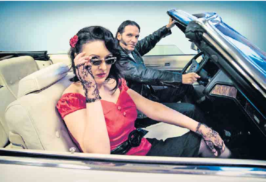
Früher war alles viel cooler.

Musik-Comedy-Show über das Lebensgefühl der 50er- und 60er-Jahre