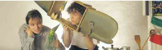
Pinocchio im Wal

Erfolg gezeigt und besticht durch rasante Wechsel der Erzählebenen, stimmungsvolle Musik, bezaubernde Puppen und eine fantasievolle Umsetzung der weltbekannten Geschichte. Karten gibt es an der Tageskasse; es wird empfohlen, unter 0 22 57 - 44 14 oder unter kulturhaus@theater-1.de zu reservieren. Reservierungswünsche, die erst am Tag der Veranstaltung eingehen, können möglicherweise nicht mehr berücksichtigt werden.