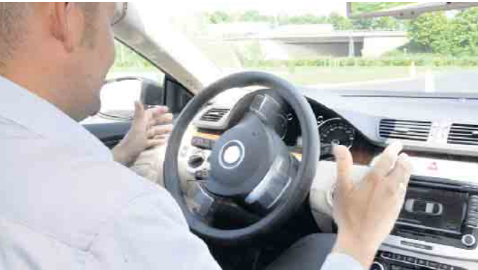
Der Parkassistent ist das häufigste Fahrerassistenzsystem. Er schlägt, nachdem der Fahrer die vom Fahrzeug vorgeschlagene Lücke bestätigt hat, selbstständig im richtigen Moment das Lenkrad ein und übernimmt das Einparken nahezu vollständig.

Immer mehr Fahrzeuge sind mit sogenannten Fahrerassistenzsystemen ausgestattet