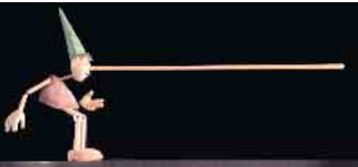
Lügen haben nicht nur kurze Beine.

Theater-Adaption des Literaturklassikers für Erwachsene und Kinder im Schulalter