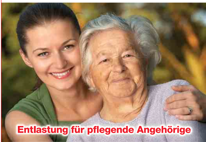
Entlastung für pflegende Angehörige

Unsere Tagespflegen bieten tagsüber Betreuung und Pflege von Seniorinnen und Senioren an. Wie? Das zeigen wir in unserem Film – scannen Sie dazu den QR-Code mit Ihrem Smartphone.