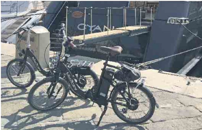
Im Urlaub sind die kompakten E-Falträder ideale Begleiter.

der Räder und die Tatsache, dass man mit beiden Füßen sicher auf den Boden kommt. Vom Anbieter bike2care etwa gibt es zudem komfortable und bequeme E-Falträder mit und ohne Rücktrittbremse. Das Design hat einen Hauch von Retro-Chic, die verwendeten Anbauteile stammen ausschließlich von Markenherstellern. Mehr Infos, einen Online-Shop mit dem passenden Zubehör und der Möglichkeit zur Konfiguration der Räder sowie eine Liste von Händlern, die die Falträder führen, gibt es unter www.bike2care.de . Mit dem Nabenmotorkonzept erzielen die Räder einen besonders effizienten Wirkungsgrad: Die Kraft wird dort erzeugt, wo sie benötigt wird und muss nicht wie bei einem Mittelmotor erst auf das Rad umgelenkt werden. Ohne