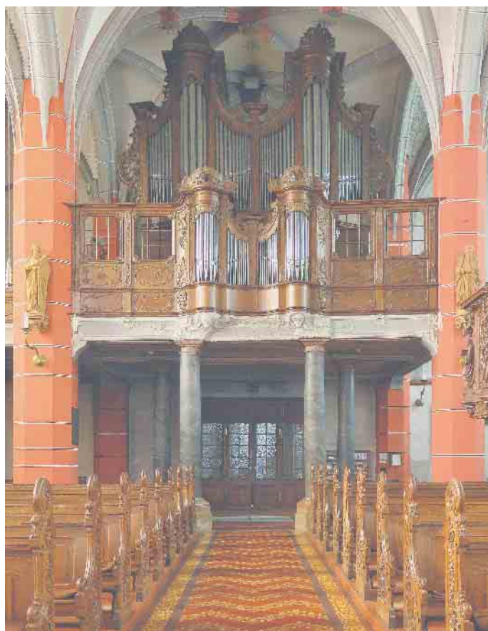
König-Orgel: Die historische Orgel der Schleidener Schlosskirche stellt ein beeindruckendes Zeugnis rheinischer Orgelbaukunst der Barockzeit dar.