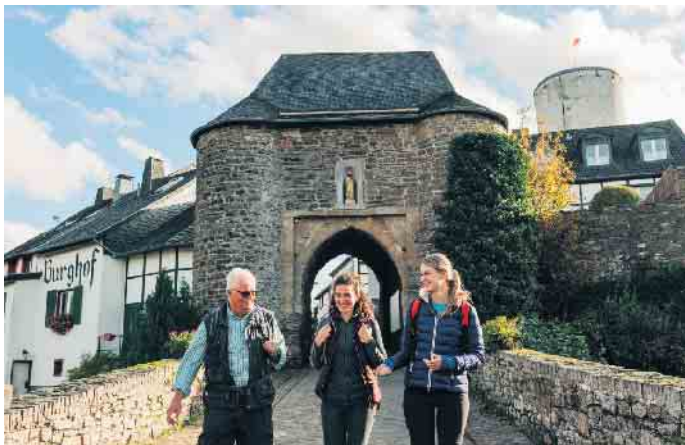
Wanderer vor dem Matthiastor

18. bis 21. Mai Burgbelegung auf der Burg Reifferscheid Mittelalterliche Schaustellung Näheres durch Presse über die Gemeinde Hellenthal