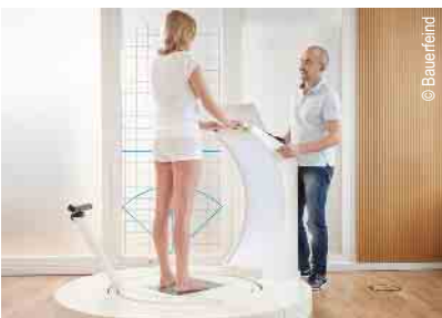
3D-Vermessung für Kompressions- strümpfe und orthop. Einlagen

Zentrale: Achtung: vorübergehend Am Alten Rathaus 1 53937 Schleiden Tel. 02445 911161 • Fax 911163 www.jansen-ot.de