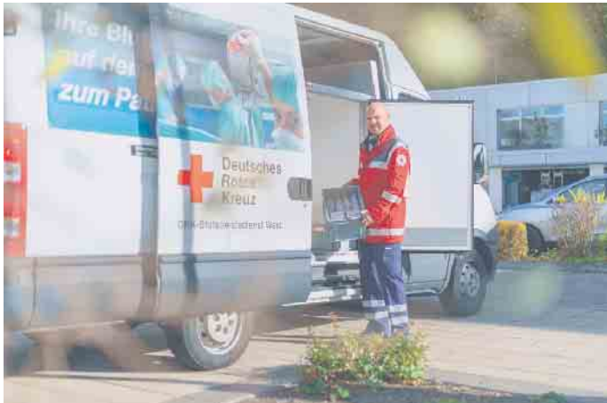
Jede Blutspende kann Leben retten. Dafür, dass die bei den Patientinnen und Patienten auch gut ankommt, sorgt die eingespielte Logistikmannschaft des DRK.