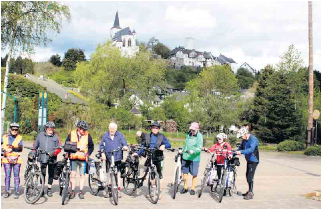
Die Radler vor der Burg Reifferscheid

Tag des Wanderns in allen Ortsgruppen -OG Reifferscheid 14. Mai - 10 Uhr Tag des Wanderns in allen Ortsgruppen Treffpunkt: 10 Uhr Parkplatz Burg Reifferscheid. Von dort startet die Tour auf der Eifelschleife Sonnenglück mit 10,5 km. Dabei werden Informationen über die erwanderten Örtlichkeiten vermittelt. Im Anschluss wird eine Führung über die Burg Reifferscheid angeboten und der Tag mit Kaffee und Kuchen abgeschlossen. Wanderführer: