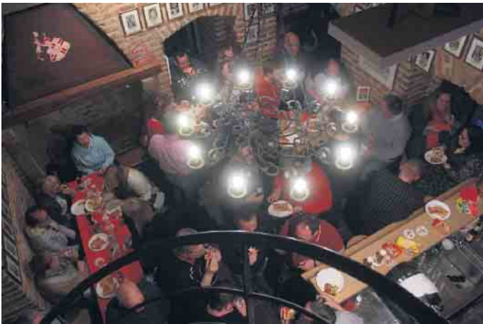
Das Gardequartier platzte beim Münstertor Abend sprichwörtlich wieder aus allen Nähten