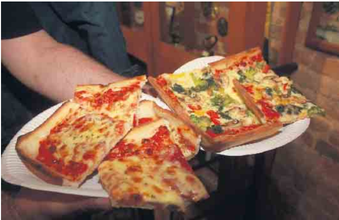
Bei gekühlten Getränken und gutem Essen, wie hier leckerer Pizza, verging der gesellige Abend wie im Flug