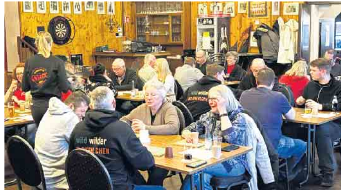
Die Kaller Schockermeisterschaft ist auch bei Frauen sehr beliebt. Bei fünf Meisterschaften hatte eine Dame die Nase ganz vorn gehabt.

pensturz im Jahr 1983 nicht mehr erholte und 1985 im Alter von 86 Jahren verstarb. Im Saal Gier ging es am Samstagabend hoch her, wo 44 Würfelartisten aus der Eifel zur 13. Schockermeisterschaft angetreten waren, um den Großen Preis der Gaststätte Gier und damit auch den begehrten „Luisjen-Cup“ zu gewinnen. Die Teilnehmer kamen aus Kall, Frohnrath, Golbach, Gemünd, Schleiden, Harperscheid, Nettersheim, Schöneiseffen, Berescheid, Nettersheim, Mechernich, Kallmuth und Jünkerath. Wird das beliebte und überall bekannte Würfelspiel „Schocken“ in