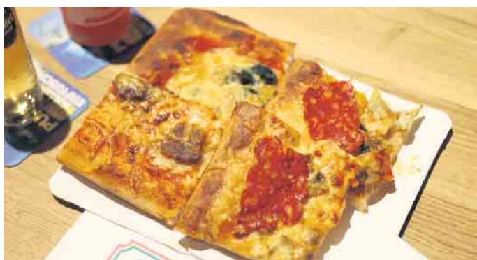
Zwischen kühlen Getränken und frisch gelieferter Pizza vom Ristorante „Pinocchio“ wurde viel gelacht und über die vergangene Session resümiert.

freundeter Zülpicher Karnevalsvereine das Miteinander. Der erste Weiertorabend 2026 hat bewiesen: Das Herz des Zülpicher Karnevals schlägt auch außerhalb der tollen Tage kräftig weiter. FH