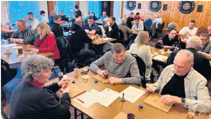
44 Würfelartistennahmen an der 13. Schockermeisterschaft im Saal Gier teil.