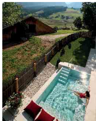
Relaxen im Spa

Für einen Pool braucht man viel Platz? Keinesfalls. Wasseroasen gibt es in unterschiedlichen Größen. Selbst auf einer Terrasse lässt sich ein Wohlfühltempel mit erfrischendem Nass kreieren. Denn es gibt Alternativen zum klassischen Schwimmbecken. Und Poolexperten haben das Credo verinnerlicht: ein Pool passt immer.