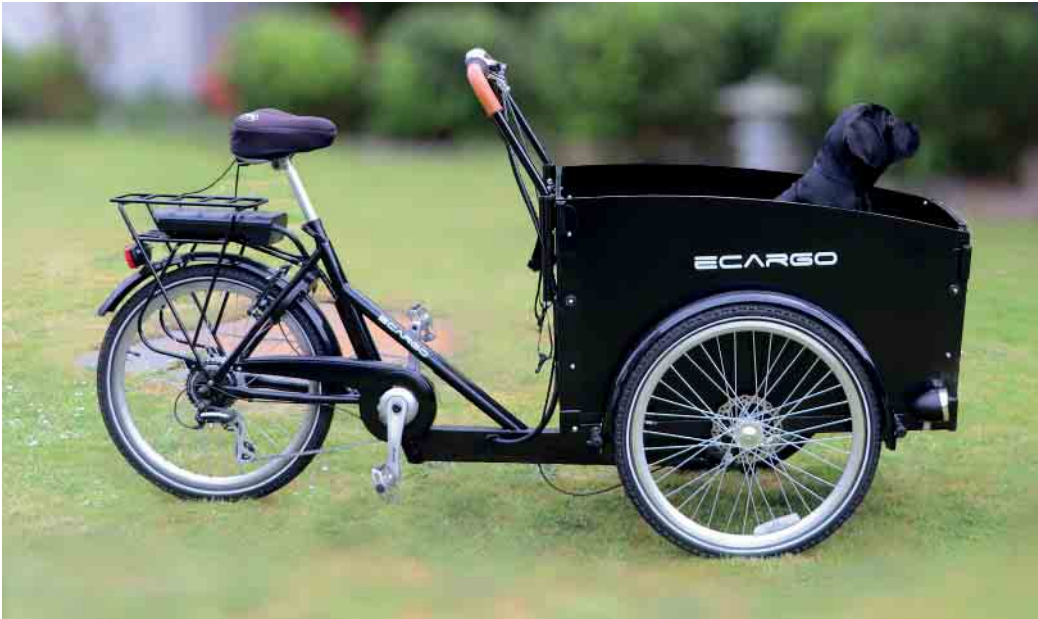
Grundsätzlich ist das Lastenrad eine sichere Methode, nicht nur Güter, sondern durchaus auch Kinder oder Tiere zu befördern.