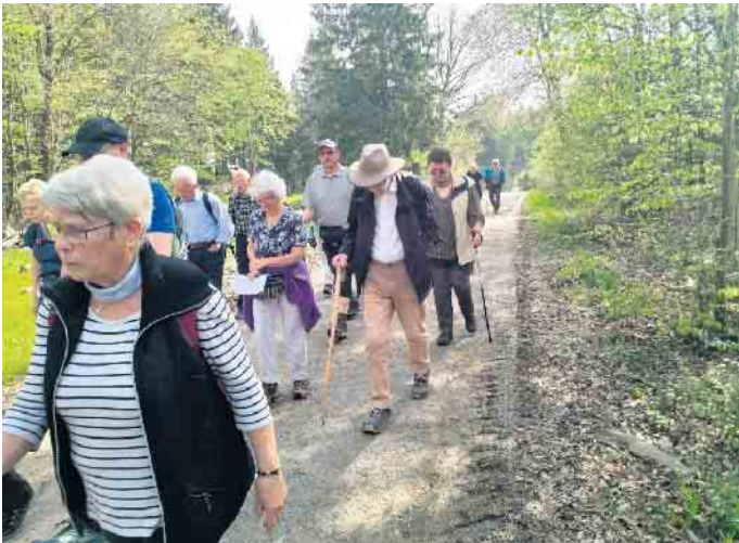
Auf dem Weg zur Waldkapelle

Traditionsgemäß laden wir am 1. Mai herzlich zum Gang zur Waldkapelle ein. Wie immer sind auf dem Weg von Hellenthal aus drei Stationen eingeplant, an denen wir Texte zum Nachdenken hören, gemeinsam beten und Lieder singen. Zwischen den Stationen beten wir Gesätze vom Rosenkranz. Wir starten um 9.30 Uhr von den beiden Ausgangspunkten, der Kath. Kirche St. Anna in Hellenthal und dem Hollerather Knie. Gegen 11 Uhr feiern wir dann eine Hl. Messe an der