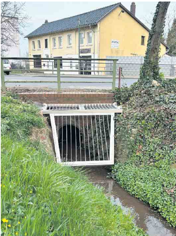
Der neue räumliche Rechen am Umbach in Sinzenich entspricht den aktuellen technischen Standards für ein solches Bauwerk und soll eine Verklausung der Rohrleitung bei starker Wasserführung verhindern.