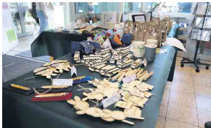
Die Besucher konnten sich im Förderzentrum für Menschen mit Behinderung über ein tolles Angebot an Handgemachtem und Selbstgebasteltem freuen