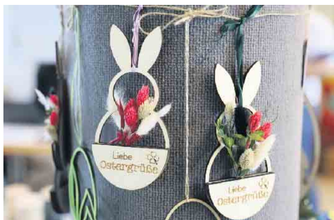
Ob Osterkränze oder Geschenkkideen. Alles wurde liebevoll von den Mitarbeiterinnen und Mitarbeitern und den Bewohnern mit viel Liebe zum Detail hergestellt

licht durch Maßnahmen zur Bildung, Betreuung und Unterbringung der behinderten Menschen sowie zu ihrer Erholung und zur Ausübung sportlicher Aktivitäten. So werden beispielsweise die Ferien- und Freizeitaktivitäten unserer Bewohner und Kunden durch Stiftungsmittel