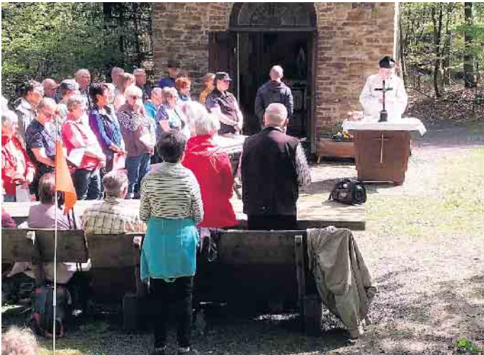
Gang zur Waldkapelle 2024

Traditionsgemäß laden wir am 1. Mai herzlich zum Gang zur Waldkapelle ein. Wie immer sind auf dem Weg von Hellenthal aus drei Stationen eingeplant, an denen wir Texte zum Nachdenken hören, gemeinsam beten und Lieder singen. Zwischen den Stationen beten wir Gesätze vom Rosenkranz. Wir starten um 9.30 Uhr von den beiden Ausgangspunkten, der Kath. Kirche St. Anna in Hellenthal und dem Hollerather Knie. Gegen 11 Uhr feiern wir dann eine Hl. Messe an der