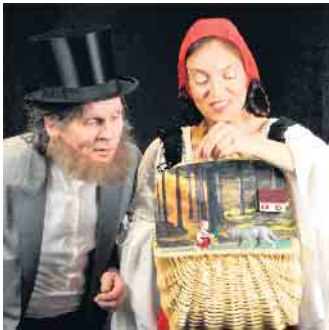
Begegnung im Wald.

verweht“, „Titanic“, der Jäger aus Kurpfalz oder Eduard Zimmermann von „Aktenzeichen XY - ungelöst“ in einem Grimm’schen Märchen zu suchen haben. Oder ob die Pannen auf der Bühne echt sind oder inszeniert. Könnte man sich fragen, muss man aber nicht, denn soviel sei verraten: Die Pannen sind inszeniert. Für Irritationen und chaotische Zustände auf der Bühne übernimmt niemand die Verantwortung, mit Ausnahme des Schicksals, das in dieser Inszenierung persönlich anwesend ist, die Fäden in der Hand hält und sie auf vergnügliche Weise verwirrt und verknotet. Karten gibt es an der Tageskasse; es wird empfohlen, unter 02257/4414 oder unter