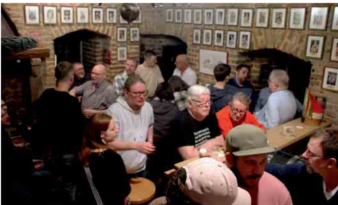
In gemütlicher Runde mit den Vereinskameradinnen und Kameraden sowie Freunden und Förderern wurden viele schöne Gespräche geführt.