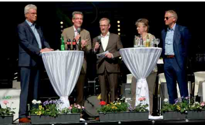
Die Gäste erlebten eine anregende Podiumsdiskussion mit interessanten Rückblicken, Anekdoten aus den letzten zehn Jahren und spannenden Einblicken in die Zeit der Landesgartenschau - und den letzten zehn Jahren.