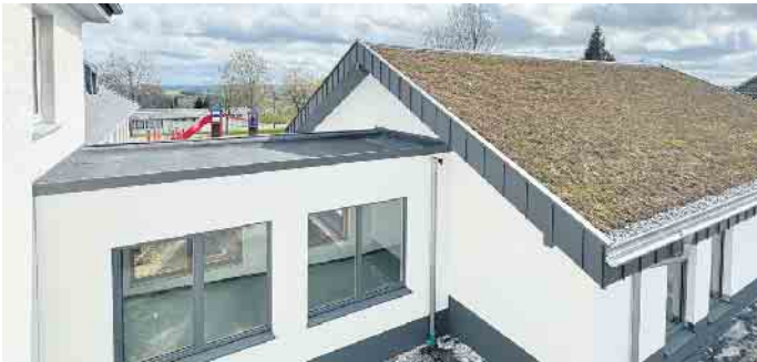
Eine Hälfte des Daches wurde mit Moos und Flechtengewächsen begrünt. Auf der anderen Seite befindet sich eine innenliegende Photovoltaikanlage.

können, ermöglichen den Lehrkräften ein gezieltes pädagogisches Lernkonzept. Zur neuen Ausstattung gehört auch eine kleine Multifunktionsbühne, die bei künftigen Veranstaltungen sicher zum Einsatz kommen wird. Der gesamte Anbau wurde nach dem neusten Stand der Technik errichtet. Die barrierefreien Außenanlagen sollen, je nach Witterung, noch im Herbst hergestellt werden.