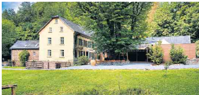
Die unter Denkmalschutz stehende Kupfersiefer Mühle bei Köln erhält eine neue Zukunft mit innovativen, kreislauffähigen Baumaterialien.

Für viele Besitzer älterer, womöglich denkmalgeschützter Gebäude stellt sich die Frage: Wie lassen sich die Bausubstanz und der Charakter erhalten, wenn gleichzeitig Erneuerungen notwendig sind? Formel-1-Rennfahrer Nico Hülkenberg, der sich auf den ersten Blick in eine historische Wassermühle verliebte, wurde auf der Suche nach einer nachhaltigen Terrassensanierung bei einem modernen, kreislauffähigen Baustoff fündig.