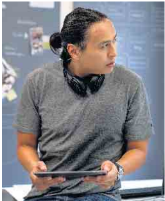
Technologisches und digitales Fachwissen erwerben - mit dem Master „Business Transformation Management“.