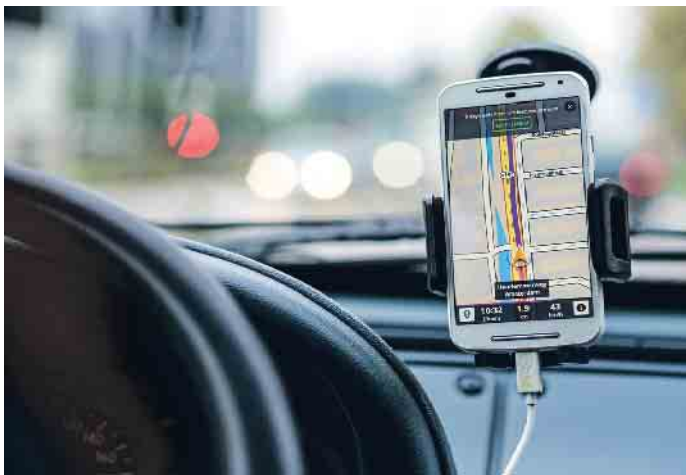
Immer mehr Menschen fühlen sich mit der Bedienung der Navigation überfordert.

Doch wie verhält es sich mit überdimensionierten Touchscreens, die eher einem Tablet gleichen? Grundsätzlich gilt: Sämtliche elektronische Geräte dürfen nur bedient werden, wenn das Gerät dazu nicht in die Hand genommen wird, ein flüchtiger Blick ausreicht oder dies per Sprachsteuerung möglich ist. Der ACE rät daher allen Autofahrenden, sich gründlich mit den Funktionen und Einstellungsmöglichkeiten des Fahrzeugs vertraut zu machen. Das gilt insbesondere für geliehene Fahrzeuge. Teilweise können bestimmte Funktionen auf „Kurzwahl“ gelegt werden oder einzelne Tasten oder Knöpfe individuell belegt werden. Damit die Sprachsteuerung eine wertvolle Unterstützung sein kann, sollte sie nicht nur mit der eigenen Stimme trainiert werden. Die Routenplanung sollte vor