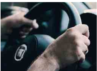
Die Straßenverkehrsordnung macht keine genaue Angabe, wie schnell Schrittgeschwindigkeit eigentlich ist.

Mancher mag sich die Frage stellen: „Stimmt es, dass Schrittgeschwindigkeit gar nicht genau definiert ist?“ Während ein gesunder, erwachsener Fußgänger auf gerader Strecke etwa drei bis fünf Kilometer pro Stunde (km/h) schafft, erreichen „Profi-Geher“ rund 15 km/h. Wie schnell wir gehen, ist also abhängig von diversen Faktoren. Auch rechtlich ist es so eine Sache mit der Schrittgeschwindigkeit. Die Straßenverkehrsordnung macht laut Experten des Versicherungskonzerns ARAG nämlich keine genaue Angabe, wie schnell Schrittgeschwindigkeit eigentlich ist. Dabei wird an vielen Stellen im Straßenverkehr, wie z.B. in verkehrsberuhigten Bereichen, auf Parkplätzen oder an vielen Bushaltestellen, darauf hingewiesen, eben genau diese einzuhalten. Das färbt natürlich auf die Rechtsprechung ab: So legt das Oberlandesgericht Düsseldorf eine Größenordnung von vier bis sieben km/h zugrunde, während die Richter des Oberlandesgerichts Sachsen-Anhalt