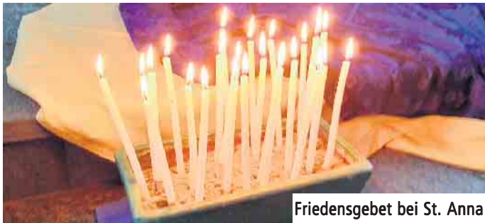
Friedensgebet bei St. Anna

Wir laden Sie ein zu monatlichen Friedensgebeten in einigen unserer Pfarrgemeinden. Das Gebet wird von der jeweiligen Pfarrgemeinde vorbereitet und findet in der Pfarrkirche statt (Ausnahme: beim Friedensgebet der Pfarre Reifferscheid wird das Friedensgebet auf den Soldatenfriedhof nach Oberreifferscheid verlegt). Friedensgebete immer donnerstags, um 19 Uhr.