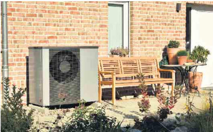
In vielen Neubauten ist die Wärmepumpe bereits Standard, aber auch im Bestandsbau kann sie ältere, ineffiziente Gas- oder Ölheizungen ersetzen. Eine solche Wärmepumpe muss man nicht kaufen, man kann sie auch pachten.