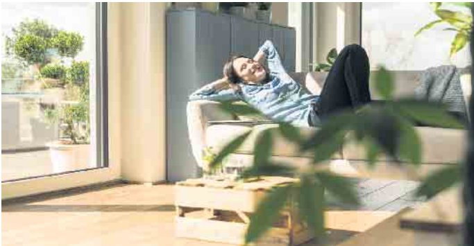
Mit der Pacht einer modernen Luft-Wasser-Wärmepumpe gelingt der kostengünstige Einstieg in eine klimaneutrale Wärmeversorgung.

Etwa vier von fünf Wärmepumpen, die heute installiert werden, sind Luft-Wasser-Wärmepumpen. Sie gewinnen die Wärme für zu Hause fast komplett aus der Umgebungsluft, und das zu jeder Jahreszeit. Nur an wenigen Tagen schaltet sich ein Heizstab dazu. Dieser wird mit Strom betrieben, ebenso wie der Kältekreis durch den Kompressor der Wärmepumpe. Nutzt man dafür Ökostrom, heizt man zu 100 Prozent klimaneutral. Der Haken an der Sache: Wird eine alte Öl- oder