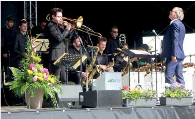
Untermalt wurde der Open-Air-Nachmittag von niemand geringerem als dem „JugendJazzOrchester NRW“.