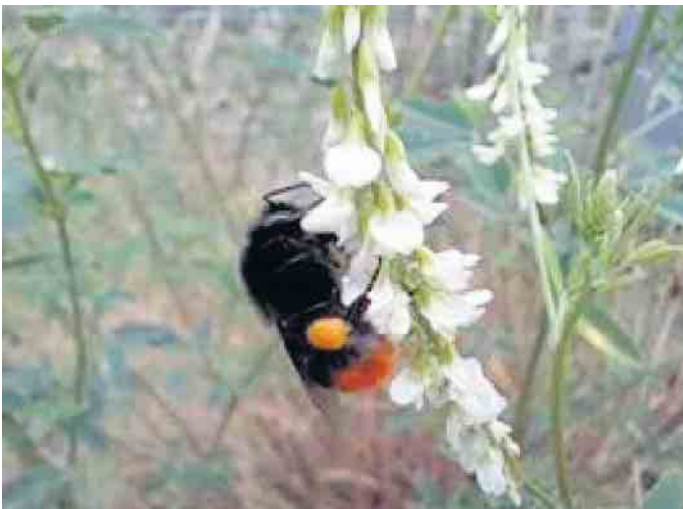
Steinhummel (Bombus lapidarius).

und die Organisationsformen dieser sozialen Hautflügler geboten. Bei gutem Wetter werden Hummeln auf einer Exkursion im Freiland beobachtet; außerdem werden Bestimmungsübungen anhand von Fotomaterial und Präparaten gemacht. Termin: Samstag, 20. April Uhrzeit: 14 bis 17.30 Uhr Ort: Naturschutz-Bildungshaus Eifel-Ardenne-Region, Vogelsang 90, 53937 Schleiden-Vogelsang, Osteingang Referentin: Dipl.-Biol. Maria Pfeifer Anmeldung: anfrage@nabear.de; für Erstbesucher kostenfrei Weitere Informationen: nabear.de/ak-pflanzen-und-tiere.html