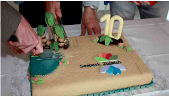
Zu einem Jubiläum gehört standesgemäß auch eine große Festtorte.