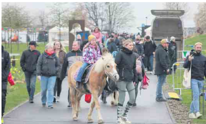
Auf einem Pony reitend konnte man den Park erkunden

waren dabei, als der Flying Fox Hochseil-Kletterpark mit Blick in die Eifel aus dem Winterschlaf erwacht und die „Passagiere“ mit 40 km/h über den Wassersportsee fliegen. Die Adventure-Golf-Anlage im Seepark Zülpich öffnete ebenfalls ihre Pforten. Auf den 18 Bahnen ging es nun wieder auf eine spannende Golfreise rund um die ganze Welt. Zum Saisonstart am 2. April erhielten Spieler einen