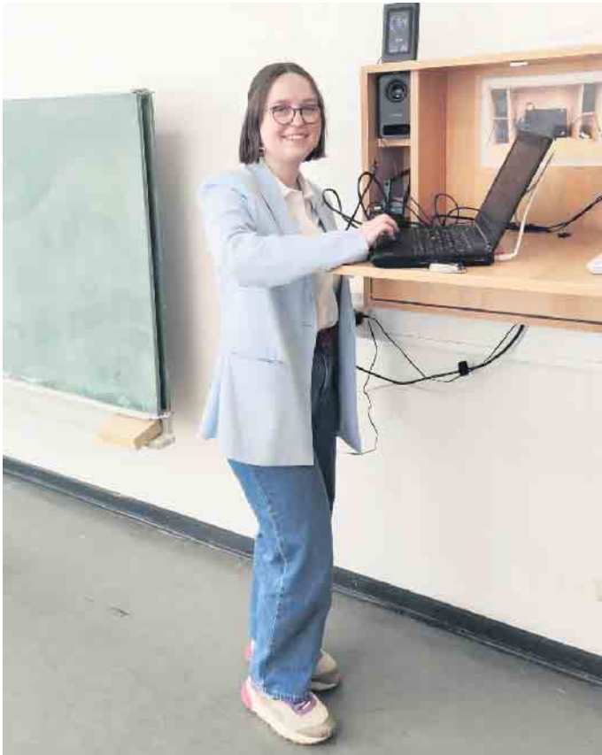
Psychologie vorgestellt von Wiebke Schumacher, ehemalige Schülerin des JSG.

JSG-Schüler bekamen persönliche Einblicke in die Studien- und Berufswelt