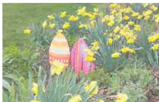
Bei der Parkrallye galt es die Ostereier im gesamten Park zu finden

Freier Eintritt zur Saisoneroöffnung und erster Blick auf neuen Palmenstrand möglich