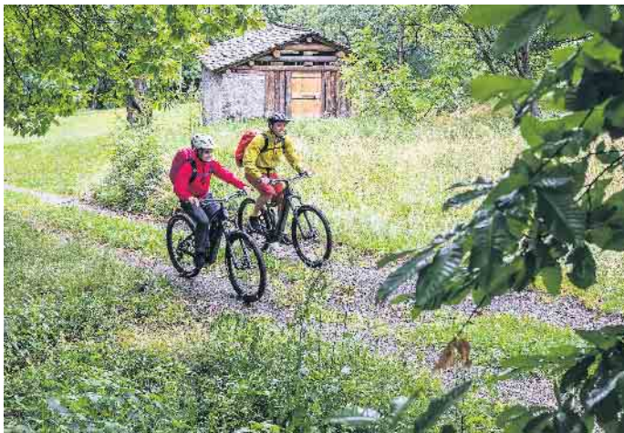
Genug Power für jede Etappe: Vernetzte Bordcomputer helfen bei der Tourenplanung und der Nutzung der Akku-Kapazitäten.