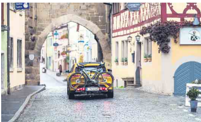
Für den Transport von E-Bikes bieten sich Kupplungsträger am Auto an.

die komfortable Reise mit dem Zug ist möglich. Im Regional- und Fernverkehr dürfen meistens E-Bikes bis zu einer Höchstgeschwindigkeit von 25 Stundenkilometern an Bord, wenn man zuvor eine Fahrradkarte kauft. Auch in vielen Fernbussen ist die Mitnahme mittlerweile erlaubt.