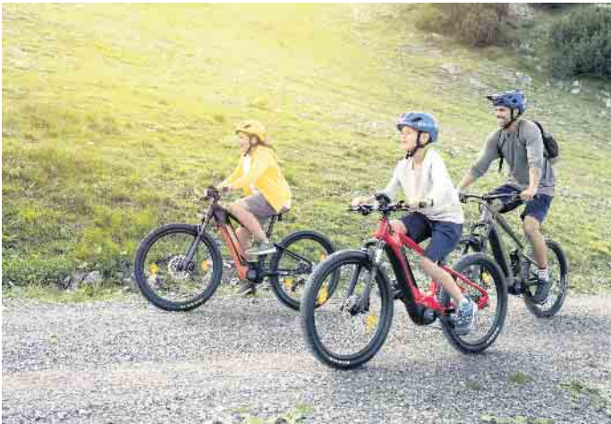
Reisen mit dem Rad: Das ist nachhaltig, abwechslungsreich und ein Spaß für die ganze Familie. Die elektrische Unterstützung eines E-Bikes erhöht dabei die Reichweite deutlich.

verbringen möchte, sollte sich entsprechend darauf vorbereiten. Ein Check von Bremsen, Reifen, Schaltung, Federsystem, Pedalen, Schuhen und Helm vor dem Start sollte selbstverständlich sein. Bei der Kleidung hat sich das Zwiebelprinzip mit mehreren Schichten bewährt: luftig und leicht für bergauf, winddicht für bergab. Ein Rucksack mit Akkufach eignet sich, um einen Zweitakku oder ein Ladegerät sicher zu verstauen. Für kleinere Reparaturen empfiehlt es sich, ein Multitool, einen Ersatzschlauch und eine Luftpumpe im Gepäck zu haben. Bei der Routenwahl sollten Urlauber nicht nur die individuelle Fitness, sondern auch eigene Präferenzen, etwa bei der Tourenauswahl, beachten. Vernetzte Displays wie „Nyon“ von Bosch bieten die Möglichkeit, Routen vorab