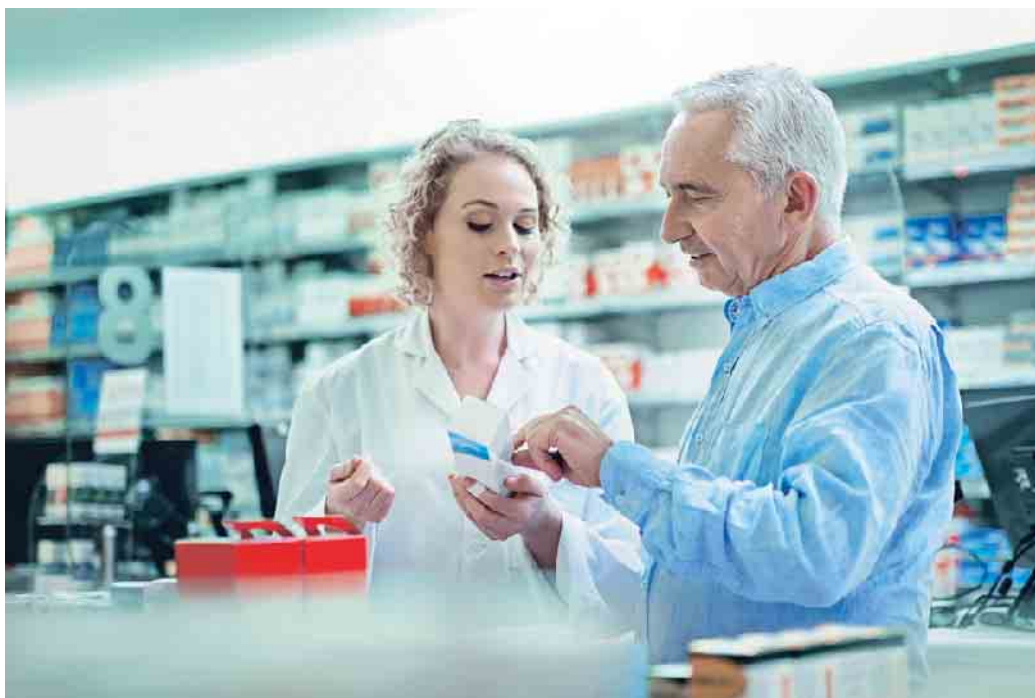
Apothekerin hilft einem älteren Kunden.

Vor der Einnahme eines neuen Medikamentes sollten Sie Ihren Arzt oder Apotheker nach möglichen Wechselwirkungen fragen. Informieren Sie ihn darüber, welche anderen Arzneimittel Sie einnehmen. Besteht die Gefahr von Wechselwirkungen, können Sie gemeinsam Lösungen finden. Manchmal reicht es aus, bestimmte Blutwerte im Blick zu behalten. „In anderen Fällen kann die gleichzeitige Einnahme von Medikamenten jedoch gefährlich sein. Der Arzt oder Apotheker wird dann nach geeigneten Alternati-