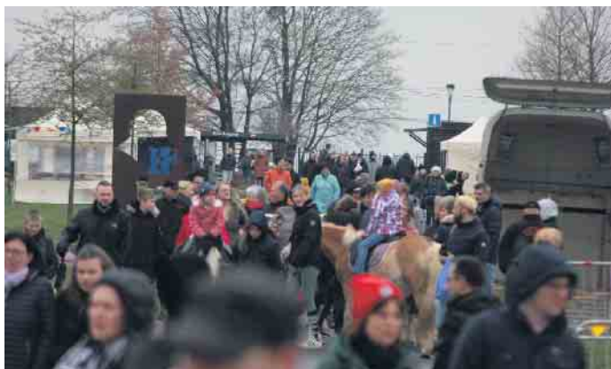
Trotz des mäßigen Wetters zog es viele Besucherinnen und Besucher am Palmsonntag in den Seepark