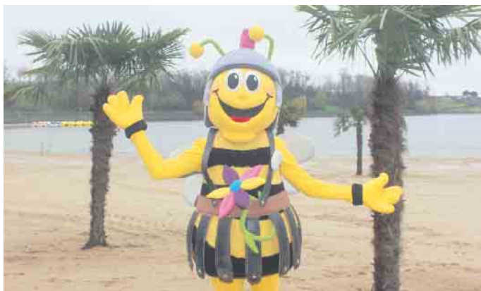
Das Seepark Maskottchen Tolbienchen hieß die Besucher am Palmenstrand herzlich willkommen

Rabatt von 50 Prozent auf Golf und Goldtausch. Auch bei „Tim's Beach“ ging die Saison mit einer tollen Aktion los. Am 2. April hatten Gäste die Möglichkeiten Rabatte beim Tretbootfahren zu nutzen: 30 Minuten für 5 Euro statt 7 Euro, eine Stunde für 10 Euro statt 11 Euro. Zudem konnten kostenlose Schnupperfahrten mit den runden BBQ-Donut-Booten veranstaltet werden. FH