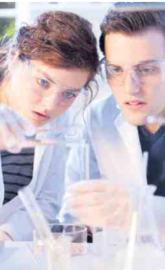
Im Programm „StartPlus“ werden junge Menschen mit Startschwierigkeiten beim Start in eine qualifizierte Ausbildung unterstützt.

Der Clou dabei: Die Jugendlichen beginnen das Programm, ohne zu wissen, welcher Ausbildungsberuf dabei herauskommt. So können sie sich ausprobieren und herausfinden, was ihnen liegt: eher das technische oder elektrotechnische Umfeld, das Handwerk, die Mechanikerberufe, das Labor? Oder wie sieht es aus mit Chemikant oder Pharmakant? Wer das StartPlus-Programm erfolgreich absolviert, auf den wartet ein passender Ausbildungsplatz. Und die Erfolgsquote ist hoch: In den vergangenen zehn Jahren haben im Schnitt neun von zehn Teilnehmenden nach Abschluss des Projekts eine Ausbildung im Unternehmen begonnen. (djd)