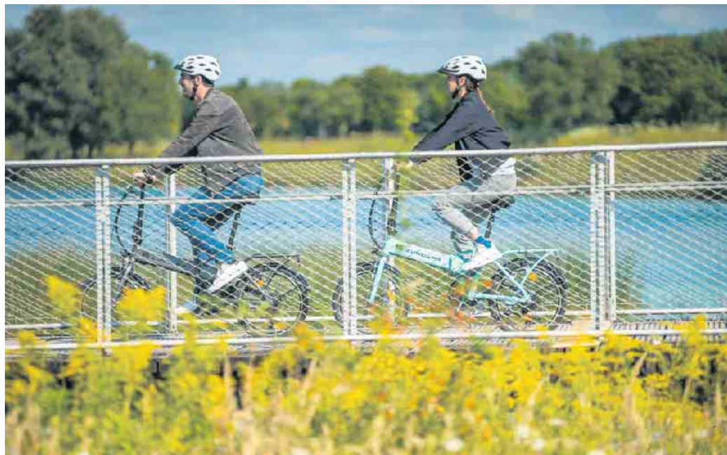
Mit E-Bikes darf die Fahrradtour auch einmal länger dauern.

Nach dem Kauf eines qualitativ hochwertigen Rads kann man selbst noch einiges dafür tun, dass die Sicherheit bestehen bleibt. So muss