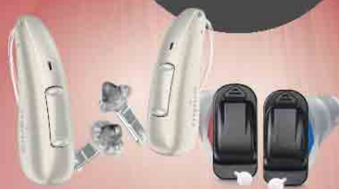
z.B. das Pure C&G AX oder das Silk X von Signia