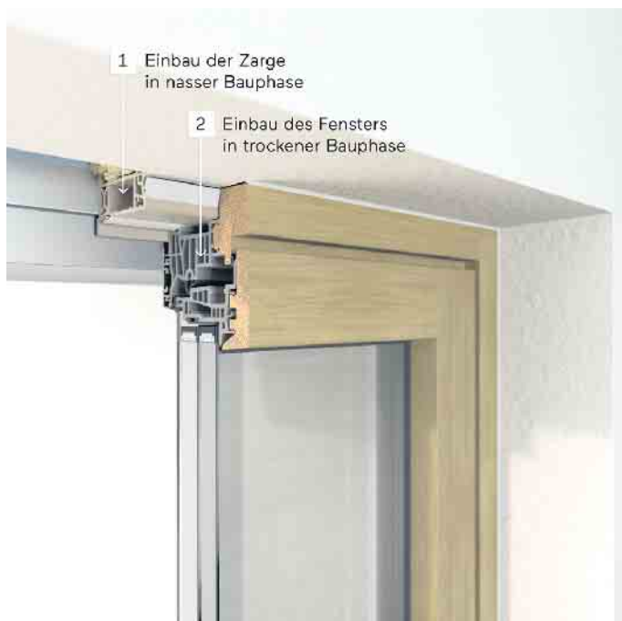
Ein zweistufiger Fenstereinbau mit Einbaurahmen bietet viele Vorteile.

„Die Vorteile sind unbestreitbar“, so VFF-Geschäftsführer Frank Lange. „Das Beschädigungsrisiko neuer Fenster sinkt auf fast null. Zugleich haben Bauherren mehr Spielraum für ihre Fensterwahl. Bis zu acht Wochen können Bauherren sich länger Zeit lassen, denn die Zarge legt zunächst nur die Gesamtgröße des Fensters fest. Aufteilung, Farben, Funktionen und andere Ausstattungsdetails können später entschieden werden. Zudem haben Studien gezeigt: Über die Nutzungsphase von 30 bis 50 Jahren sind zweistufige Montagekonzepte sogar um zehn Prozent kostengünstiger.“