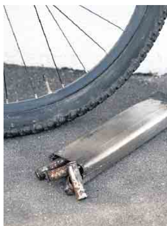
Das hätte auch ins Auge gehen können: ein zerstörter E-Bike-Akku.

das E-Bike samt Akku stets richtig abgestellt werden, am besten in einem trockenen Raum mit einem Stein-, Fliesen- oder Betonboden, optimalerweise mit einem Rauchmelder. Ein Ladestand zwischen 25 und 70 Prozent ist ideal. Weist der Akku irgendwann Brüche oder Schrammen auf oder sollte er sich sogar verformen, dann ist der Gang zur Fahrradwerkstatt dringend angeraten. Tritt einmal Qualm aus einem Akku aus, rät die Feuerwehr dazu, sich vom Rad zu entfernen und die Notfallnummer 112 zu wählen. (djd)