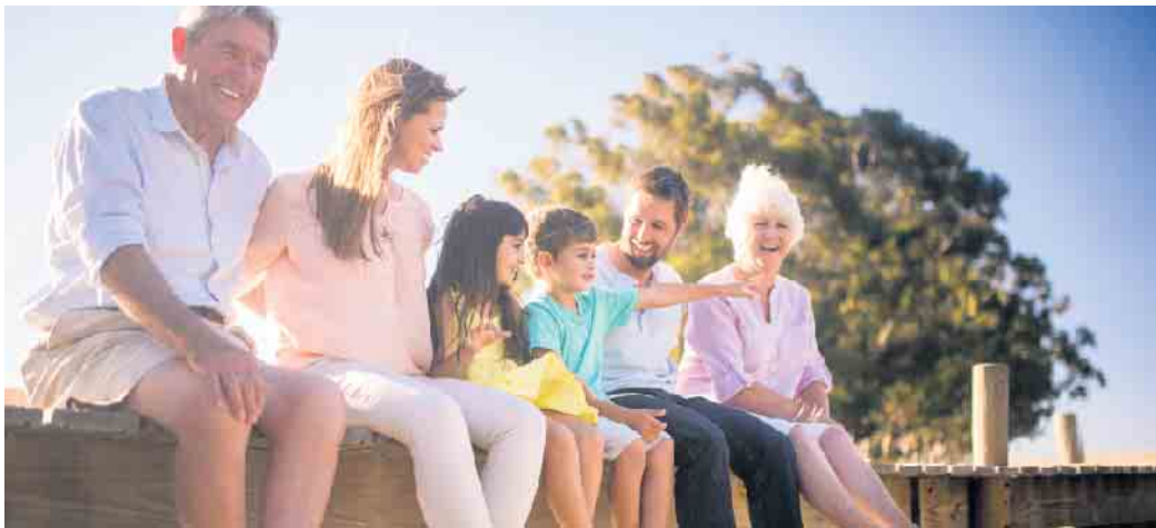
Wer rechtzeitig vorsorgt, zeigt damit vor allem Verantwortung für seine Angehörigen.

Erd-, See-, Baumbestattung oder Urnenbeisetzung. Die Gestaltung der Trauerfeier, die Musik, die Auswahl des Sarges oder der Urne. Wer mit einer Sterbegeldversicherung finanziell vorsorgt, kann die Details des letzten Weges schon zu Lebzeiten selbst festlegen und muss sich um die Kosten keine Gedanken machen. Die Angehörigen wiederum müssen nicht rätseln, wie der oder die Verstorbene sich den Abschied wohl gewünscht hätten und was das alles kostet. Die YouGov-Umfrage ergab, dass nur knapp die Hälfte der Befragten, die sich schon einmal mit dem eigenen Tod befasst haben, genauere Vorstellungen von ihrem letzten Weg entwickelt hatten.