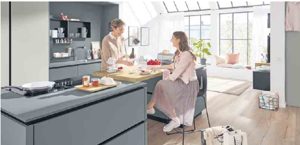
Ein dezentes Farbkonzept und strapazierfähige, ultramatte Oberflächen sorgen hier für Wohlfühlatmosphäre. Die markante Arbeitsplatte verbindet die beiden Kochinseln und fungiert zusätzlich als schicke Esstheke.

Je nach Haushaltsgröße, individuellem Lebensstil und den persönlichen Ernährungs- und Kochgewohnheiten kommen dafür kleinere bis opulenter Lösungen infrage. Das kann beispielsweise ein Essplatz direkt an der attraktiven Kücheninsel sein - in Form einer kleinen Esstheke mit zwei Barhockern. Oder eine Arbeitsplatte auf der Kochinsel, die sich an einem Ende oder von der Mitte aus zu einem größeren Essplatz hin erweitert. Bei weniger Platz macht sich eine kleine separate Essecke mit rundem Tisch nach Vorbild eines gemütlichen französischen Bistros gut. Sehr gefragt sind auch Esstische mit Sitzbank, denn sie bringen einen Hauch von Nostalgie und Country-Flair in die Küche. Wer sich Flexibilität und Ergonomie an seinem Essplatz wünscht, für den bieten sich elektrisch höhenverstellbare Tische zum Sitzen und Stehen an. Dies kommt nicht nur dem Rücken zugute und schont die Bandscheiben: Ein in den Tisch integrier-