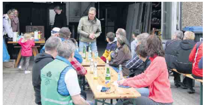
Bürgermeister Ulf Hürtgen nutzte die Gelegenheit, um sich im Anschluss an die Aktion „Frühjahrsputz in Zülpich“ bei den Helferinnen und Helfern für deren Einsatz zu bedanken.

den Händen der dortigen städtischen Kindergärten, dem Kindergarten „Zauberbox“ Bessenich und dem Kindergarten „Kleine Freunde“ Hoven. Auch die Reservistenkameradschaft Zülpich war beim Frühjahrsputz dabei. Rund um das Ehrenmal wurden drei volle Säcke mit Blattwerk und Unrat gesammelt. Damit wurde zum wiederholten Mal das Gesamtbild am Ehrenmal aufgewertet, denn die Reservisten sorgen hier in regelmäßigen Abständen für Pflege und Instandhaltung. Bereits tags zuvor