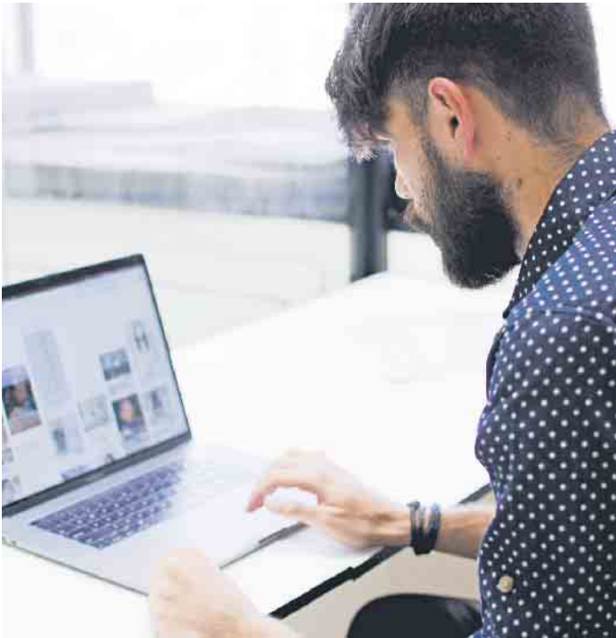
Eigene Qualifikationen, Berufserfahrungen und Stärken darf man online selbstbewusst darstellen.