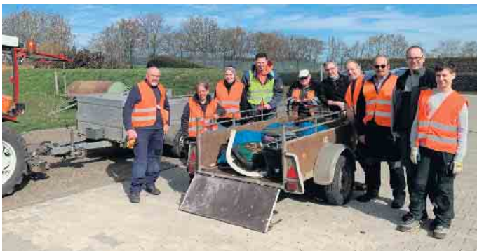
Auch in vielen Ortsteilen - wie hier in Bürvenich und Eppenich - wurde während des Aktionstages „Frühjahrsputz in Zülpich“ fleißig wilder Müll gesammelt.

ausgestattet - los, um überall im Stadtgebiet das einzusammeln, was anderen Menschen nicht ordnungsgemäß entsorgt hatten. Mehr als 40 Freiwillige, darunter auch Bürgermeister Ulf Hürtgen, waren allein in der Kernstadt unterwegs, um die ihnen zuvor zugeteilten Gebiete von herumliegendem Unrat zu befreien. Gesammelt wurde aber auch in den Ortsteilen Enzen, Bürvenich, Eppenich, Langendorf, Sinzenich, Schwerfen und Irnich. In Bessenich und Hoven lag die Federführung für die Sammlungen jeweils in