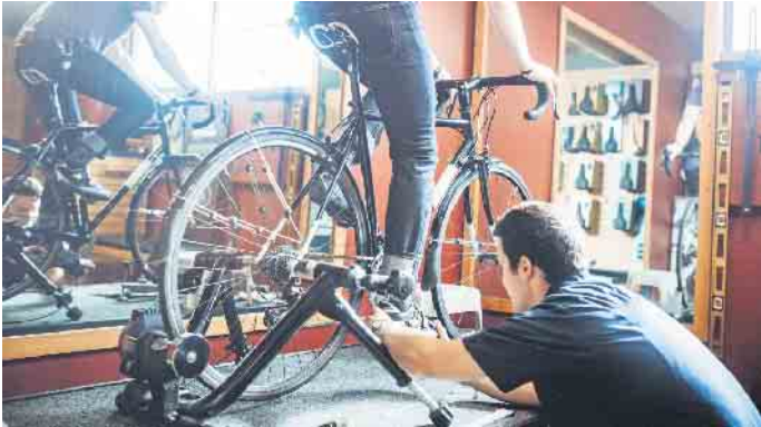
Bikefitting: Das Fahrrad wird im Fachhandel millimetergenau auf die Bedürfnisse und physiologischen Voraussetzungen des Fahrers oder der Fahrerin eingestellt.

Die Entscheidung für ein bestimmtes Rad hängt entscheidend von der Nutzung ab. Faustregel: Wer sein Fahrrad schmerzfrei nutzen will, sollte bei der Anschaffung nicht sparen. Hochwertige Modelle haben ihren Preis - dafür kann man auch lange Freude an ihnen haben. Bei Billigmodellen ist der Ärger oft schon vorprogrammiert. Wer sich hauptsächlich für den Weg zur Arbeit, zum Einkauf oder