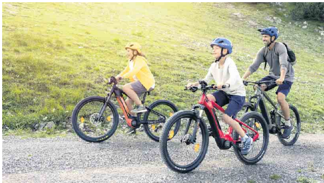
Reisen mit dem Rad: Das ist nachhaltig, abwechslungsreich und ein Spaß für die ganze Familie. Die elektrische Unterstützung eines E-Bikes erhöht dabei die Reichweite deutlich.

Bosch. Beim „Long John“ mit der Ladefläche zwischen Lenker und Vorderrad hat man die Kids stets im Blick, beim „Long Tail“ sitzen die Kinder gut und sicher hinten auf dem Rad. Ob größere Radreise oder Auszeit vom Alltag - eine Entdeckungstour mit dem E-Bike ist immer eine gute Idee. (djd)