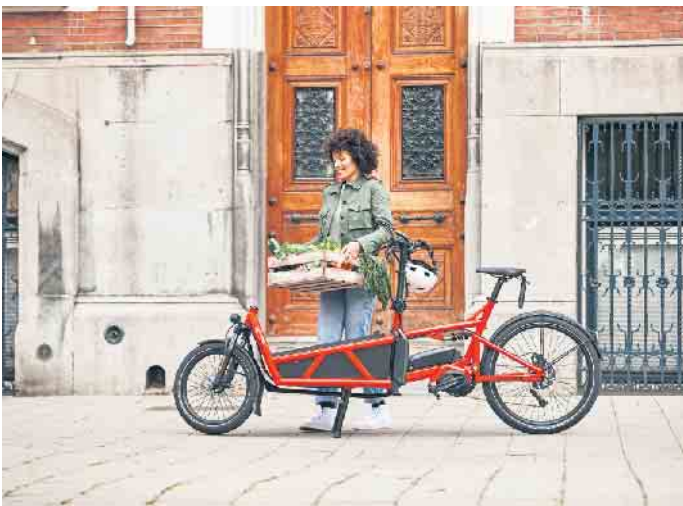
Lastenräder gehören in vielen Städten zum Alltagsbild. Mit elektrischer Unterstützung ermöglichen E-Cargobikes den bequemen Transport zum Beispiel von Wocheneinkäufen.

entlasten nicht nur den Straßenverkehr, sondern schonen auch die Umwelt, da sie weniger Platz als ein Auto benötigen, keinen Lärm und keine Luftschadstoffe verursachen. Aufgrund der geringen laufenden Kosten dürften E-Cargobikes somit vielfach das bisherige Zweitauto der Familie ersetzen. Hinzu kommen zeitliche Vorteile, wenn man morgens im Berufsverkehr entspannt am Stau vorbeiradeln kann. Für Eltern, die den Nachwuchs beispielsweise zur Kita bringen möchten, eignen sich sogenannte Long-John-Modelle mit einer Ladefläche vor dem Lenker. Der Vorteil: Hier haben Mama oder Papa ihre Kids stets im Blick. Aber auch mit Long-Tail-Modellen, bei denen sich der Stauraum hinter dem Sattel befindet, lassen sich größere Kinder noch mitnehmen -