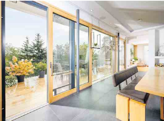
Holzfenster: der nachhaltige Klassiker.

Wer baut oder modernisiert, muss viele Entscheidungen treffen. Gerade bei Fenstern sollte die Wahl gut überlegt sein, geben diese doch einem Haus erst sein Gesicht. Der Verband Fenster + Fassade (VFF) stellt die Klassiker vor und verrät wichtige Trends.