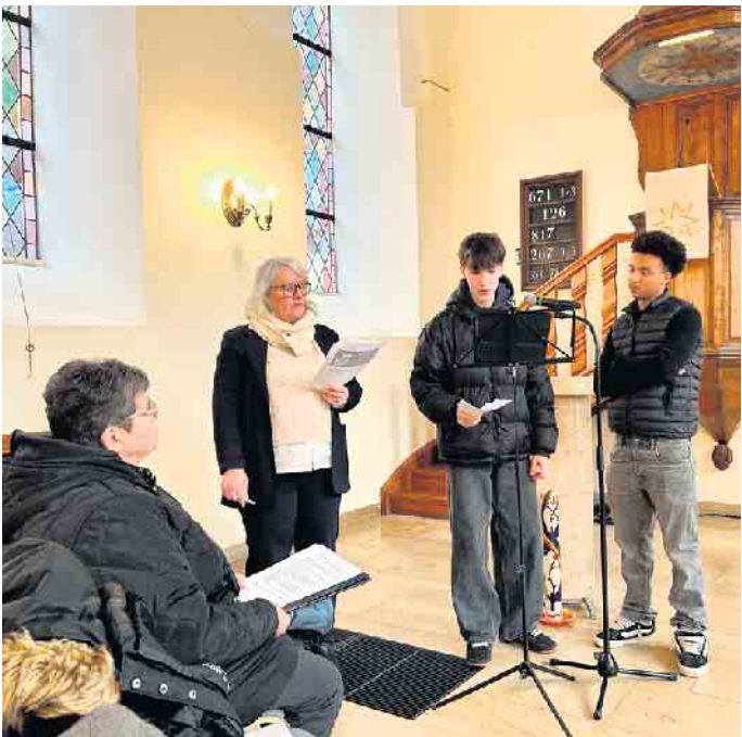
Probe vor dem Gottesdienst.