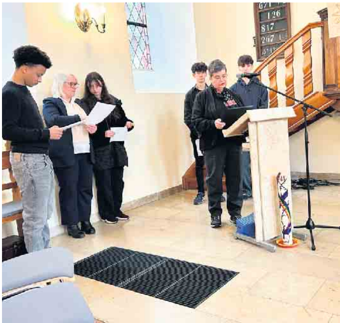
Präsentation im Gottesdienst in der Ev. Kirche Hellenthal.