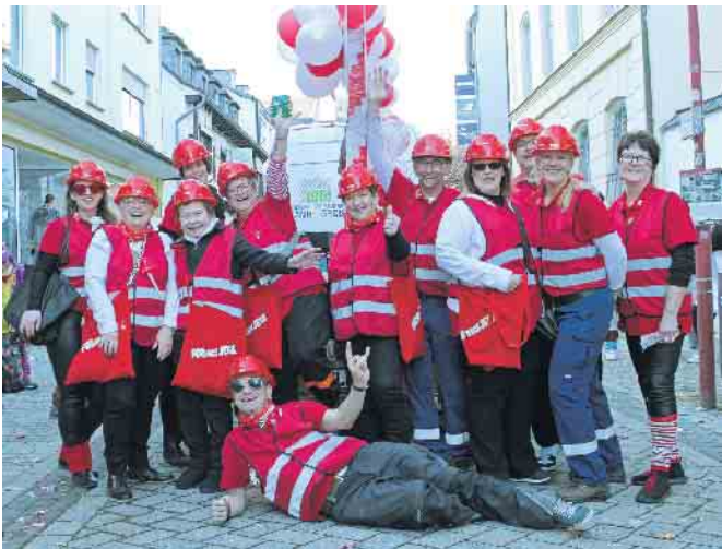
Die ForEvers der KG Gemünd