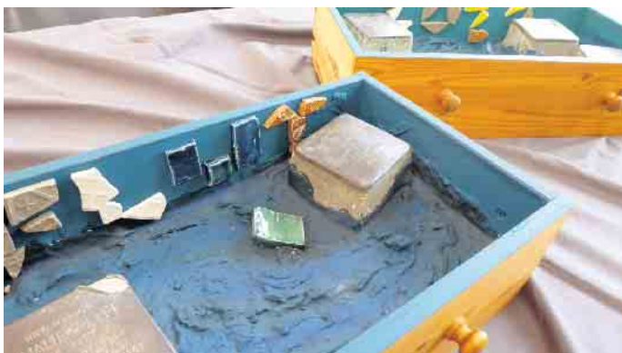
Detailansicht des Kunstwerkes: „Geflutete Erinnerung“ von Christian Baran (JSG Schleiden Jahrgangsstufe 12).

So hat das Gedenken am JSG vielfältige Formen der Präsentation und gestaltet Zukunft durch viele Kooperationen mit verschiedenen Bildungspartnern mit. Heike Schumacher, JSG Schleiden