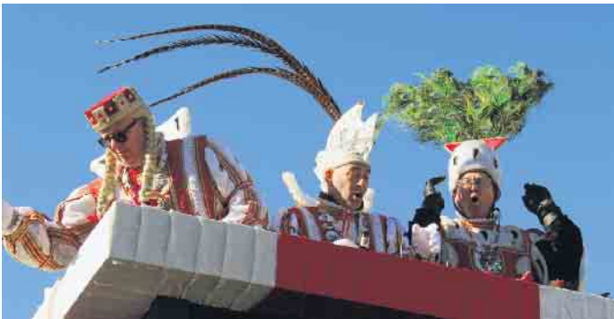
Das Dreiborner Dreigestirn