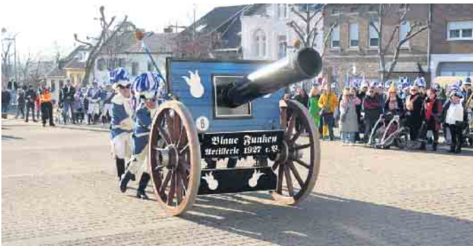
Als die Kanoniere der Blauen Funken mit der „Blauen Berta“ vorrückten, musste sich der tapfer kämpfende Rathaus-Bautrupps der närrischen Übermacht beugen.