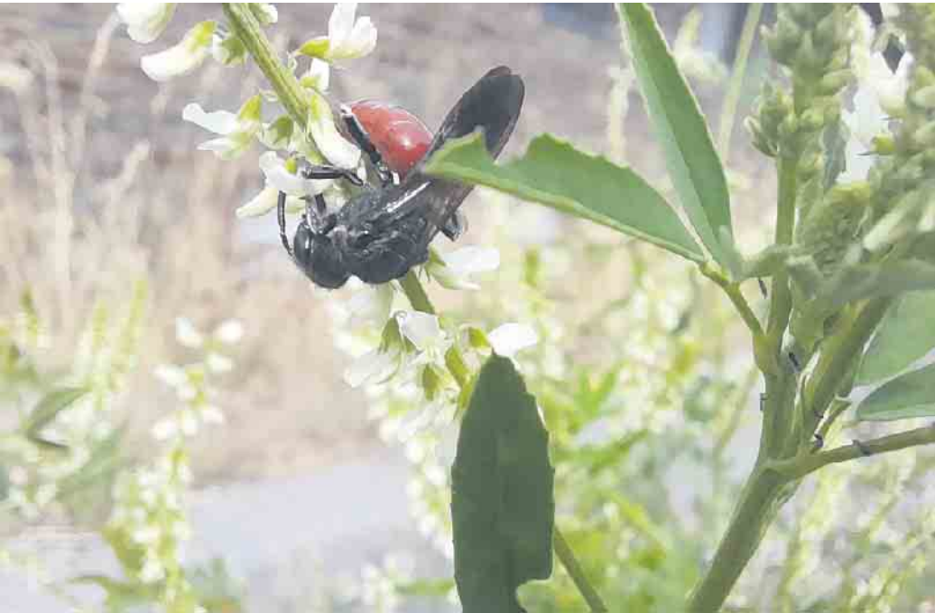
Zu den Stech-Immen gehören die Blutbienen, erkennbar an den Rotfärbungen am Hinterleib, hier die Große Blutbiene ( Sphecodes albilabris ).

dem sie punktgenau stechen oder - bei parasitoiden Arten - Eier legen können. Parasitoide legen diese an oder in Wirtstiere, aus denen dann Larven schlüpfen, die das Wirtstier nach und nach auffressen - zimperlich geht es nicht gerade zu im Insektenreich. Aufgrund dieses evolutionären Fortschritts namens „Wespentaille“ grenzen sich Taillenwespen gegen die Pflanzenwespen ab, die niemals in den Genuss dieses Vorteils kamen und die deshalb im Verlauf der Evolution kaum jagen- oder parasitoide Lebensweisen ausbilden konnten. Nach einem einführenden Vortrag, der die spannenden Lebensentwürfe typischer Stech-Immen vorstellt, und einer Darstellung der Merkmale, nach denen man die Arten unterscheidet, werden Bestimmungsübungen anhand von Fotodatenbanken und Präparaten vorgenommen. Interessierte, die sich als Hobby oder aus Berufsgründen mit der Artenkenntnis von heimischen Bienen und Wespen beschäftigen wollen, sind herzlich zu dieser Veranstaltung eingeladen. Für Erstbesucher ist sie kostenfrei; um eine Anmeldung unter anfrage@nabear.de wird gebeten. Weitere Informationen: nabear.de/ak-pflanzen-und-tiere.html