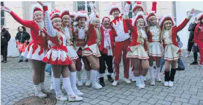
Garde-Tanzgruppe der KG Rot-Weiss Gemünd

te der Umzug in diesem Jahr einen leicht geänderten Weg zurücklegen, was aber dank der präzise vorgenommenen Straßensperrung durch Polizei und Feuerwehr zu keinem Problem wurde. Nach dem Umzug ging das fröhliche Feiern für alle bei freiem Eintritt im Festzelt weiter. ML