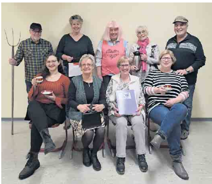
Die Akteure der Theaterfreunde Hellenthal freuen sich auf die „Modenschau em OeBestall“.