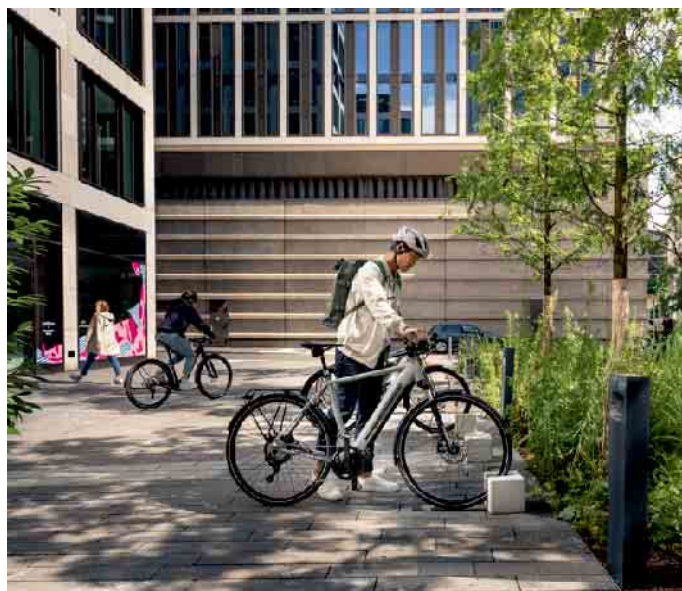
Sorgenfreier unterwegs: Mit einem digitalen Diebstahlschutz wird das Abstellen von E-Bikes noch sicherer.

Zusätzlich dient ein Sicherheitsfeature zum Deaktivieren der Motorunterstützung. Ob es aktiv und damit die Motorunterstützung deaktiviert ist, signalisieren kurze Töne, Lichter und Symbole auf der Bedieneinheit LED Remote, dem Display oder Smartphone. Unter www.bosch-ebike.com/de/produkte/ebike-protect gibt es weitere Tipps für einen wirksamen Diebstahlschutz fürs E-Bike. (DJD)