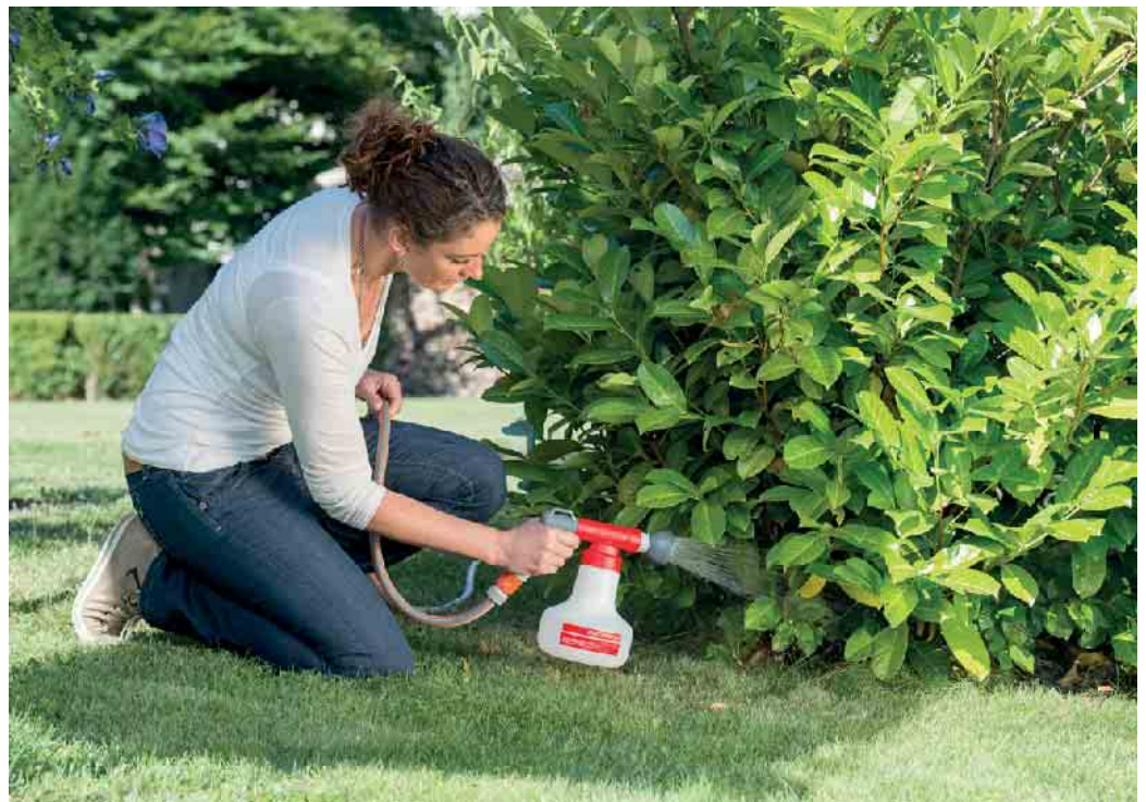
So funktioniert: Die Nematoden werden dem Gießwasser ganz automatisch in der richtigen Dosierung beigemischt.

Dickmaulrüssler: Die grauen Käfer hinterlassen runde Buchten im Laub. Den eigentlichen Schaden aber verursachen die Larven. Diese nämlich fressen