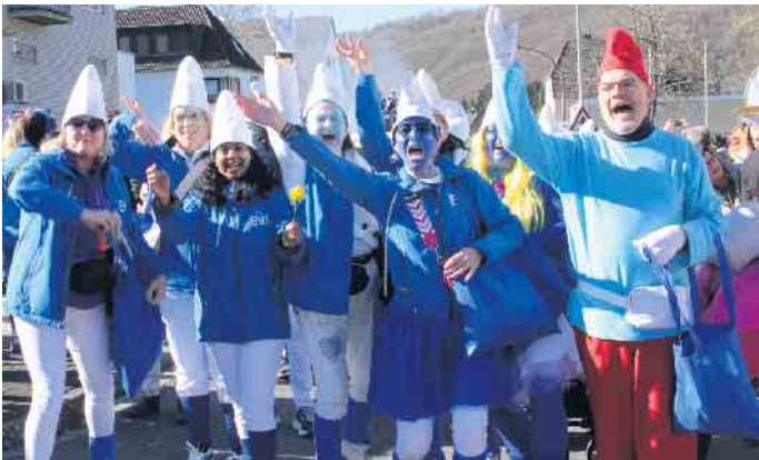
„Schlumpfe“ vom EVA Gemünd