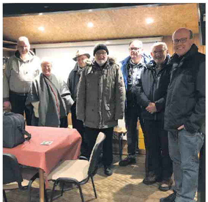
Für die Teilnehmer hat sich der Abend gelohnt.

Die Mitglieder des Ortsverbandes Rureifel treffen sich zurzeit jeden ersten Freitag im Monat um 19 Uhr im Landgasthof Stollenwerk, Im Hech 4, 52152 Simmerath - Steckenborn. Besucher sind herzlich willkommen. Informationen zum Ortsverband Rureifel finden Sie unter www.darc.de/g26 .