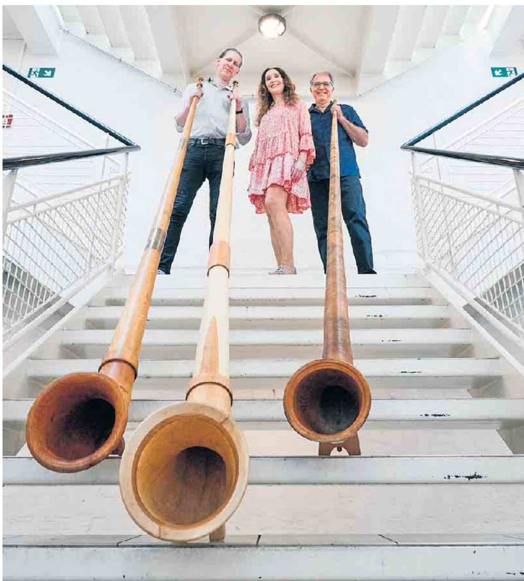
Das Trio „Alpcologne“ gastiert in Bad Münstereifel.

Reservierungswünsche, die erst am Tag der Veranstaltung eingehen, können möglicherweise nicht mehr berücksichtigt werden.