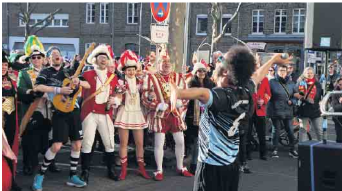
Nach dem offiziellen Programm sorgte die „Rhythmusportgruppe“ aus Düsseldorf noch für ausgelassene Stimmung vor dem Rathaus.