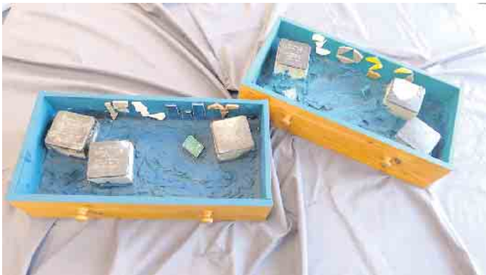
Die beschädigten Stolpersteine - im Kunstwerk. Gesamtansicht.

perstein-Ag weitere Biographien erforschen und in weiteren VIP Tafeln vorstellen, die in Vogelsang im Raum der Stille besichtigt werden können. Beim Besuch der Antisemitismusbeauftragten der Landesregierung, Sylvia Löhrmann, in Vogelsang konnten die Schüler:innen ihr Projekt bereits vorstellen.