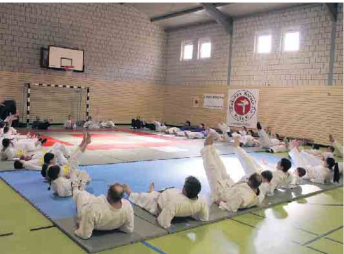
Vollmotivierte Teilnehmer beim Aufwärmen