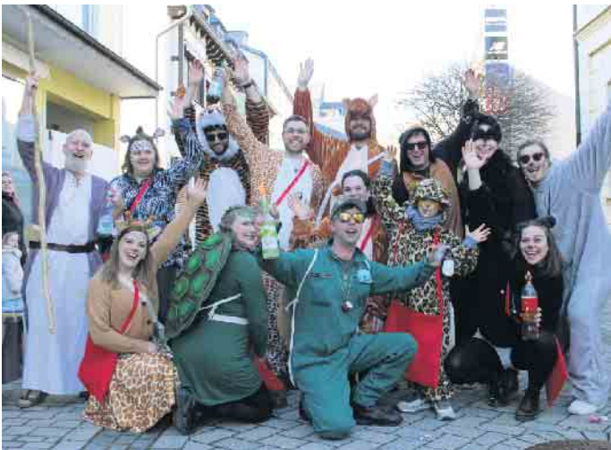
Fast schon biblisches Ausmaß: Fußgruppe Arche Noah