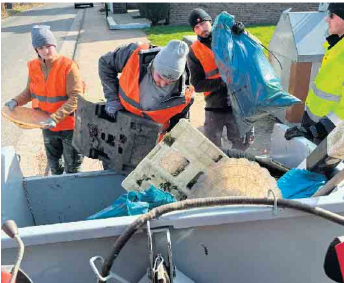
Nicht nur in der Kernstadt, sondern auch in vielen Ortsteilen, wie hier in Enzen, wurde während des Aktionstages „Frühjahrsputz in Zülpich“ wieder fleißig wilder Müll gesammelt.

melt wurde aber auch in den Ortsteilen Bürvenich, Dürscheven, Enzen, Eppenich, Geich, Langendorf, Oberelvenich, Rövenich, Sinzenich, Scherwen und Ülpenich. In Bessenich und Hoven lag die Federführung für die Sammlungen jeweils in den Händen der dortigen städtischen Kindergärten, dem Kindergarten „Zauberkiste“ Bessenich und dem Kindergarten „Kleine Freunde“ Hoven. Die Eltern, Kinder und Erzieherinnen des städtischen Familienzentrums Kita Blayer Straße sowie von der KiTa „Weltbummler“ waren in Zülpich auf dem Schulcampus und am Adenauerplatz sowie den angrenzenden Bereichen unterwegs. In Oberelvenich lag die Müllsammelung in der Organisation der KiTa Natura Haus Bollheim. Auch die Grundschulen in Wichterich, Ülpenich und Sinzenich beteiligten sich am Frühjahrsputz und waren bereits tags zuvor gruppenweise durch die jeweiligen Orte gezogen, um sie von Müll zu befreien. Ebenso war auch die Reservistenkameradschaft Zülpich wieder beim Frühjahrsputz dabei. Rund um das Ehrenmal wurden mehrere Säcke voll Unrat und Blattwerk gesammelt. Damit wur-