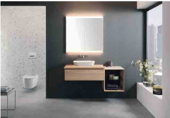
Für jede Badsituation die richtige Lichtstimmung: Die optimale Ausleuchtung ist entscheidend für das Wohlfühlambiente und die komfortable Nutzung aller Bad-Funktionen. Je nach Tageszeit haben die Nutzer:innen unterschiedliche Anforderungen an das Licht. Geberit bringt mit dem Spiegelschrank der Kollektion ONE eine Badlösung auf den Markt, die diese individuellen Ansprüche perfekt abdeckt und zudem Stauraum rund um den Waschtisch in besonders geringer Ausladung bietet.

Programmfunktionen, die das Lichtfarbspektrum automatisch und tageszeitspezifisch auf die Bedürfnisse der Nutzer:innen anpassen. Damit werden ganz neuartige Lichteindrücke im Badezimmer möglich. Bei Neubau oder Renovation können auch einbaufähige Modellvarianten des Spiegelschranks gewählt werden. Damit verschwindet der Schrank vollends in der Wandfläche, ohne dass dabei die (Licht-)Stimmung leidet. (akz-o)