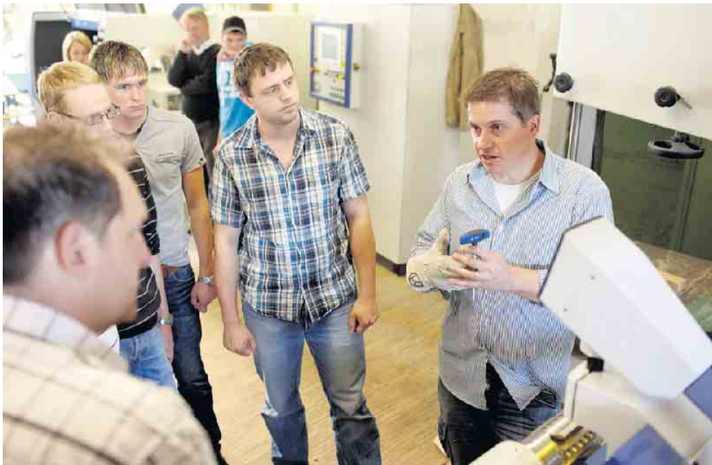
Nachhaltig die berufliche Zukunft gestalten: Rund um das Naturmaterial Holz bieten sich im Fachhandel viele Ausbildungschancen.

Nach einem erfolgreichen Abschluss verfügen Auszubildende über sehr gute Chancen auf eine feste Übernahme und können sich als Fachkräfte durch Weiterbildungsmöglichkeiten weiterqualifizieren. Auch ein anschließendes Studium oder der Start in die Selbstständigkeit zählen zu den Möglichkeiten. Das nachhaltige Baumaterial Holz dürfte jeden-