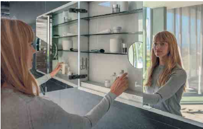
Ein Plus an Platz und Ambiente: Moderne Spiegelschränke sind wahre Multitalente in Sachen Stauraum, Zusatzfunktionen und Beleuchtung, die Räume größer wirken lassen und Stimmung reinbringen.

Den Trick mit den Spiegeln haben schon die Barock-Architekten genutzt, um kleine Räume größer wirken zu lassen. In Form moderner Spiegelschränke sind sie heute gerade für kleine Badezimmer ein absolutes Musthave, denn sie bieten alles in einem: durchdachten Stauraum in attraktivem Design, Zusatzfunktionen wie Steckdosen sowie smarte Lichttechnik. Für die Vereinigung