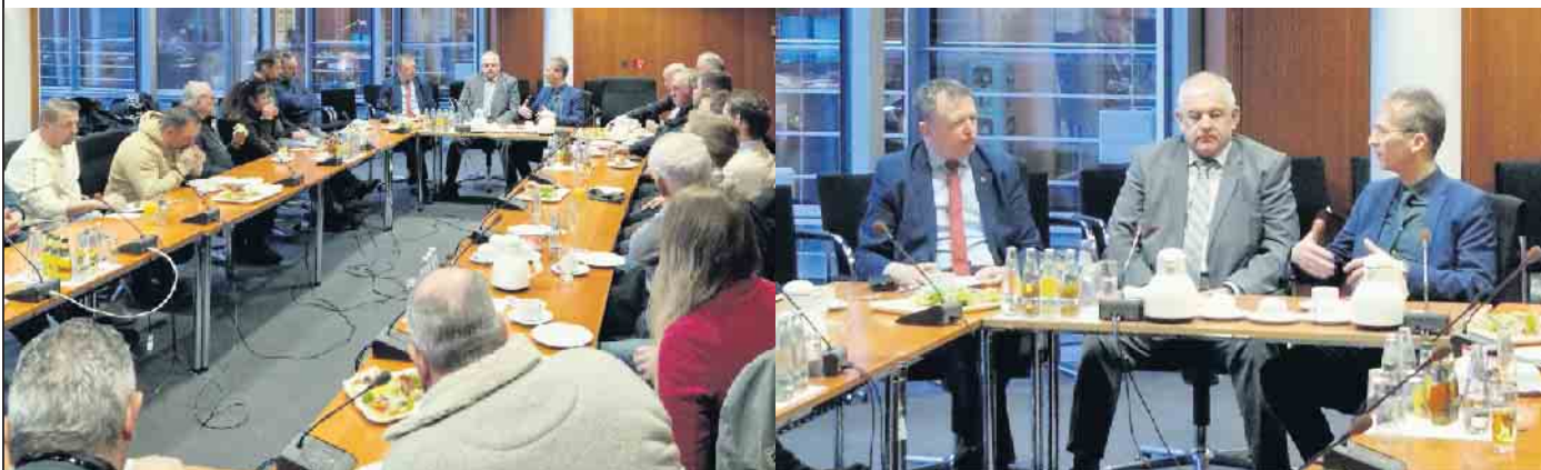
Austausch im Deutschen Bundestag am 15. Januar 2024

Aus organisatorischen Gründen wird um eine Anmeldung gebeten: euskirchen@kb.rlv.de oder 02251-2515 .