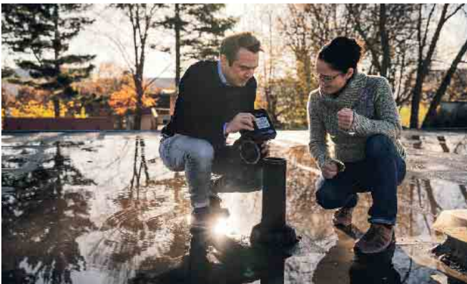
Intelligente Dachlösungen: Von Dachdeckern für Dachdecker entwickelt.

Die Fortschritte im Dachdeckerhandwerk sind ein beeindruckendes Beispiel für ein sich ständig weiterentwickelndes Gewerbe. Durch die Kombination traditioneller Handwerkskunst mit inno-