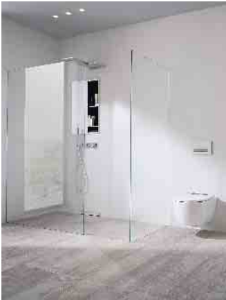
Nischenlösung als Eyecatcher hinter transparenten Wänden: Bei der Verwendung eines Vorwandsystems von Geberit kann bei der Walk-in-Dusche Geberit One mit einem passenden Montageelement die Stauraumnische einfach in der Wand verschwinden. Das spart Platz und unterstützt eine minimalistische Badezimmer-Gestaltung.

Aber auch eine abgeschlossene Kabine kann ausgesprochen transparent wirken, wenn eine rahmenlose oder teilgerahmte Beschlag-Duschkabine gewählt wird. Wie auch immer: Hauptsache, die Dusche bietet kein Hindernis für grenzenlosen Durchblick.