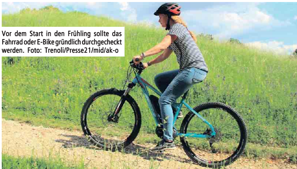
Vor dem Start in den Frühling sollte das Fahrrad oder E-Bike gründlich durchgecheckt werden.

Vor der ersten Fahrt: Klingel prüfen! Funktioniert das Licht am Fahrrad oder E-Bike - vorne und hinten - nicht, gilt es, zuerst Kabel und Steckverbindungen zu prüfen und bei Bedarf die Steckverbindungen zu befestigen. Beim Pedelec lässt sich das Licht oft mechanisch und über den Bordcomputer ein- und ausschalten, daher empfiehlt es sich, immer beides zu überprüfen. Wer beim