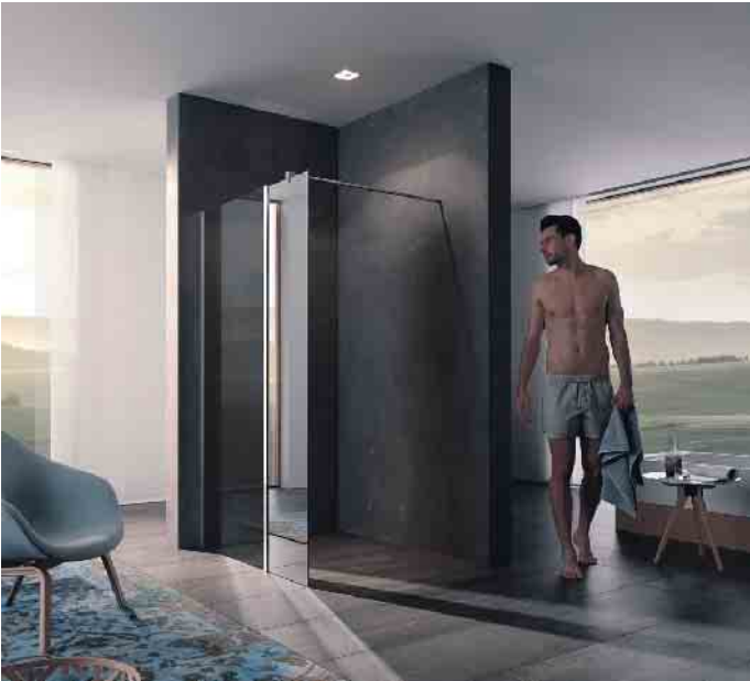
Transparente und teilverspiegelte Trennwände bei der Dusche bringen ein Gefühl von Weite - auch in kleine Bäder.

Duschtrennwände kleine Bäder optisch größer wirken.