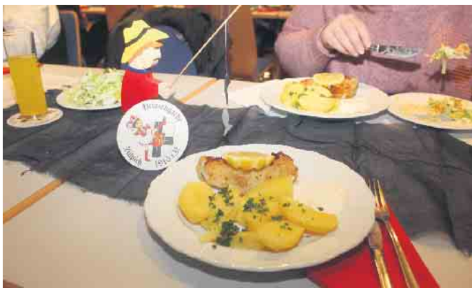
Der aufgetischte Fisch ließ keine Wünsche offen