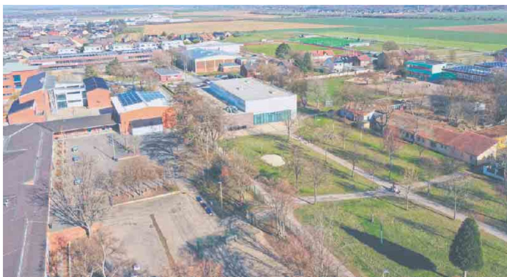
Links im Vordergrund ist der stark versiegelte Schulhof der Gemeinschaftshauptschule zu sehen. Oben rechts das Schulgelände der Chlodwigschule.

Mit diesem Programm des Landes NRW werden investive Maßnahmen auf Schul- oder Kitahöfen, so genannte „coole“ Schulhöfe, gefördert, die zu einer Abmilderung der Auswirkungen des Klimawandels führen und somit der Klimawandelvorsorge dienen. Für beide Projekte hatte die Stadt Zülpich eine 100-Prozent-Förderung von insgesamt 728.887,73 Euro beantragt, die nun auch so bewilligt wurde. Die Fördersumme be-