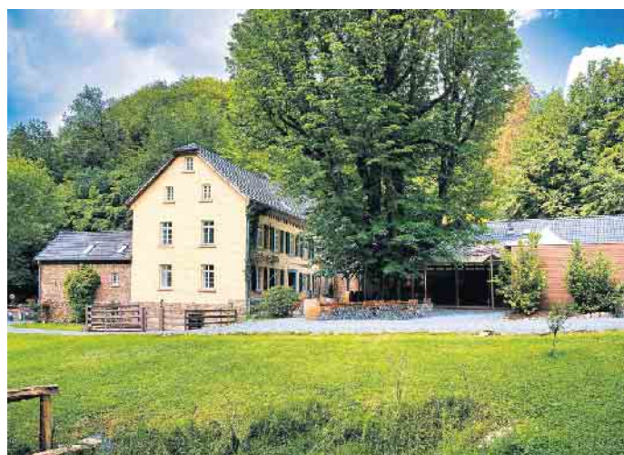
Die unter Denkmalschutz stehende Kupfersiefer Mühle bei Köln erhält eine neue Zukunft mit innovativen, kreislauffähigen Baumaterialien.

Die Mühle wurde im Zeichen des nachhaltigen Bauens und unter Denkmalschutzauflagen aufwendig saniert. (djd)