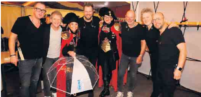
Eine Abordnung von Tolbiacums Töchter gemeinsam mit den Bandmitgliedern der Paveier

Tolbiacums Töchter 2024 e.V. waren begeistert von der tollen „Konfettirään-Aktion“ der Kölner Musikband „Paveier“ zu Gunsten der Diakonie Michaelshoven.