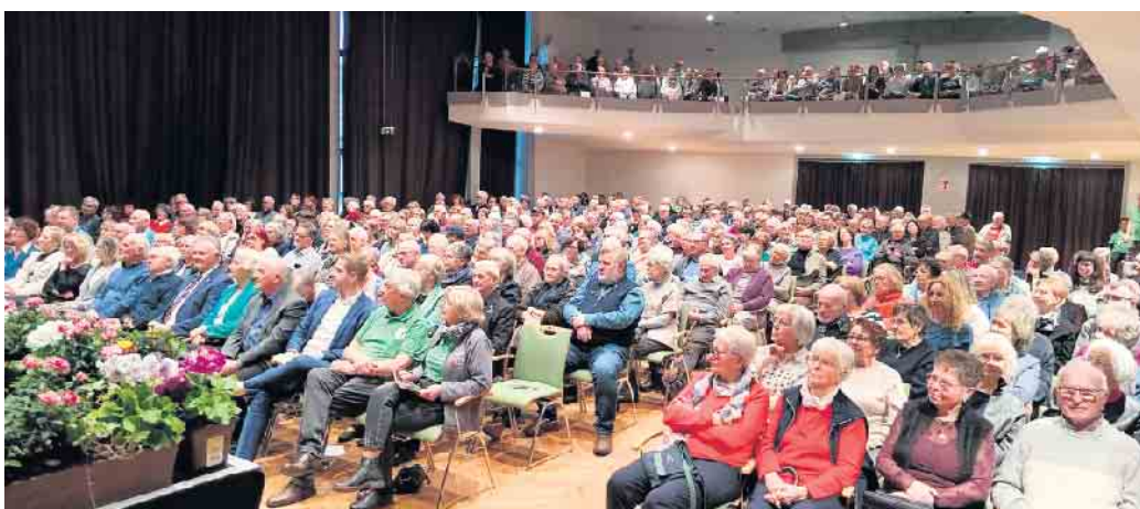
Das Konzert zugunsten der Hilfsgruppe Eifel war schon frühzeitig ausverkauft, so wie alle 13 vorherigen seit dem Jahr 2011.

im erneut ausverkauften Kursaal das nunmehr 14. Neujahrskonzert zugunsten der Hilfsgruppe. Lediglich in den Jahren der Corona-Pandemie und der danach folgenschweren Flut in der Eifel fielen zwei Neujahrskonzerte aus.