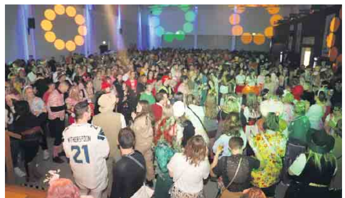
Das Forum platzte an Weiberfastnacht sprichwörtlich fast aus allen Nähten