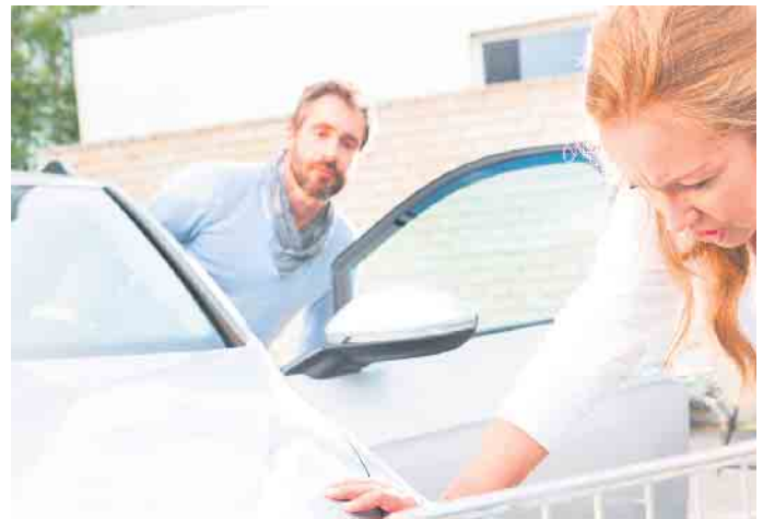
Typische Bagatellunfälle sind schnell passiert - vor allem beim Ein- und Ausparken kommt es immer wieder zu Dellen oder Kratzern am Auto.

Unter www.devk.de/auto kann man sich über die Leistungen der Kfz-Versicherung informieren. Bis zum 30. November können viele ihre Police kündigen und zum neuen Jahr zu einem anderen Anbieter wechseln.(DJD)