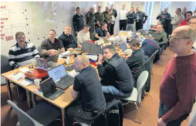
Den Herausforderungen einer Extremwetterlage stellten sich die Einsatzkräfte im Rahmen einer gemeinsamen Übung.

Eifel mit der BUND-Sonderausstellung besuchen möchte, hat dazu täglich von 10 bis 17 Uhr die Gelegenheit. Die Sonderausstellung ist im Eintrittspreis für die „Wildnis(t)räume“ enthalten. Informationen zu Führungen durch die „Wildnis(t)räume“ und weitere Veranstaltungen gibt es auf www.nationalparkzentrum-eifel.de .