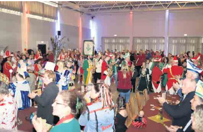
Das Forum war sehr gut besucht zum Tollitätenempfang