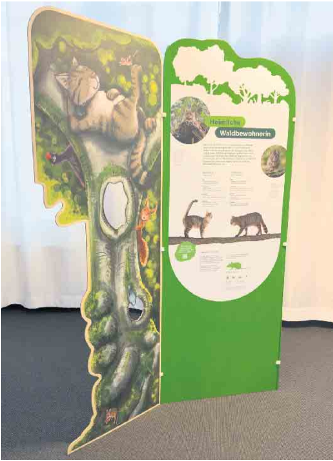
Mit interaktiven Elementen, wie dieser Selfie-Point, informiert die Wanderausstellung „Wildkatzenwälder von morgen“ des BUND. Die Ausstellung ist vom 11. März bis zum 4. Mai im Nationalpark-Zentrum Eifel zu sehen. Die Ausstellung ist im Eintrittspreis für die „Wildnis(t)räume“ enthalten.

große, zusammenhängende Mischwaldflächen zum Herumstreifen, strukturreiches Offenland, ruhige Dickichte zum Verweilen und reichlich Versteckmöglichkeiten für die Aufzucht von Jungen. Insgesamt beherbergt der Nationalpark Eifel mehr als 11.413 Tier- und Pflanzenarten. Davon stehen 2.617 als bedrohte Arten auf der Roten Liste. Für sie ist der Nationalpark Eifel ein überlebenswichtiger Rückzugsraum. Neben der Wildkatze erobern Biber, Milane, Mauereidechsen, Wildnarzissen und auch typische Arten für alte Wälder wie der „Urwald-Pilz“ Ästiger Stachelbart den Nationalpark als Lebensraum. Einst verschwundene Tier- und Pflanzenarten sind mittlerweile wieder in Nordrhein-Westfalen heimisch und einige in ihrem Bestand gefährdete Arten konnten sich erholen. Dennoch ist die biologische Vielfalt weiter bedroht: Fast die Hälfte der untersuchten Tier-, Pilz- und Pflanzenarten stehen in Nordrhein-Westfalen auf der „Roten Liste“. Das heißt, sie sind gefährdet, vom Aussterben bedroht oder bereits ausgestorben. In den Dynamikzonen des Nationalparks Eifel darf sich die Natur frei entfalten. Im Moment ist dort der Wandel vom ehemaligen Wirtschaftswald hin zum wilden Naturwald zu erleben. Hinweis zur Sonderausstellung: Wer das Nationalpark-Zentrum