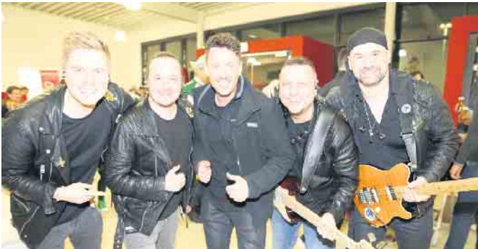
Ein musikalischer Höhepunkt für viele war der Auftritt von „Eldorado“ aus Köln