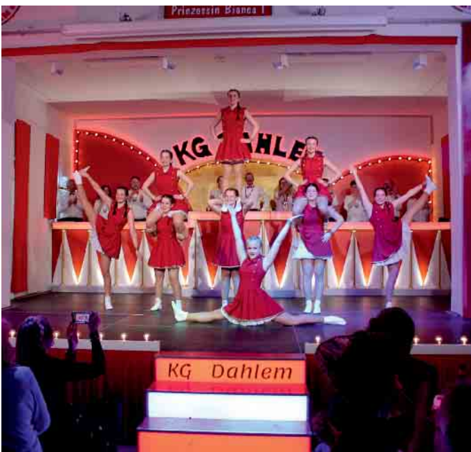
Gardetanz der Dahlemer Mariellcher