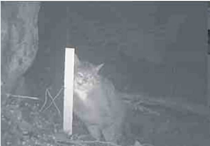
Wildkatzen lieben Baldrian. Sie reiben sich an dem damit getränkten Stock, hinterlassen DNA-Spuren und können so erfasst werden. Mindestens 121 Wildkatzen sind im Nationalpark Eifel beheimatet.

große, zusammenhängende Mischwaldflächen zum Herumstreifen, strukturreiches Offenland, ruhige Dickichte zum Verweilen und reichlich Versteckmöglichkeiten für die Aufzucht von Jungen. Insgesamt beherbergt der Nationalpark Eifel mehr als 11.413 Tier- und Pflanzenarten. Davon stehen 2.617 als bedrohte Arten auf der Roten Liste. Für sie ist der Nationalpark Eifel ein überlebenswichtiger Rückzugsraum. Neben der Wildkatze erobern Biber, Milane, Mauereidechsen, Wildnarzissen und auch typische Arten für alte Wälder wie der „Urwald-Pilz“ Ästiger Stachelbart den Nationalpark als Lebensraum. Einst verschwundene Tier- und Pflanzenarten sind mittlerweile wieder in Nordrhein-Westfalen heimisch und einige in ihrem Bestand gefährdete Arten konnten sich erholen. Dennoch ist die biologische Vielfalt weiter bedroht: Fast die Hälfte der untersuchten Tier-, Pilz- und Pflanzenarten stehen in Nordrhein-Westfalen auf der „Roten Liste“. Das heißt, sie sind gefährdet, vom Aussterben bedroht oder bereits ausgestorben. In den Dynamikzonen des Nationalparks Eifel darf sich die Natur frei entfalten. Im Moment ist dort der Wandel vom ehemaligen Wirtschaftswald hin zum wilden Naturwald zu erleben. Hinweis zur Sonderausstellung: Wer das Nationalpark-Zentrum