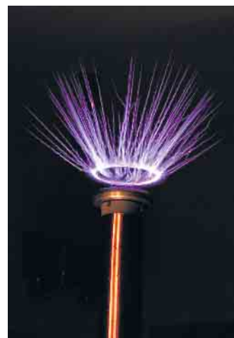
Der Ortsverband G26 Rureifel lässt die Funken überspringen.

forderlich. Gäste sind herzlich willkommen. Die vorhandenen Plätze werden in der Reihenfolge der Anmeldung vergeben. Die Veranstaltung beginnt um 18 Uhr mit einem gemütlichen Teil. Um 19.30 Uhr startet die Vorführung und dauert etwa 90 Minuten. Die Anmeldung erfolgt über die E-Mail-Adresse df3ed@dar.de mit dem Anmeldeschluss 10. März, 22 Uhr. Die Mitglieder des Ortsverbandes Rureifel treffen sich zurzeit jeden ersten Freitag im Monat um 19 Uhr im Landgasthof Stollenwerk, Im Hech 4, 52152 Simmerath-Steckenborn. Besucher sind herzlich willkommen. Informationen zum Ortsverband Rureifel finden Sie unter www.darc.de/g26 .