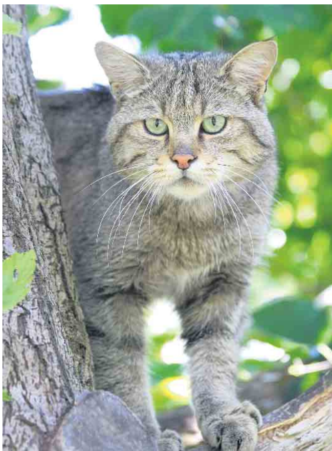
Wildkatzen lieben strukturreiche Laub- oder Mischwälder mit liegendem und stehendem Totholz, Wurzeltellern, Bachtälern und strukturreichen Waldrändern.

Um den Bestand an Wildkatzen zu ermitteln, haben Forschende eine ganz besondere Monitoring-Methode angewandt: mit Baldriantinktur eingesprühte Holzpfosten. Der Duft ist für Wildkatzen unwiderstehlich. Vom Geruch angelockt, reiben sich die Tiere an den Stöcken und hinterlassen Haare mit ihrer DNA. So können Individuen genau bestimmt werden. Insgesamt sind derzeit mindestens 121 Wildkatzen im Gebiet des Nationalparks Eifel be-