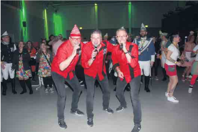
Gen Mitternacht konnten die Bremsklötz im Forum begrüßt werden. Seit Jahren sind die drei Garanten für beste Stimmung und aus dem Karneval schon längst nicht mehr weg zu denken