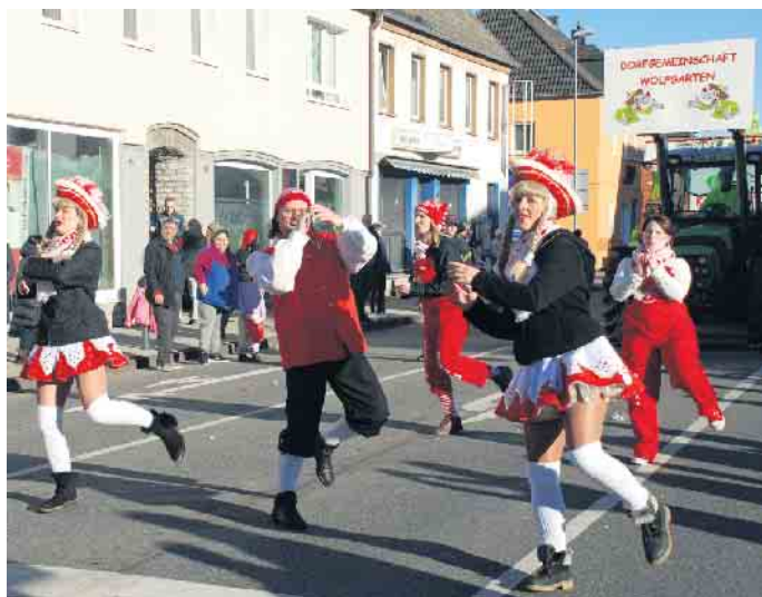
Tanzdarbietung der KG Rot-Weiß Gemünd