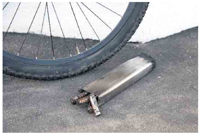
Das hätte auch ins Auge gehen können: ein zerstörter E-Bike-Akku.

wertigen Rads kann man selbst noch einiges dafür tun, dass die Sicherheit bestehen bleibt. So muss das E-Bike samt Akku stets richtig abgestellt werden, am besten in einem trockenen Raum mit einem Stein-, Fliesen- oder Betonboden, optimalerweise mit einem Rauchmelder. Ein Ladestand zwischen 25 und 70 Prozent ist ideal. Weist der Akku irgendwann Brüche oder Schrammen auf oder sollte er sich sogar verformen, dann ist der Gang zur Fahrradwerkstatt dringend angeraten. Tritt einmal Qualm aus einem Akku aus, rät die Feuerwehr dazu, sich vom Rad zu entfernen und die Notfallnummer 112 zu wählen. (djd)