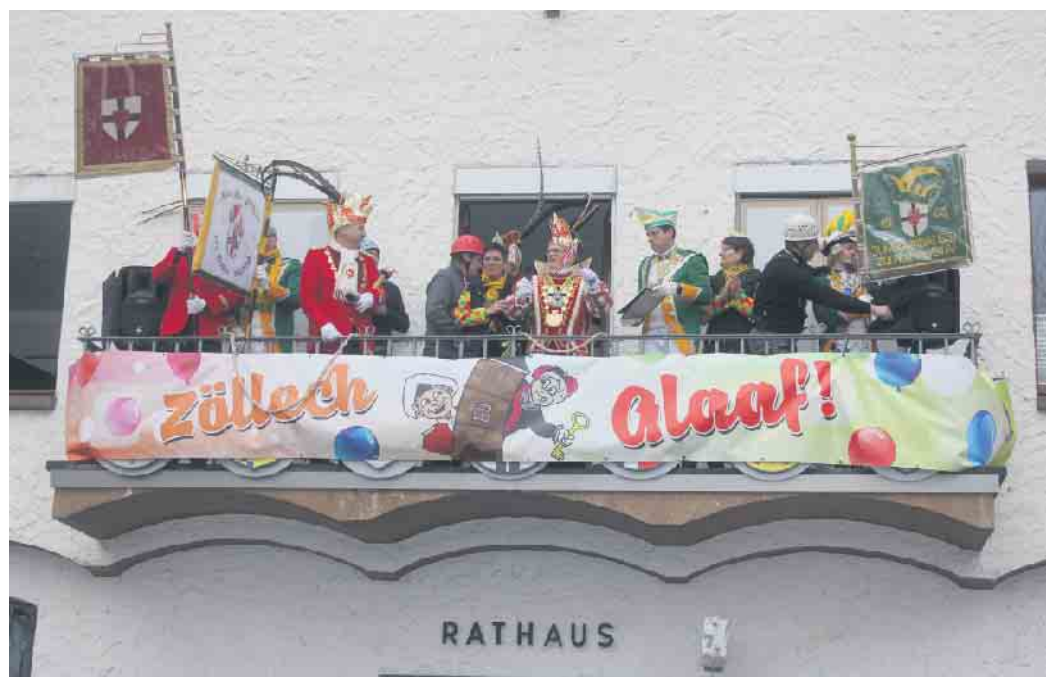
Die Römerstädter waren an altbekannter Stelle wieder ganz jeck