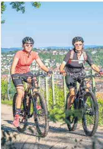
Damit keine Beschwerden das Radvergnügen trüben, sollte vor allem der Sattel richtig eingestellt sein.