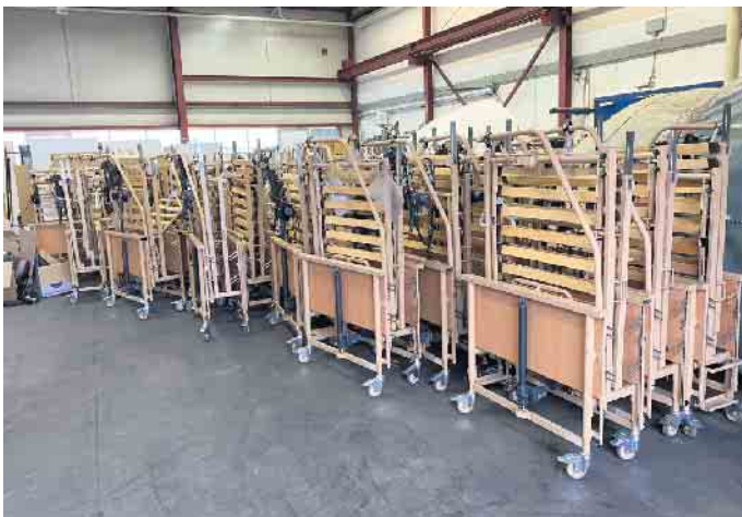
Die noch eingelagerten Betten