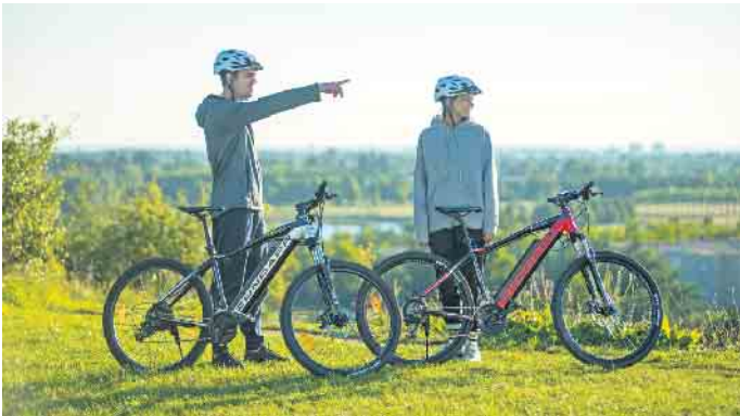
Sicherheit beim Fahrradfahren betrifft nicht nur die Ausrüstung mit Schutzhelm, sondern auch die Ausstattung des E-Bikes.

sie beispielsweise bei einem Sturz beschädigt, kann es zum Kurzschluss kommen. Das ist auch möglich, wenn das E-Bike im Hochsommer für längere Zeit in der Sonne abgestellt wird. Im schlimmsten Fall kann dann der Akku explodieren - und das ist auch für den Radfahrer gefährlich, da das Bauteil sehr viel Energie speichert und die Reaktion dementsprechend heftig ausfallen kann. Umso wichtiger ist es, beim Kauf auf hohe Qualität zu achten. Hier zeichnen unter anderem das CE-Logo oder das Prüfsiegel des Verbands der Elektrotechnik (VDE) sicherheitsgeprüfte Fahrräder aus. Von sogenannten Schnäppchen-Bikes, oftmals Importe aus Fernost mit möglicherweise gefälschten Prüfsiegeln, raten Experten ab - besser sei der Kauf im