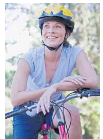
Ein richtig geformter Fahrradsattel passt zur individuellen Sitzhaltung des jeweiligen Fahrers oder der jeweiligen Fahrerin.