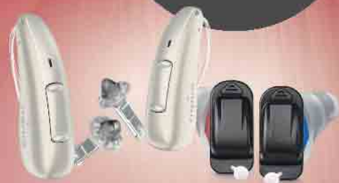
z.B. das Pure C&G AX oder das Silk X von Signia