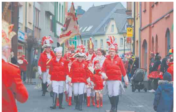
Mit großem Gefolge marschierten die Traditions corps der vier römerstädtischen Karnevalsgesellschaften in Richtung Rathaus, um dieses zu erobern.

te für die nächsten Tage. Eins durfte natürlich auch nicht fehlen: Zu den Klängen der Zülpicher Hymne „In Zöllechs ahle Muure“ wurde geschunkelt und getanzt. FH