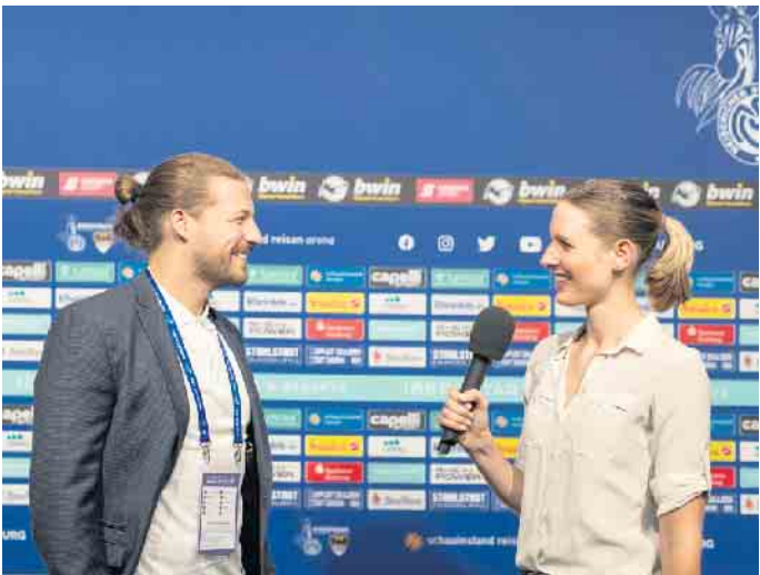
Reporter und Journalisten sind ganz nah dran an den wichtigen Leuten des Sportbusiness. Hier ist die richtige Kommunikation ausschlaggebend.