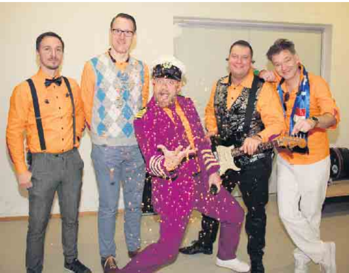
Die Männer von „Tacheles“ ließen unter dem Motto „Alles kann, Stimmung muss“ den Abend schließlich stimmungsgeladen ausklingen