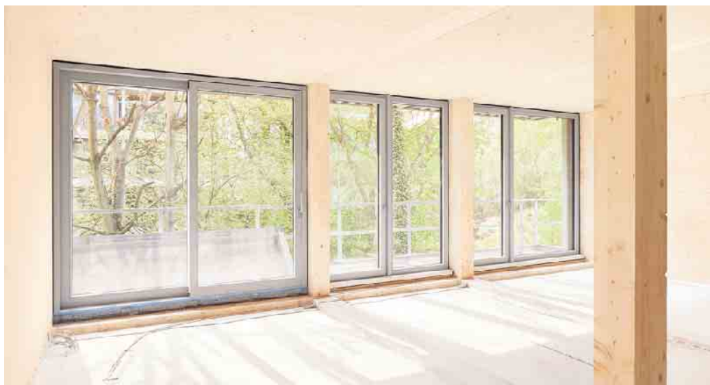
Lichtdurchflutete Räume, eingerahmt von eleganter Metall-Optik: Fensterrahmen aus einem Aluminium-Holz-Verbund bieten viele Gestaltungsmöglichkeiten gerade für großformatige Fenster.