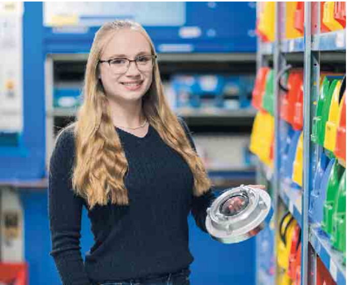
Kaufleute für Groß- und Außenhandelsmanagement sorgen für einen reibungslosen Warenfluss.

mehr als 1.000.000 Artikel bereit. Entsprechend vielseitig sind die Tätigkeiten an der Schnittstelle von Herstellern und Verwendern. Kaufleute für Groß- und Außenhandelsmanagement Für angehende Kaufleute, die sich für Handelswege und Warenaustausch interessieren, bietet der Technische Handel eine Ausbildung in den Fachrichtungen Großhandel und Außenhandel an. Für kommunikative Organisationstalente ist dies genau das Richtige, denn hier geht es um den reibungslosen Warenfluss von der Bestellung über die Lagerung und Auslieferung bis hin zur Bezahlung. Kaufleute für Büromanagement Für alle, die am liebsten am Schreibtisch arbeiten, empfiehlt