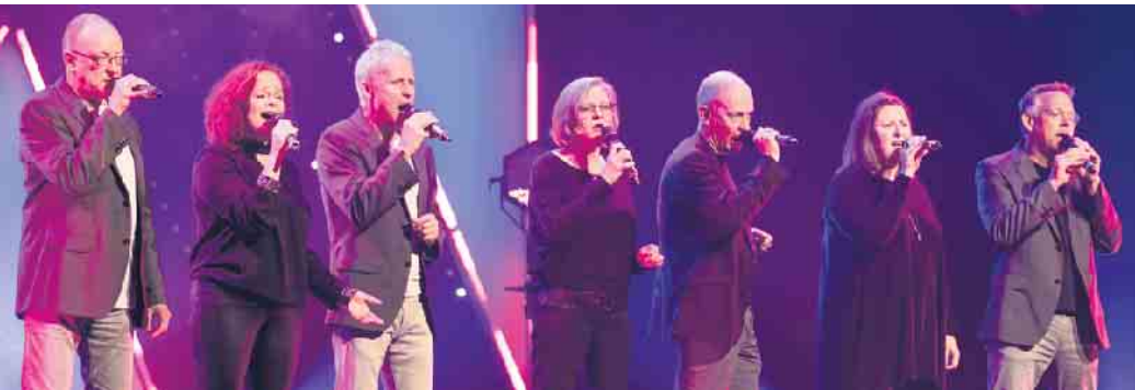
Dacapella in Aktion.

Das mehrfach preisgekrönte Ensemble „Dacapella“ gastiert im Münstereifeler Kulturhaus