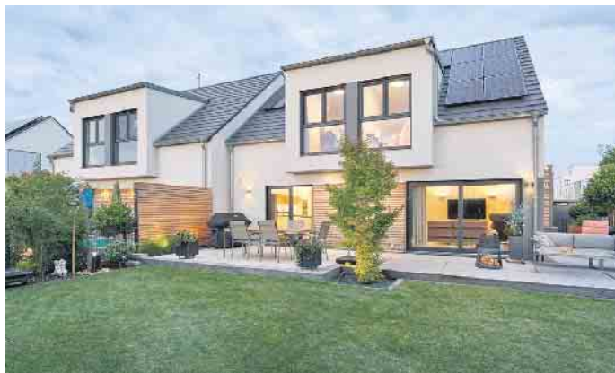
Doppelhaus in Fertigbauweise - das geht achsensymmetrisch oder auch grundverschieden.

effizienter, weil es eine Außenwand weniger gibt“, so Hannott. Diese senke die Wohnnebenkosten beider Parteien und gebe bei einem zukunftsicher geplanten Doppel-Fertighaus mit fortschrittlicher Technik wie einer Photovoltaikanlage, einer Wärmepumpe und hauseigenen Speicherbatterie auf Jahre hin Kosten- und Versorgungssicherheit. (BDF/FT)