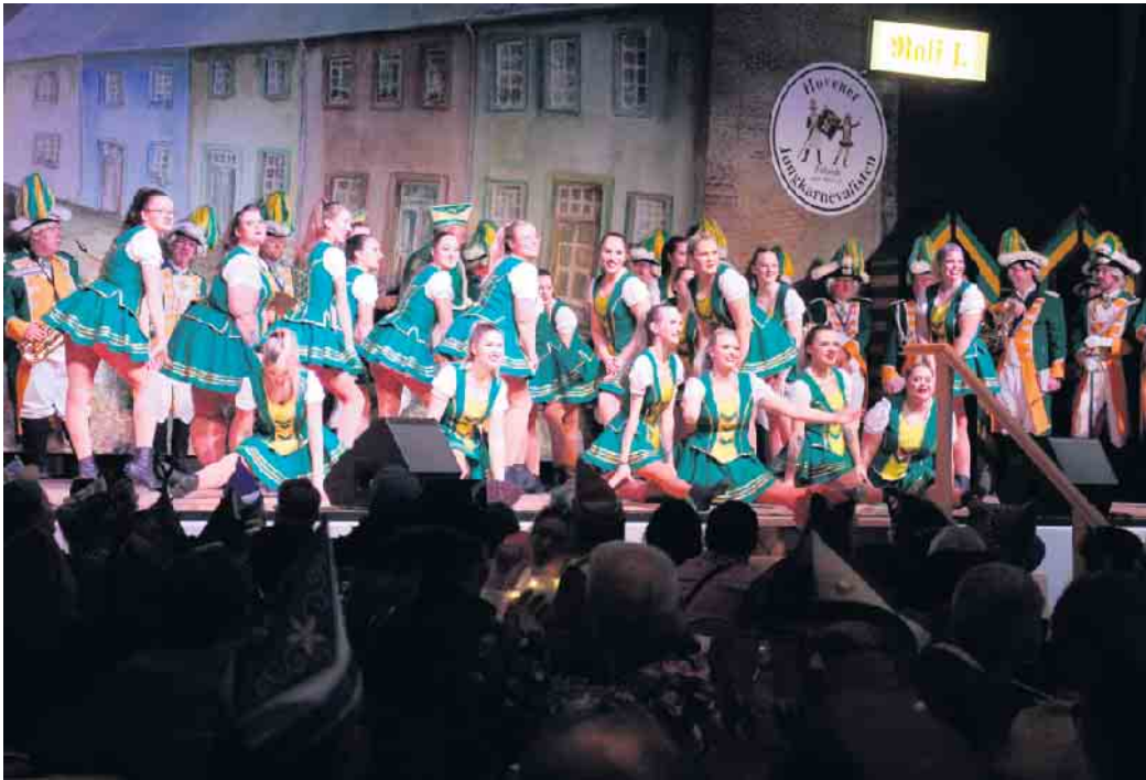
Zu Beginn heizte die Damengarde der HJK mit ihren Tänzen so richtig ein