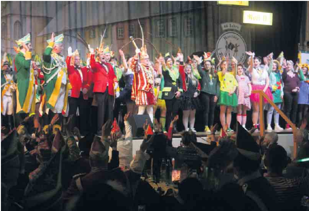
Nach dem Einzug mit Prinz Rolf II. bot sich ein prächtiges Bild auf der Bühne

Hovener Jungkarnevalisten luden zur Kostümsitzung ein