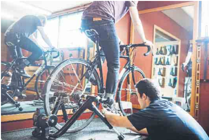
Das Rad besitzt die Kontaktstellen Hintern/Sitz, Hände/Griff und Füße/Pedale. Alle drei sollten an den Menschen und seine anatomischen Gegebenheiten angepasst sein.

Wer mit seinem Rad Spaß haben möchte, sollte es ergonomisch einstellen lassen