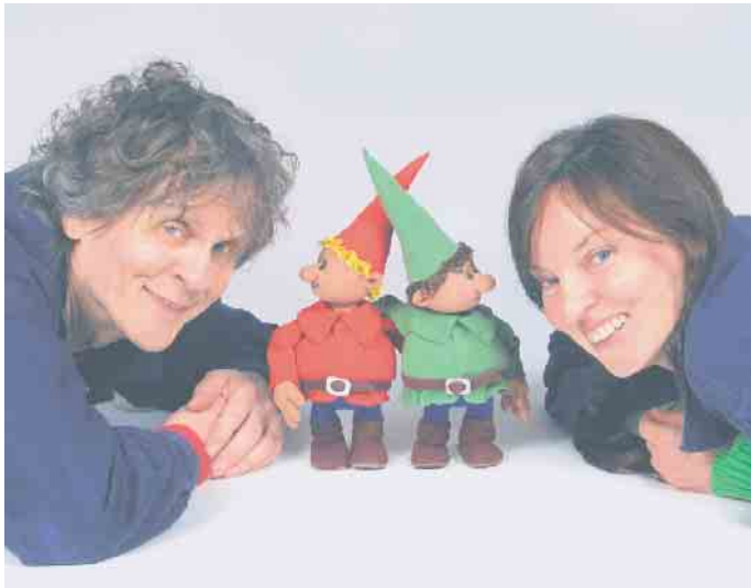
Himpelchen und Pimpelchen mit ihren beiden Akteuren.