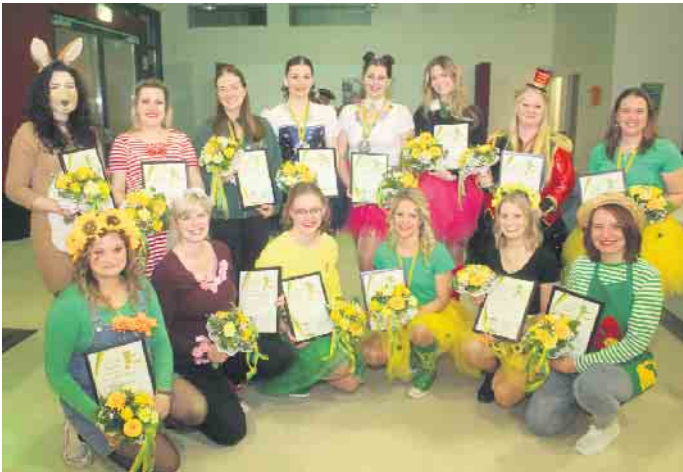
Traditionell werden bei der HJK Sitzung ehemalige Tänzerinnen verabschiedet. Aufgrund der zwei Jahre „Pause“ aufgrund von Corona hatten sich 15 Verabschiedungen „angesammelt“