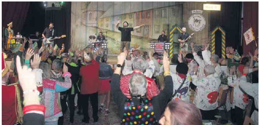
Höhepunkt für viele war wohl der Auftritt von „De Boore“