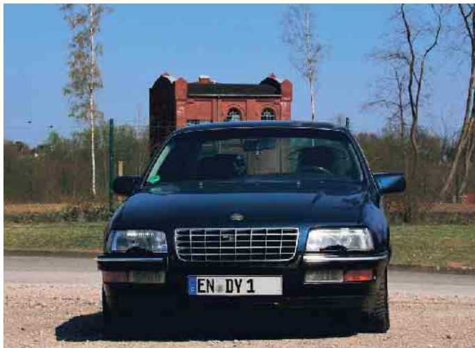
Autokennzeichen müssen von Gesetzes wegen gut lesbar sein.