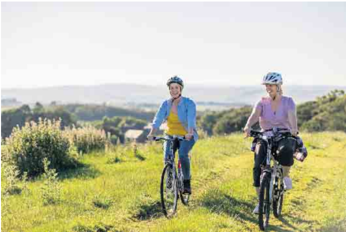
Ein richtig geformter Fahrradsattel passt zur individuellen Sitzhaltung des jeweiligen Fahrers oder der jeweiligen Fahrerin.

Radfahren ist beliebter denn je: Es macht Spaß, ist gesund und vor allem auch umweltfreundlich. Einem aktuellen Statista-Bericht zufolge gibt es in Deutschland knapp 80 Millionen Fahrräder - rechnerisch besitzt also fast jeder Mensch hierzulande eines. Und bei immerhin etwa 13 Prozent aller zurückgelegten Wege im Personenverkehr wird das Rad bereits als Verkehrsmittel genutzt. Damit Rad-