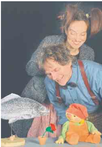
Goethe zeigt seine Blume dem Karpfen.

es wird empfohlen, unter 02257/4414 oder unter kulturhaus@theater-1.de zu reservieren. Reservierungswünsche, die erst