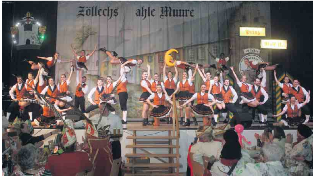
Tanzcorps „Kölsche Greesberger“ der KG Große Greesberger e.V. Köln von 1982