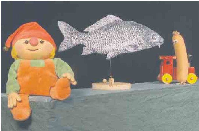
Goethe mit Karpfen und Wurst