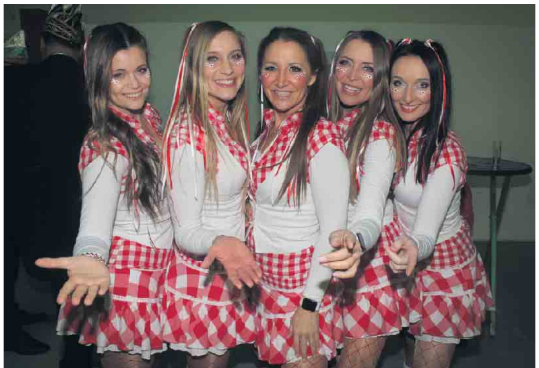
Auch die „Funky Marys“ waren zu Gast und feierten das närrische Publikum weiter an