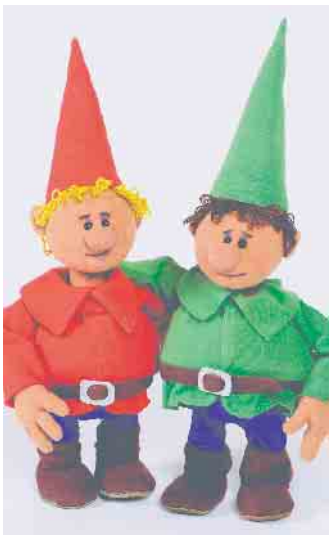
Himpelchen und Pimpelchen ha-ben eine wichtige Botschaft