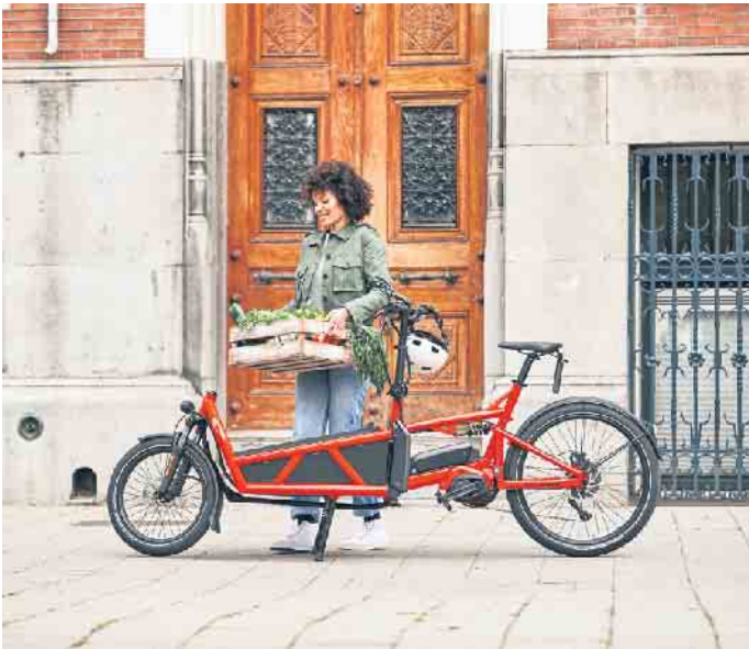
Lastenräder gehören in vielen Städten zum Alltagsbild. Mit elektrischer Unterstützung ermöglichen E-Cargobikes den bequemen Transport zum Beispiel von Wocheneinkäufen.

Wichtig ist gerade bei elektrischen Lastenrädern ein leistungsstarker Akku, um angesichts des Eigengewichts und der transportierten Lasten eine hohe Reichweite zu ermöglichen. Praktisch ist zudem die Navigationsfunktion. Das vernetzte Display navigiert entspannt zum nächsten interessanten Ort, egal ob zu Ausflugszielen oder einem neuen angesagten Café. Praktisch sind dabei die Reichweiten-Hinweise, die automatisch berechnen, ob das Wunschziel mit elektrischer Unterstützung noch bequem erreicht werden kann. (djd)