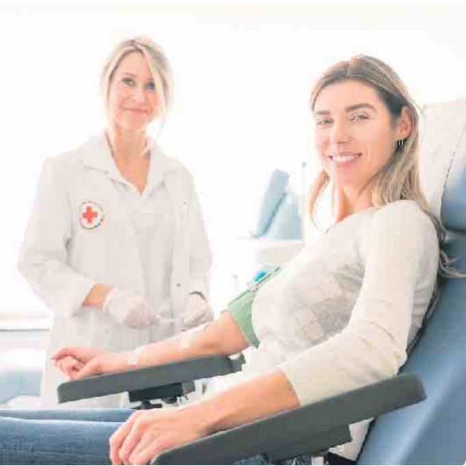
Während der Blutspende ist auch immer eine ärztliche Aufsicht zugegen, um einen reibungslosen Ablauf zu gewährleisten.

Der erste Blutspendetermin in diesem Jahr in Hellenthal, findet am Freitag, 14. Februar, statt. Wie immer bei diesen Terminen in Hellenthal kann in der Zeit von 15 bis 19.30 Uhr in der Hauptschule Hellenthal Blut gespendet werden. Terminreservierungen können unter „www.blutspende.jetzt“ vorgenommen werden. Aber auch wer keine Reservierung vorgenommen hat, kann noch kurzentschlossen zum Blutspenden kommen. Blutspender müssen mindestens 18 Jahre alt sein. Wenn jemand das erste Mal Blut spenden will, darf er nicht älter als 68 Jahre sein. Wer zum wiederholten Male spenden will, darf dies bis zu einem Alter von 75 Jahren noch tun. Vor der Blutspende findet auch eine ärztliche Beratung statt.