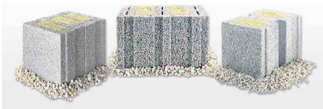
Leichtbetonsteine gelten aufgrund ihrer Massivität sowie ihrer porigen Struktur als wahre Schallschlucker.

teklasse sogar mit einem Zwei-Dezibel-Bonus in der Normung“, ergänzt Krechting. Mit diesen Werten in den eigenen Wänden sind Bewohner jederzeit, egal ob im Ein- oder Mehrfamilienhaus, rundum vor Geräuschen aus Nebenzimmern und benachbarten Wohnungen geschützt. Ausführliche Informationen finden Interessierte in der kürzlich aktualisierten, kostenfreien Broschüre „Massives Plus an Schallschutz“. Diese steht etwa unter www.klb-klimaleichtblock.de in der Rubrik „Download“ bereit oder kann telefonisch unter 02632-25770 angefordert werden. (djd)