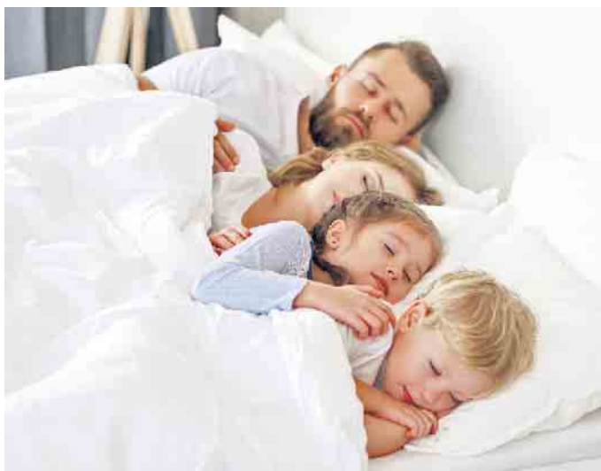
Gesund und in Ruhe wohnen: Mit Außenwänden aus Leichtbeton profitieren Familien von einem hohen Schallschutz.

Experten empfehlen zu diesem Zweck den Einsatz massiven Mauerwerks aus Leichtbeton, um störenden Lärm dauerhaft und wirksam auszuschließen. „Leichtbetonsteine“ enthalten porige Zuschläge wie Bims oder Blähton. Diese sorgen für winzige Lufteinschlüsse, die den Baustoff leichter machen und