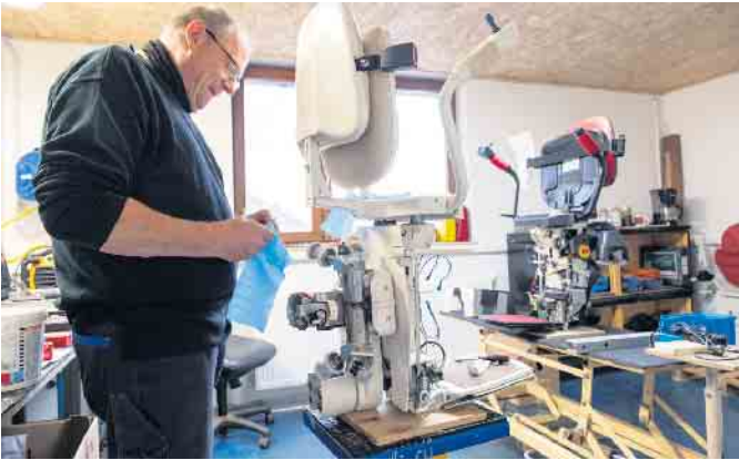
Werkstatt, Büros, Ausstellung und Lager - auf den rund 1800 Quadrat-metern Fläche in Bleibuir ist nun alles unter einem Dach vereint.

Der kann bereits auf knapp 36 Jah-re Erfahrung im Bereich Treppen-lifte zurückgreifen. Als gelernter Elektrotechniker hat er 1988 bei Lifta als Montageleiter begonnen, war später technischer Leiter im Unternehmen. Noch etwas später hat er als angestellter Geschäfts-führer eine Spezialfirma für ge-brauchte Treppenlifte aufgebaut