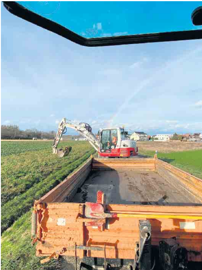
Im Zuge des Wiederaufbaus, aber auch als Präventivmaßnahme für den Hochwasserschutz wurden die Wegeseitengräben in zahlreichen Ortschaften unter die Lupe genommen.

wird zurzeit in Abstimmung mit dem Erftverband und dem beteiligten Ingenieurbüro die Ausführungsplanung erstellt. Künftig sollen Unterhaltung und Pflege der städtischen Wegeseitengräben nach einem Kataster durch den Baubetriebshof der Stadt Zülpich mit einem hierfür angeschafften Bagger mit Spezialanbaugeräten gewährleistet werden.