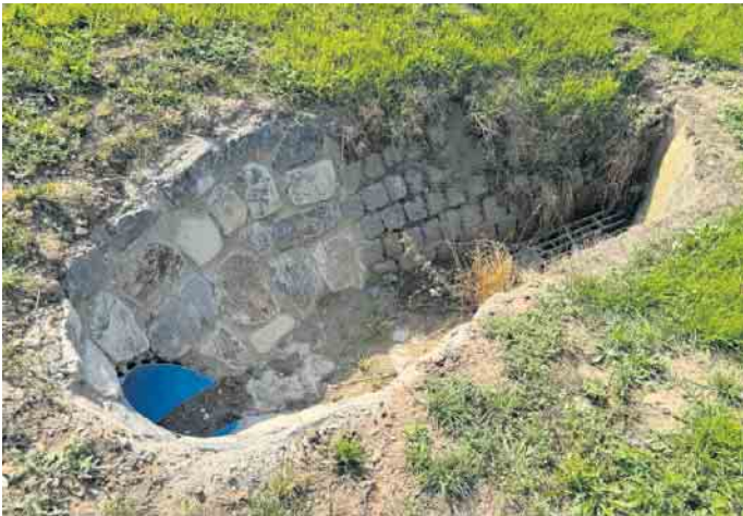
Im Zuge der Überprüfung der Wegeseitengräben im Stadtgebiet wurden, wie hier bei Juntersdorf, auch insgesamt 60 Durchlässen vergrößert.

mehr als vier Kilometer an Wegeseitengräben überprüft und instandgesetzt. In den vergangenen Monaten wurde dann im Zuge des Wiederaufbaus, aber auch als Präventivmaßnahme für den Hochwasserschutz im ersten Los in zahlreichen Ortschaften sämtliche Wegeseitengräben unter die Lupe genommen. Dabei wurden mehr als 24 Kilometer an Gräben ertüchtigt. Dabei wurden die Bankette neu profiliert, Gräben gereinigt und vorhandene Durchlässe gespült sowie gegebenenfalls auch größer dimensioniert. Allein 60 Durchlässe wurden bei dieser Maßnahme vergrößert. 15 weitere Durchlässe wurden gespült, und an zehn Stellen konnten sie in Ermangelung ihres Nutzens entfernt werden. Die Arbeiten aus dem ersten Los sind mittlerweile zu mehr als 90 Prozent erledigt. Für das zweite Los