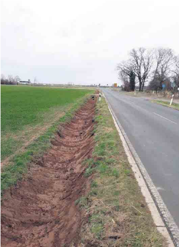
Ein komplett gereinigter Wegeseitengraben auf der Straße Am Wehr bei Lövenich.