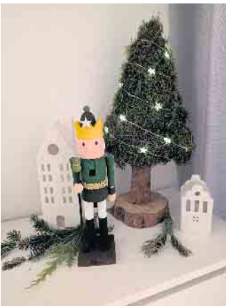
Die selbst kreativ bemalten Nussknacker konnten von jedem Mitglied der Gruppe mit nach Hause genommen werden

im Zülpicher Rosenmontagszug. So wird in der Römerstadt die Gruppe genannt, die seit jeher als letztes vor der Prinzengarde im Zug zu finden ist. In Sachen Kostüm sind sie immer up to date und kreativ - hier kommt natürlich nichts von der Stange. Jedes Outfit ist selbstgenäht