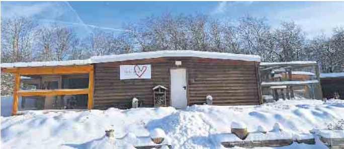
Das Tierheim Kall startete mit großer Unterstützung ins neue Jahr.

Mit großer Dankbarkeit und Zuversicht startet das Team des Tierheims Kall in das neue Jahr. Die überwältigende Unterstützung aus Kall und der Eifel in der Weihnachtszeit hat einmal mehr ge-