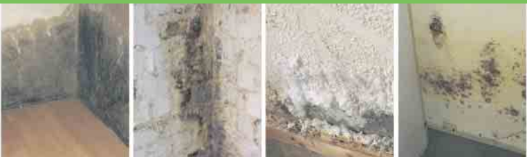
Defekte Horizontalsperre Querdurchfeuchtung Ausblühungen Schimmelbefall