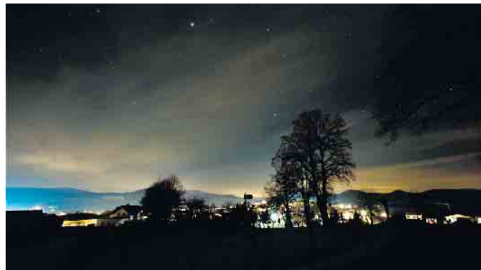
Himmelsleuchten in der Rhön.