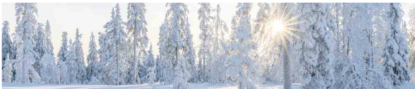
der ehemaligen Prinzen überreicht. Wie bei den Zulpicher Prinzengardisten üblich wurde nach Abarbeitung des offiziellen Programms gemütlich Kameradschaftspflege betrieben. FH