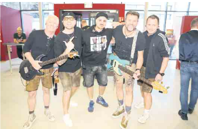
De Boore heizten den Herren im Forum so richtig ein

Karnevalsgesellschaft Treuer Husar Blau-Geld von 1925 e.V. Köln als erstes Highlight. Der Name Herrenkommers mag bei manchem Besucher zunächst für Verwirrung sorgen, handelt es sich doch auf den ersten Blick um eine