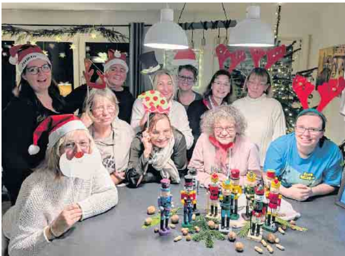
Gemeinsam statt alleine: der „Letzte Rest“ kam in der Weihnachtszeit zusammen