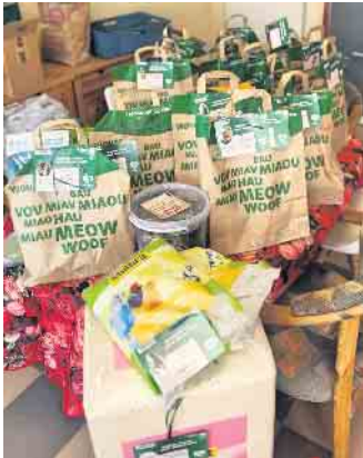
Bei der Fressnapf-Aktion kamen zahlreiche Spenden für die Tiere zusammen.

Jede einzelne Unterstützung kommt direkt den Tieren zugute - im Tierheim ebenso wie auf wenigen, ausgewählten Pflegestellen. Zu diesen zählen auch Menschen, die ganz bewusst ein chronisch krankes oder besonders betreuungsintensives Tier aus dem Tierheim bei sich aufgenommen haben. Dort erhalten diese Tiere eine ergänzende, individuelle Betreuung, die ihre Versorgung im Tierheim sinnvoll ergänzt.