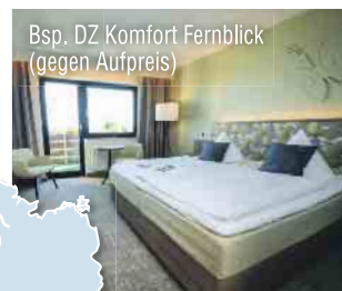
Bsp. DZ Komfort Fernblick (gegen Aufpreis)