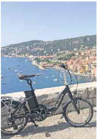
Urlaubsglück mit Ausblick: Auch im Urlaub sorgen die kompakten E-Falträder für viel Bewegungsfreiheit.

Die meisten Menschen in Deutschland wundern sich, wie schnell man doch die vergangenen beiden Jahre vergessen und sich auf eine neue Reisesaison praktisch ohne Einschränkungen freuen kann. Es geht wieder dorthin, wo man die schönsten Wochen des Jahres am liebsten verbringen möchte: an Nord- und Ostsee, in die Alpen, die deutschen Mittelgebirge, an den Gardasee oder an die Küsten im Mittelmeerraum. Ein deutliches Plus an bequemer Mobilität vor Ort gewinnt, wer ein kompaktes E-Faltrad mit an Bord hat und am Urlaubsziel Ausflüge auf zwei Rädern unternehmen kann. Das gilt