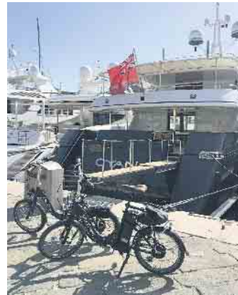
Ein deutliches Plus an bequemer Mobilität vor Ort gewinnt, wer ein kompaktes E-Faltrad am Urlaubsziel nutzen kann.

tativ hochwertig ist und entsprechend schnell und bequem klein gemacht werden kann. (djd)