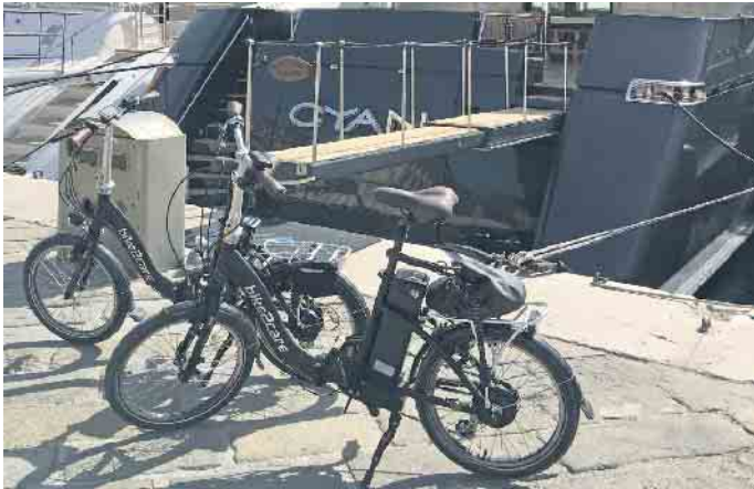
Im Urlaub sind die kompakten E-Falträder ideale Begleiter.

Sommerliche Reisesaison: Kompakte E-Falträder lassen sich überall verstauen