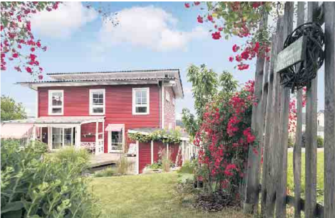
Wohlfühlwohnen gelingt in einem individuell geplanten Holz-Fertighaus sicher.

Kein Fertighaus gleicht dem anderen, denn jedes einzelne wird nach den Wünschen der Baufamilie geplant. Die Gestaltungsmöglichkeiten dabei sind unzählbar: von der Architektur über den Grundriss bis hin zur Ausstattung wird alles individuell ausgesucht und entworfen. „Meist werden Musterhäuser der Hersteller oder gerne auch das Ferienhaus aus dem letzten Traumurlaub am Meer oder in den Bergen als Ideengeber für die Hausplanung herangezogen“, weiß Fabian Tews, Pressesprecher des Bundesverbandes Deutscher Fertigbau (BDF). „So werten Schwedenhäuser, Friesenhäuser, Alpenhäuser oder auch mediterrane Villen in Holz-Fertigbauweise in verschiedensten Regionen ihre Nachbarschaft auf.“ Von der typisch falunroten Fassade aus Holz bis hin zu weißen Sprossenfenstern und einer urgemütlichen Innenausstattung lässt sich das klassische Schwedenhaus heute in moderner und nachhaltiger Holz-Fertigbauweise mit hochgedämmten Wänden und effizienter Haustechnik nachbauen - und zwar überall in Deutschland, wo es der Bebauungsplan zulässt. Gleiches gilt für Friesenhäuser mit Klinkerfassade und drittem Giebel, für Alpenhäuser mit flach geneigtem Satteldach, weiten Dachüberständen und Echtholz-Klappläden an den Fenstern sowie für Fertighaus-Villen nach mediterranem oder gründerzeitlichem Vorbild oder auch im Bauhausstil. „Früher wurde Fertig-