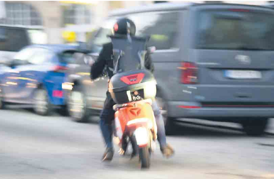
Kurvenfahren sollte man auf den Roller schon können.