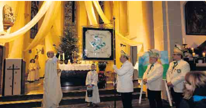
Vor dem Frühschoppen wurde die neu angeschaffte Standarte in einer heiligen Messe geweiht.

Fahnenweihe und karnevalistischer Frühschoppen waren sehr gut besucht