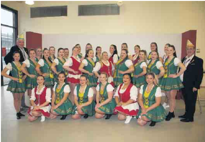
Herrenkommers in Zülpich: Die etwas andere Herrensitzung begeistert im vollbesetzten Forum

manchem Besucher zunächst für Verwirrung sorgen, handelt es sich doch auf den ersten Blick um eine Herrensitzung. Bei genauerer Betrachtung wird deutlich, dass sich die Verantwortlichen Gedanken gemacht haben, um sich von den Konkurrenzangebo-