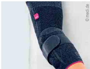
Versorgung von Ellbogen und Schulter