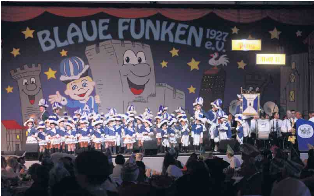
Los ging es mit dem Aufzug der Kindergruppe, die gleich zu Beginn die Bühne füllte

Für ein buntes über vierstündiges Programm hatten die Blaue Funken wieder bestens gesorgt. In der Pause wurde selbstverständlich zur Stärkung der traditionelle „kölsche Imbiss“ serviert.