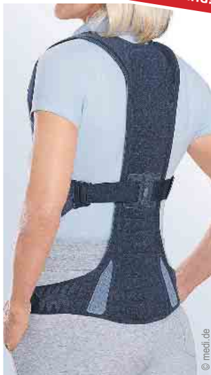
Versorgung des Rumpfs

NEU in Mechernich: Mittwochs bis 18 Uhr geöffnet und jeden 1. & 3. Samstag im Monat von 09-13 Uhr!