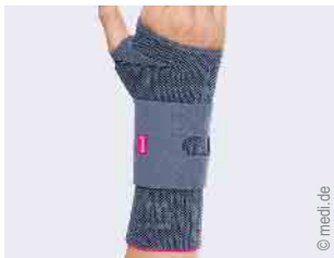
Versorgung der Hand