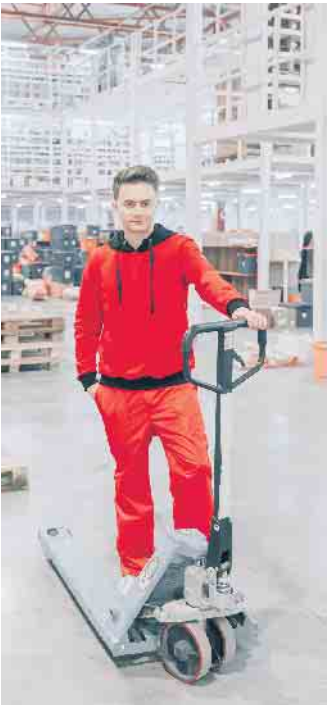
Der Mangel an Fachkräften hat in Deutschland einen neuen Höchststand erreicht.

Unterstützung beim Umstieg Außerdem gibt es gezielte Qualifizierungsmaßnahmen für bestimmte Berufe wie eine Weiterbildung als Berufskraftfahrerin oder -fahrer oder als Fachkraft Lager und Logistik. Über Programme wie „Career Up“, das die Adecco Group in Zusammenarbeit mit Bildungsträgern und der Agentur für Arbeit durchführt, können sich Interessierte schon während der Arbeitssuche weiterqualifizieren. Neben den fachlichen Kenntnissen ist es aber auch wichtig, sich frühzeitig über die eigenen Erwartungen an den neuen Job klar zu werden. Welche Branche passt am besten? Eine kurze Recherche im Internet, Informationsbroschüren oder Erfahrungsberichte helfen bei der Beantwortung dieser Frage. Ausgeschlossen ist ein Quereinstieg nur in einigen Bereichen: Sogenannte geschützte Berufe wie Physiotherapeuten oder Ingenieure können nach wie vor allein mit abgeschlossener Berufsausbildung ausgeübt werden. (djd)