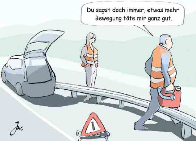
Liegenbleiben ohne Sprit.

resultieren. Hierzu kommt es nahezu zwangsläufig, wenn das liegengebliebene Fahrzeug einen Folgeunfall provozierte, etwa weil es nicht vorschriftsmäßig gesichert wurde. Stellt das Auto mangels Treibstoff seinen Dienst ein und bleibt auf freier Strecke liegen, dann hat der Fahrer die gleichen Maßnahmen zur Absicherung seines Fahrzeugs zu unternehmen wie bei jeder anderen Panne: Das heißt, bei den ersten Anzeichen dafür, dass etwas mit dem Auto nicht stimmt, fährt man mit eingeschaltetem Warnblinker an den rechten Fahrbahnrand, und dann wird die Gefahrenstelle mit einem Warndreieck kenntlich gemacht. Vor dem Verlassen des Fahrzeugs ist dabei eine Warnweste überzuziehen. Ist das Warndreieck vorschriftsgemäß platziert, bringt man sich möglichst zügig hinter der Leitplanke in Sicherheit, so eine solche am Ort des Geschehens vorhanden ist. Von dort aus kann man dann Hilfe rufen. Im Bußgeldkatalog sind Geldbußen von 30 bis 75 Euro vorgesehen für nicht vorschriftsmäßig abgesicherte Pannenfahrzeuge. Werden dabei andere Verkehrsteilnehmer gefährdet oder es kommt sogar zu einem Unfall, der mangelhafter Sicherung des liegengebliebenen Autos geschuldet ist, droht zudem ein Punkt in Flensburg. Dies gilt auch für „trocken gefahrene“ Fahrzeuge. (ampnet/fw)