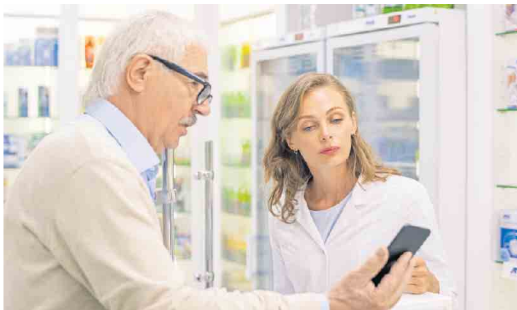
In der Apotheke können gesetzlich Versicherte Rezepte schnell und einfach via App einlösen.

Versicherte finden die aktuelle E-Rezept-App in den App-Stores von Apple und Google. Um diese nutzen zu können, müssen sie sich in der App anmelden. Hierfür benötigen Versicherte neben einem NFC-fähigen Smartphone eine