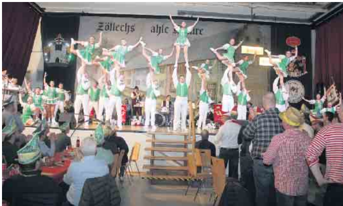
Die Tanzgruppe „Zunft-Müüs“ der KKG Fidele Zunftbrüder von 1919 e.V.