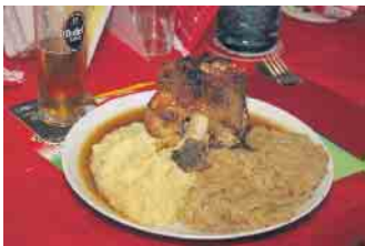
Das traditionelle Haxenessen durfte nicht fehlen. In diesem Jahr kam es von der Traditionsgaststätte Op d'r Kinat

wie in jedem Jahr wieder hervorragend gewesen und ich bin zuversichtlich, dass wir mit unserem Her-