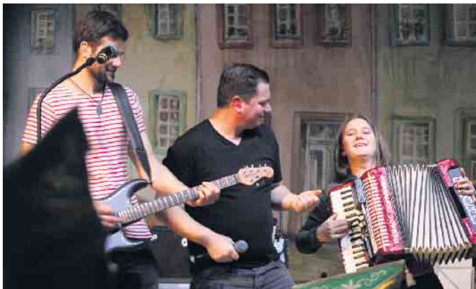
Kaschämm brachte zum Schluss die Bühne des Forums sprichwörtlich zum Brennen