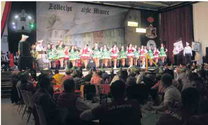
Direkt zu Beginn des Herrenkommers bot sich Besuchern auf der Bühne ein buntes Bild