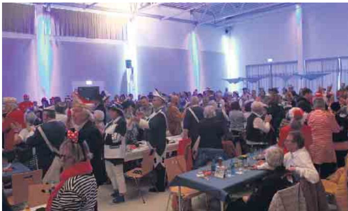
Restlos besetzt war das Forum zum 23. Miljöh-Fest der Blauen Funken