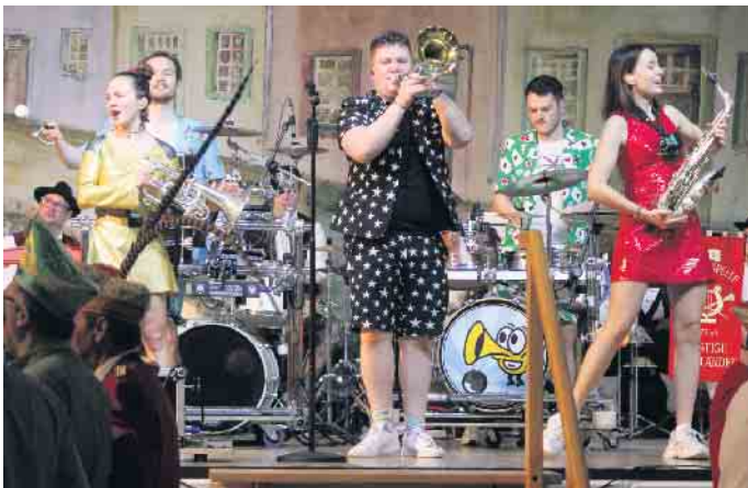
Druckluft heizte den Herren so richtig ein