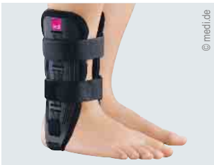
Versorgung des oberen Sprunggelenks