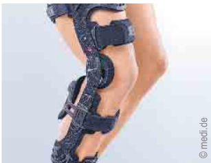
Versorgung des Kniegelenks