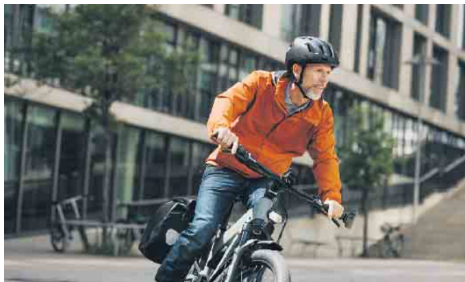
Umweltfreundlich mobil bei jedem Wetter: Viele nutzen ihr Zweirad ganzjährig.

Falsches Wetter gibt es nicht - lediglich falsche Kleidung. Diese geflügelten Worte haben beim Radfahren in Herbst und Winter besondere Bedeutung. Empfehlenswert ist stets das bewährte Zwiebelprinzip: Mehrere Schichten übereinander tragen, dabei möglichst zu atmungsaktiver und wasserdichter Kleidung greifen. Als unterste Lage ist schnell trocknende Funktionskleidung die passende Wahl, während die oberen Schichten vor Wind und Nässe schützen sollen. Helle Farben und Reflektoren sorgen dafür, gut gesehen zu werden. Bei frostiger Kälte schützen zusätzlich eine Sturmhaube unter dem Helm sowie Handschuhe.