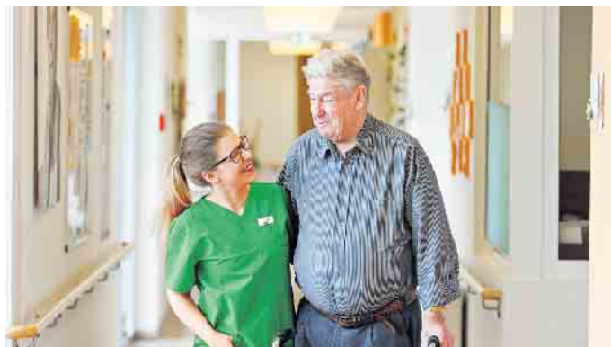
Altenpflege ist ein Beruf mit viel zwischenmenschlichem Kontakt, der sich auch familienfreundlich gestalten lässt.

denz. Sie verbringt weiterhin viel Zeit auf der Station, um den Kontakt zu den Senioren zu halten, während sie gleichzeitig die familiäre Atmosphäre fördert, die sie einst in die Pflege brachte. Denn letztlich entscheidend für die Berufswahl war für sie der Kontakt mit den Seniorinnen und Senioren. „Wichtig und extrem motivierend ist für mich der ständige Austausch mit den Bewohnern. Viele sind wegen ihrer Lebenserfahrung ein Vorbild für mich und geben mir täglich sehr viel.“ (DJD)