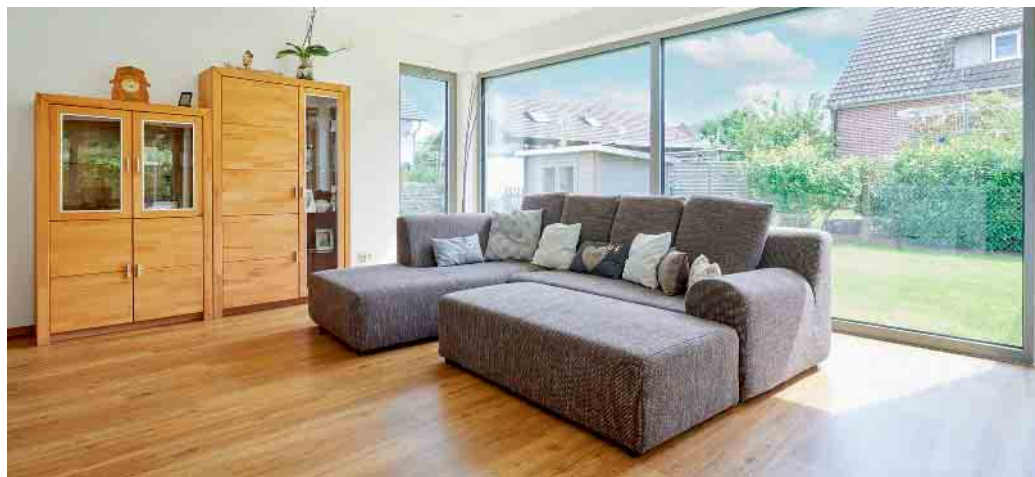
Aluminiumfenster sind bei großformatigen Panoramafenstern besonders beliebt.

Aluminiumrahmen werden wegen ihrer guten Statik sowie des robusten und doch leichten Materials besonders für große, moderne Fensterfronten gerne genutzt. Darüber hinaus sind sie sehr wartungsfreundlich. Dass Aluminiumfenster wegen ihres Materials besonders lange Wind und Wetter trotzen und in einer Vielzahl von Farben beschichtet und lackiert