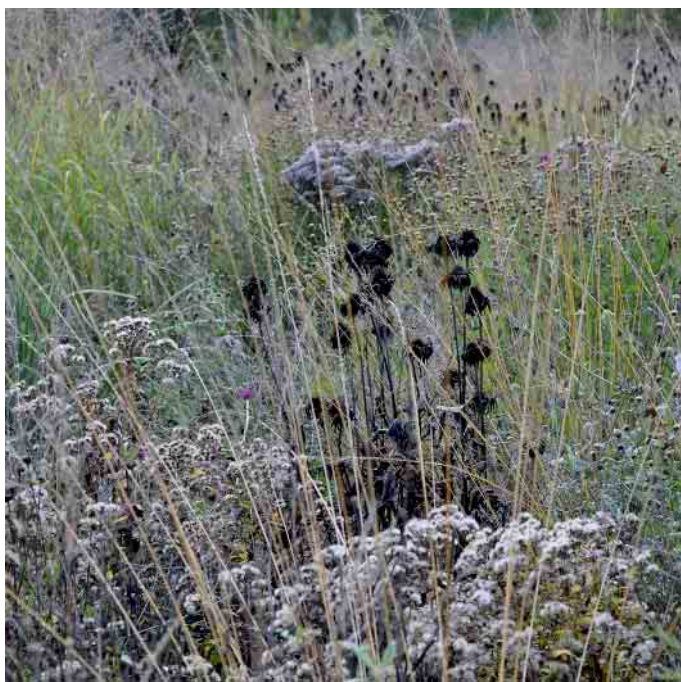
Spätsommer- und Herbstblüher für Nützlinge und Vögel stehen lassen.

Der Tipp, Stauden, Ziergehölze oder Gräser im Herbst abzuschneiden, ist mittlerweile veraltet: Vor allem die Spätsommer- und