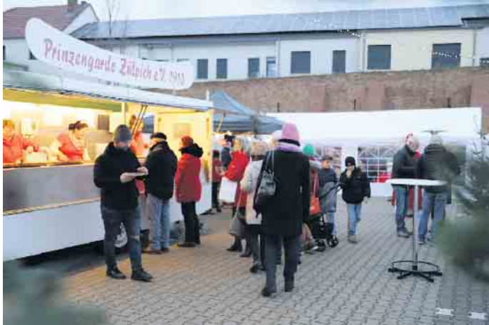
Unter dem Motto „Advent en rut un wiess“ lud die Prinzengarde zu einem ganz besonderen Weihnachtsmarkt ein

zember nicht mehr wiedererkennen. Viele Stände mit lokaler Handwerkskunst sowie die Tannenbäume tauchten das Gelände in einen besonderen Charme mit dem Lichterglanz. Für das leibliche Wohl sorgten die traditionellen Reibekuchen nach Hausfrauenart sowie andere Köstlichkeiten. Ebenso gab es Glühwein und andere kalte und warme Getränke. Die Kinder schmückten den Weihnachtsbaum. Im Glanz von Lichtern