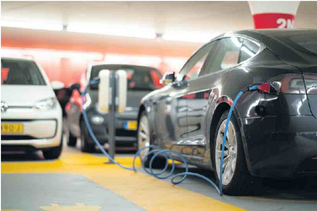
Elektro-Kraftfahrzeuge benötigen mehr Kupfer als Autos mit Verbrennungsmotoren.

Elektrofahrzeuge benötigen deutlich mehr Kupfer als Verbrenner Für den kumulierten Energieaufwand über ein ganzes Autoleben hinweg ist das positiv, denn Elektromotoren verbrauchen für das Fahren weniger Energie als herkömmliche Verbrenner. Dem steht allerdings ein höherer Rohstoffbedarf insbesondere bei der Batterie- und Motortechnik gegenüber. Ein Schlüsselmateriale für die E-Mobilitisierung ist Kupfer. Ein Elektrofahrzeug enthält davon rund dreimal so viel wie ein benzin- oder dieselmotriebenes Kfz. Damit steigt der Bedarf von heute um die 25 Kilogramm für ein Mittelklassefahrzeug auf bis zu 70 Kilogramm. Beispielsweise unter www.kupfer.de/elektromobilitaet gibt es dazu mehr Wissenswertes und Hintergrundinfos. Allein ein Lithium-Ionen-Akku besteht zu rund 18 Prozent aus Kupfer, hinzu kommen die Wicklungen in den Elektromotoren, das Hochvolt-