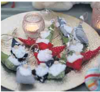
Beliebt wie eh und je: die kleinen Wichtel