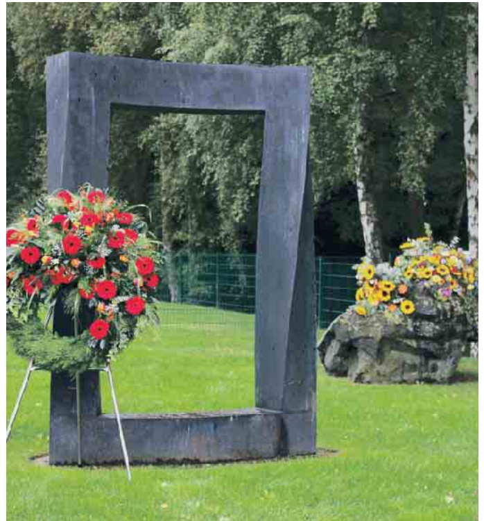
Tor zwischen den Welten.

mäßig ein Grab zu besuchen. Wenn das nicht möglich ist, hilft es vielleicht, zum Gedenken eine Kerze anzuzünden oder an einen vertrauten Ort zu gehen.