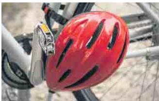
Das Tragen eines Fahrradhelms bietet Radlern den bestmöglichen Schutz.

Fast jeder zweite Fahrradfahrer in Deutschland achtet auf die persönliche Sicherheit und trägt immer (36 Prozent) oder meistens (13 Prozent) einen Helm. Heißt aber auch: Rund die Hälfte der Radfahrer trägt nie (39 Prozent) oder nur selten (zwölf Prozent) einen Fahrradhelm. Dabei ist bei einem Viertel aller Fahrradunfälle der Kopf betroffen. Fachleute empfehlen ausdrücklich das Tragen eines Helms.