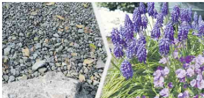
Wo einst Schotter war, blüht es nun. Dies ist das Ziel des neuen LEADER-Projekts.

Mit einem Beratungsangebot zum Umbau von verschotterten und versiegelten Gärten möchte der Kreis Düren gemeinsam mit den LEADER-Regionen Zülpicher Börde und Eifel die Entstehung von naturnahen, ökologisch wertvollen Flächen unterstützen. GartenbesitzerInnen können die kostenlose Beratung eines Dienstleisters durch einen entsprechenden Antrag über die Website des Kreises Düren in Anspruch nehmen. Der Dienstleister berät dabei vor Ort im eigenen Garten, sodass auch individuelle Gegebenheiten berücksichtigt werden können. Ziel der Fachberatung ist die Erarbeitung eines Pflanzplans für die Realisierung des neuen Gartens. Die letzten Sommer haben gezeigt, dass Extremwetterlagen punktuell zu Starkregen führen können. Versiegelte Fläche erlauben dabei keinen Abfluss des Wassers in die Fläche, sodass es vermehrt zu oberflächlichem Ablauf des Wassers