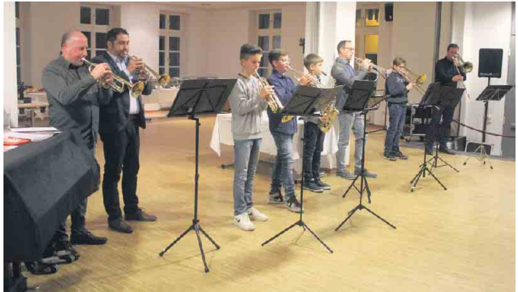
Das vereinseigene Fanfarencorps konnte mit weihnachtlichen Klängen überzeugen

Ein großes Dankeschön an alle Helferinnen und Helfer der Offiziersgruppe der Prinzengarde für die Unterstützung beim Kellnern und hinter der Theke, den Damen des Vereins für die Dessertspenden und besonders an die Familie Schmitz-Hoscheid, die