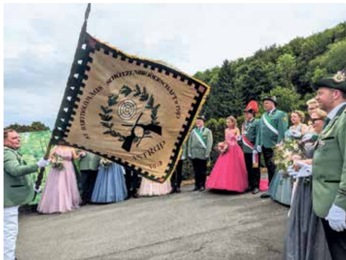
Zu Ehren der Majestäten wird die prachtvolle Schützenfahne geschwenkt.