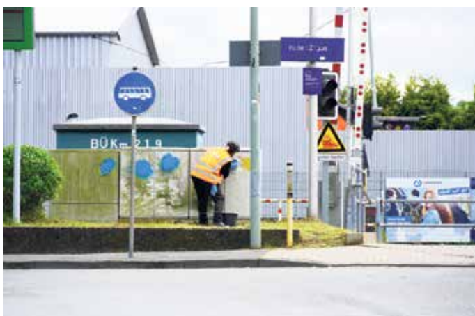
Die Sonderreinigungsaktion erfolgte auf dem gesamten Bahnhofsgelände.

und bepflanzte die Beete vor dem Bahnhofgebäude. Durch diese Gemeinschaftsaktion setzten alle Beteiligten ein sichtbares Zeichen für das gemeinsame Ziel, ein sauberes und attraktives Erscheinungsbild des gesamten Bahnhofgeländes zu schaffen. "Wir werden auch künftig aufmerksam hinschauen und gemeinsam mit der Deutschen Bahn daran arbeiten, dass der Bahnhof ein gepflegtes Aushängeschild unserer Stadt bleibt", so der Wunsch aller Beteiligten.