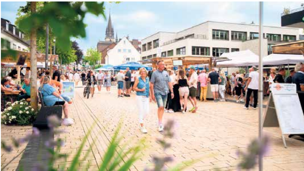
Weine, Kulinarik und Livemusik, dazu ein verkaufsoffener Sonntag, sorgen auch in diesem Jahr für viele Genussmomente in Bad Driburgs Innenstadt.