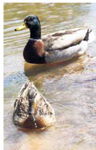
Es entsteht mehr natürlicher Lebensraum- ein Gewinn für Natur, Umwelt und Bevölkerung.

Erdbau Hake aus Beverungen, die Planung und Bauleitung liegt beim Ingenieurbüro IWUD aus Höxter. Bei geeigneter Witterung sollen die Arbeiten innerhalb von etwa vier Wochen abgeschlossen sein. Während der Bauzeit kann es im Bereich der Straße "Am Wehmekamp" zu Verkehrsbehinderungen kommen. Die Stadt Brakel bittet alle Verkehrsteilnehmenden und Anlieger/innen um Verständnis für diese vorübergehenden Einschränkungen. Renaturierungsmaßnahmen verbessern die Wasserqualität, fördern die Artenvielfalt und dienen dem Hochwasserschutz. Sie machen die Landschaft widerstandsfähiger gegenüber den Folgen des Klimawandels - ein Gewinn für Natur, Umwelt und die Bevölkerung.