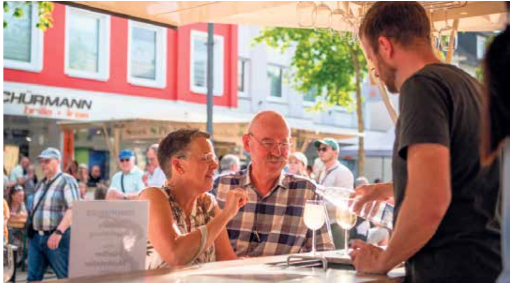
Auf dem 3. Bad Driburger Winzerfest präsentieren ein Dutzend Winzer aus verschiedenen Anbau- regionen Deutschlands ihre erlesenen Weine.

Wenn vom 12. bis 14. Juni 2026 der Duft von kulinarischen Spezialitäten und das Klingen von Weingläsern die Luft erfüllt, verwandelt sich Bad Driburgs Fußgängerzone in eine lebendige Genussmeile. Die Bad Driburger Touristik GmbH und der Werbering