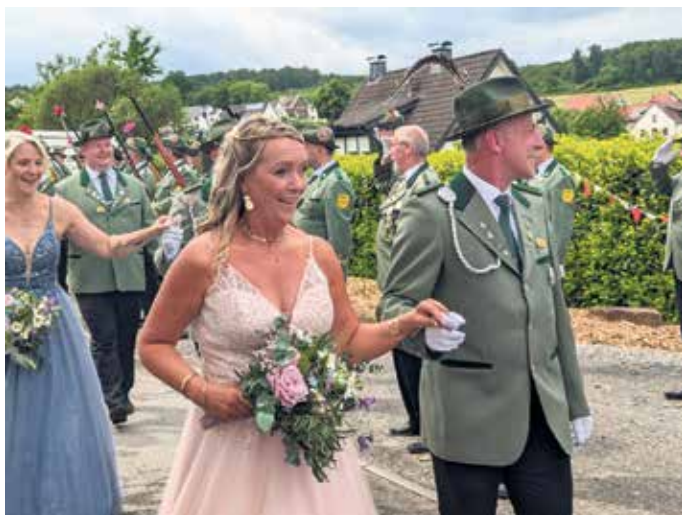
Ein eleganter Hofstaat begleitet das Königspaar.

Die Schützenfahne der Schützenbruderschaft zeichnet sich durch ihre aufwendigen Stickereien und die hochwertige Verarbeitung aus. Sie machen die Fahne zu einem einzigartigen Stück, dessen Qualität heute so kaum noch zu finden ist.