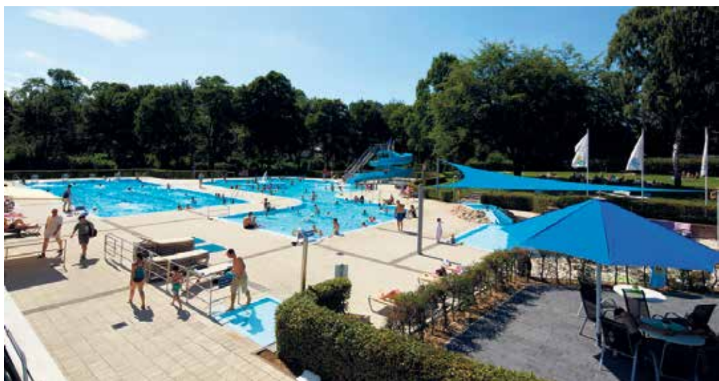
Am 18. Mai ist das Sommer-Bad in die Saison gestartet und bietet bei konstanten 27 Grad Wassertemperatur Badespaß für Groß und Klein.

in diesem Jahr wird es wieder eine Rabattaktion vor den Sommerferien (5. bis 19. Juli 2026) geben. Alle Informationen dazu folgen in Kürze - alle Details rund um das Brakeler Sommer-Bad sind auf der Homepage www.brakel.de/sommerbad zu finden.