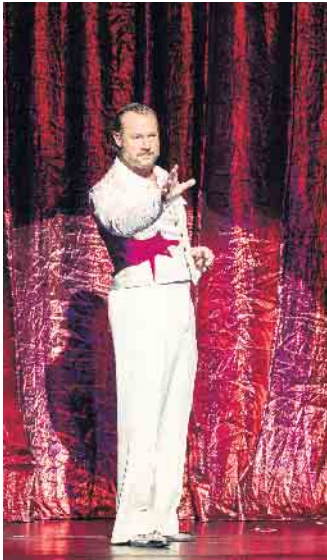
Szene aus „Nessun Dorma“ (Oper Bonn)

Wir haben etwas für Sie! Die Geschenk-Abos der Theatergemeinde BONN sind ab sofort erhältlich.