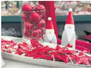
Ein Traum in Rot: Kugeln, Figuren, Sterne und viele andere attraktive Artikel verzaubern das weihnachtliche Wohnzimmer und die festliche Tafel.

Wer noch etwas Schönes und Außergewöhnliches sucht, ist bei der GartenBaumschule Fuhs in Gielsdorf genau richtig - Die Weihnachtsausstellung mit Tannenbaumverkauf ist ab sofort geöffnet