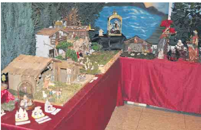
Die Organisatoren freuen sich, auch in diesem Jahr wieder vielfältige Exponate präsentieren zu können.

Einstimmung auf Weihnachten auch ohne Kitsch und Rummel - das bietet die 33. Krippenausstellung der Heimatfreunde Roisdorf am 3. Adventswochenende (Öffnungszeiten: Samstag, 13. Dezember, 13:30 bis 17:30 Uhr und Sonntag, 14. Dezember, 10:30 bis 17:30 Uhr) im Pfarrheim Sankt Clara (Heilgersstraße 21) bei freiem Eintritt. Ein Besuch lohnt sich unbedingt. (WDK)