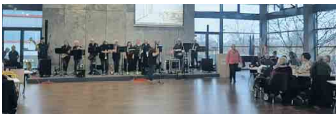
Band: Antitakt.

Bornheim - Ein voller Erfolg war der diesjährige Ü-60-Tag im Bornheimer Rathaus, zu dem der Seniorenbeirat eingeladen hatte. Über 400 Gäste folgten der Einladung und erlebten einen abwechslungsreichen Tag voller Musik, Bewegung, Information und Begegnung.