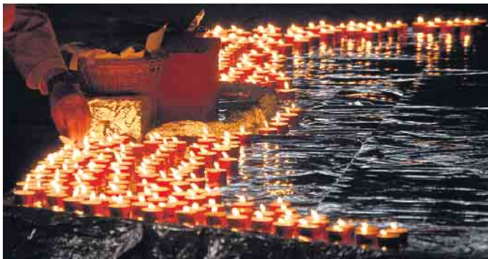
Zahlreiche Kerzen brennen - für die Anliegen der Gläubigen