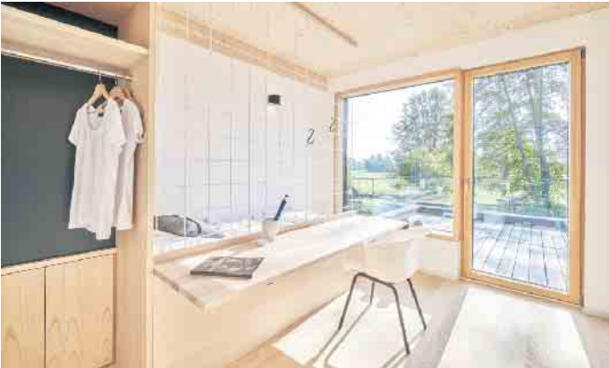
Offene Grundrisse und viel Tageslicht lassen auch kleine Wohnflächen großzügig wirken - funktional geplant entsteht hoher Komfort auf kompaktem Raum.

und in Zukunft leben wollen; wo sie sich begegnen, aber auch mal zurückziehen können.“ Ästhetik, Komfort und Lebensqualität Auf kleiner Fläche lässt sich hoher Wohnkomfort und ansprechendes Design verwirklichen. Mit modernen Fensterlösungen und hochwertigen Materialien stehen