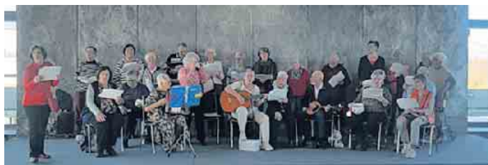
Chor des Seniorenbeirats

Bitte Bewerbung per E-Mail an: TEAM HR | karriere@rautenberg.media Stichwort: REGIO PRESSEVERTRIEB GmbH