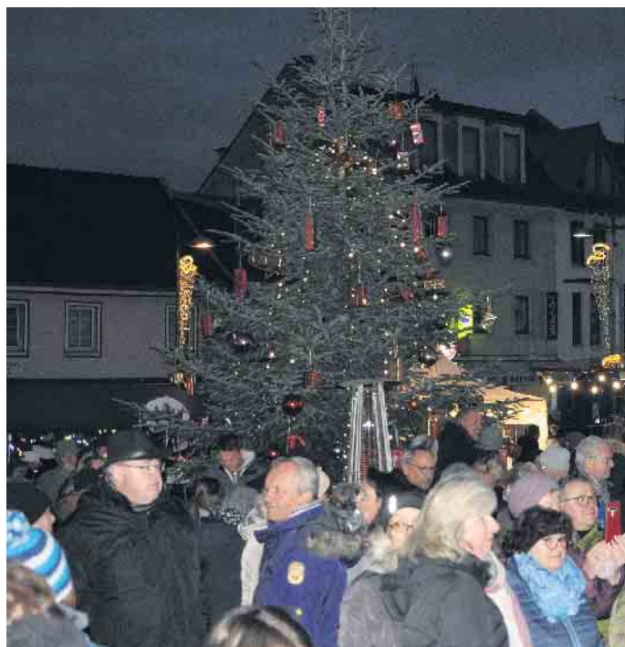
Der Christbaum auf dem Peter-Fryns-Platz ist ein sichtbares Symbol des Weihnachtsgeschehens in Bornheim.