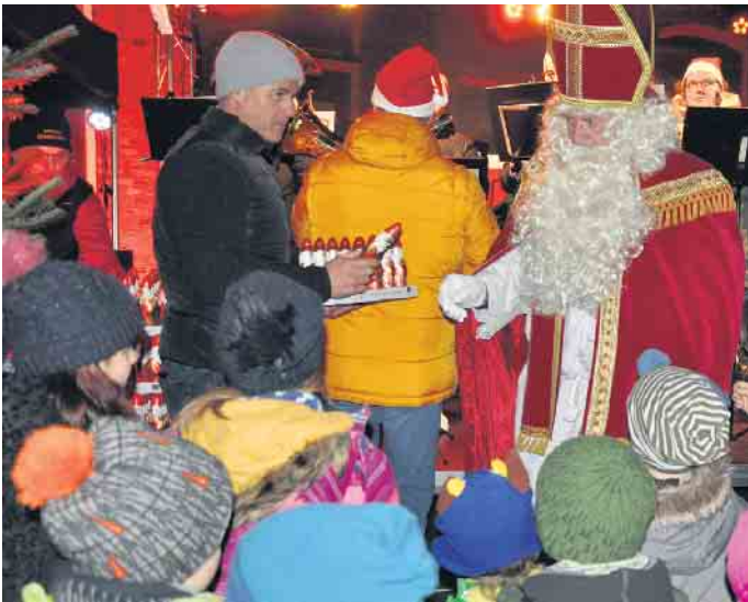
Für die Kinder ist der Besuch des Nikolaus auf dem Peter-Fryns-Platz ein unvergessliches Ereignis.

re interessante und lohnenswerte Einkaufsmöglichkeiten. Besonders sind auch die vielen Handwerker und Dienstleister im gesamten Stadtgebiet zu erwähnen. Der medizinische, zahnmedizinische und pflegerische Bereich zählt ebenfalls zu den Stärken Bornheims. Und die zahlreichen vorweihnachtlichen Konzerte und weiteren kulturellen Angeboten lassen kaum Wünsche offen. Genießer sind in Bornheim richtig Zu jedem gelungenen Fest gehören ein schmackhaftes Essen und gepflegte Getränke. Hier punktet Bornheim vor allem mit seinem überzeugenden Angebot regionaler Spezialitäten und frischer Produkte, gern auch in Bio-Qualität. Der Einkauf kann direkt in einem der zahlreichen über das gesamte Stadtgebiet verstreuten Hofläden erfolgen oder bei den gehobenen Vollsortimentern. Dazu kommen kleinere Spezialanbieter, deren Besuch sich ebenfalls lohnt. Beste Erreichbarkeit Gerade diese Vielfalt kennzeichnet Bornheim und macht die Stadt sowie ihre Ortsteile so attraktiv für alle, die das Besondere suchen. Beim öffentlichen Personennahverkehr ist Bornheim gut angebunden. Wer mit dem Auto an-