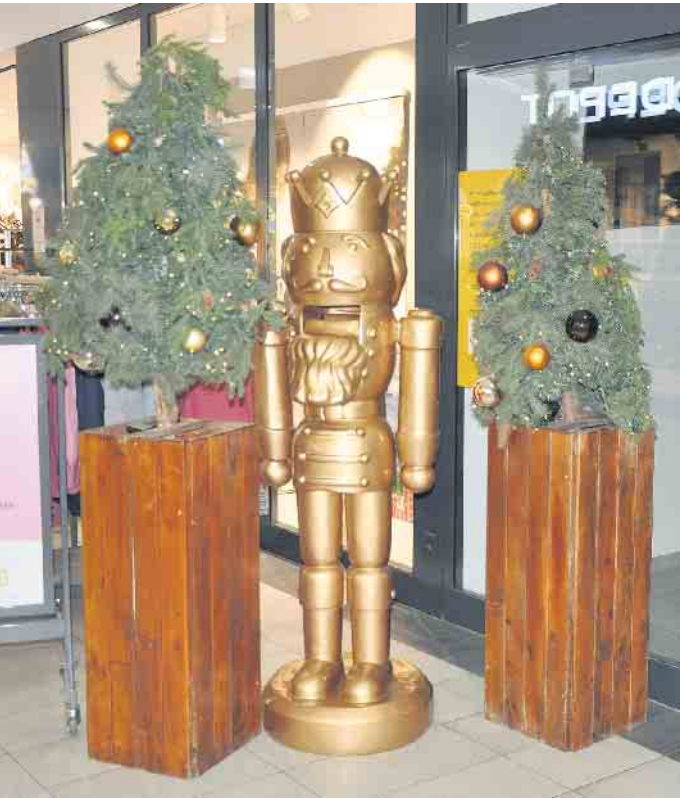
Weihnachtliche Figuren erfreuen die Besucher des SUTI Centers.

reist, findet ausreichend Parkplätze. Deshalb kommen viele Besucher aus den Nachbargemeinden, aber auch aus Bonn und Köln gern in dieses Zentrum des Vorgebirges und genießen dort entspannt die Adventszeit. „Hier ist der Kunde König“ - dieses Motto trifft in Bornheim den Nagel auf den Kopf. Kommen Sie und überzeugen Sie sich selbst. Sie werden nicht enttäuscht sein. (WDK)