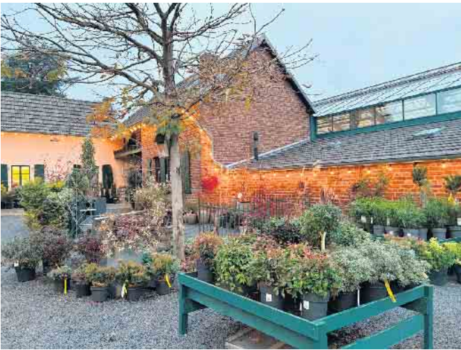
Der stimmungsvoll beleuchtete Eingang lädt zum Besuch der großen Weihnachtsausstellung der GartenBaumschule Fuhs ein.

Wer noch etwas Schönes und Außergewöhnliches sucht, ist bei der GartenBaumschule Fuhs in Gielsdorf genau richtig - Die Weihnachtsausstellung mit Tannenbaumverkauf ist ab sofort geöffnet