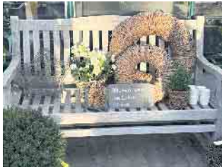
„Blumen sind das Lächeln der Erde“ - das trifft besonders auch für die Adventszeit, die Weihnachtsfeiertage und den Jahreswechsel zu.

frohe und besinnliche Feiertage. „Kommen Sie vorbei und genießen Sie die einmalige Atmosphäre und die tollen Angebote unseres Weihnachtsmarktes.“ (WDK)