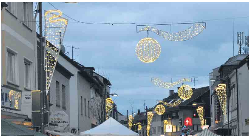
Die Weihnachtsbeleuchtung des Bornheimer Gewerbevereins lässt die Königstraße während der gesamten Adventszeit in festlichem Glanz erstrahlen.

Mannigfaltige und überraschende Angebote und Dienstleistungen warten auf Kunden - Käufer und Gäste erleben Vielfalt und Qualität direkt vor Ort