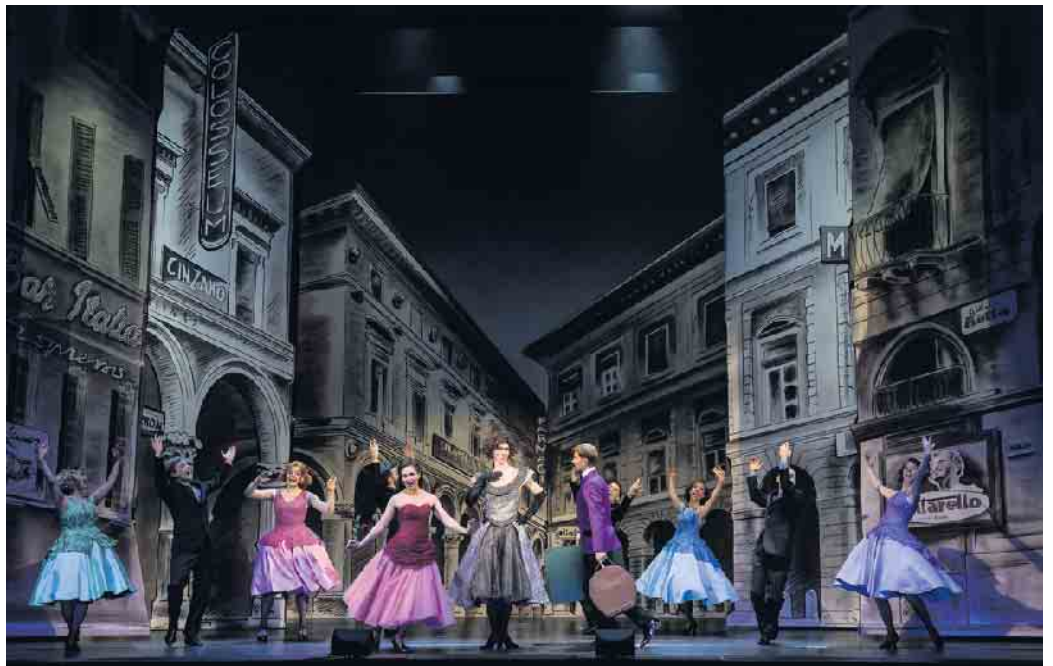
Szene aus „Tootsie“ (Oper Bonn)

Wir wünschen viel Freude beim Aussuchen Ihres „Lieblingsprogramms“.