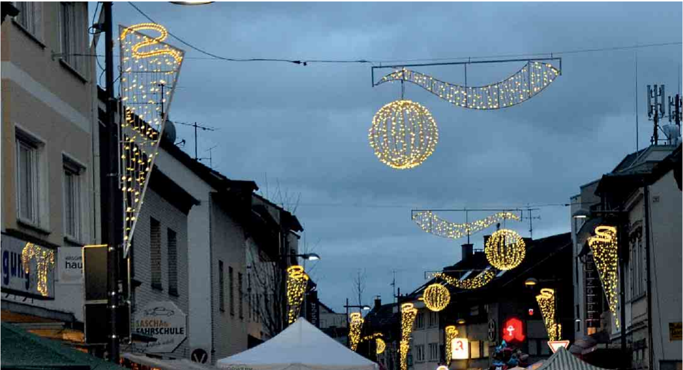
Die faszinierende Weihnachtsbeleuchtung des Gewerbevereins wird nach dem Dunkelwerden wieder der Königstraße weihnachtlichen Glanz verleihen.

ren, Unternehmern und Bürgern kommen der „Stiftung Theodor Strauf und Eberhard Pies“ zugute. Wer diese Charity-Aktion durch eine Spende unterstützen möchte, kann dieses über folgendes Konto tun: Volksbank Bonn Rhein-Sieg, IBAN: DE26 3806 0186 0817 2610, Verwendungszweck: „Spende Bornheimer Advents Charity Vol. 3“. „Schließlich geht es in der Adventszeit ja nicht nur um Ge-