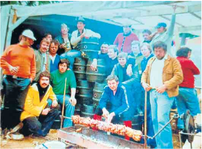
Gut versorgt für den Nürburgring, Mitte 1970er Jahre