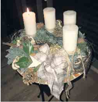
Der Walberberger Kirchenchor singt zum 1. Advent.