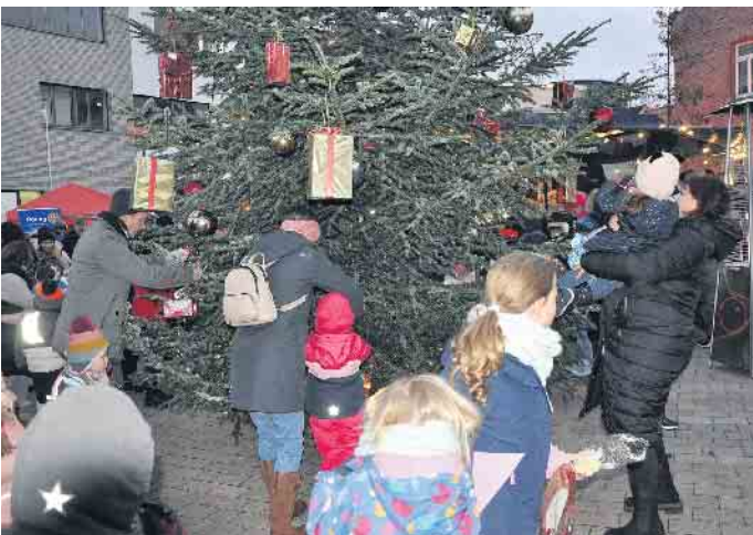
Mit großer Begeisterung wird Jahr für Jahr der Weihnachtsbaum geschmückt.