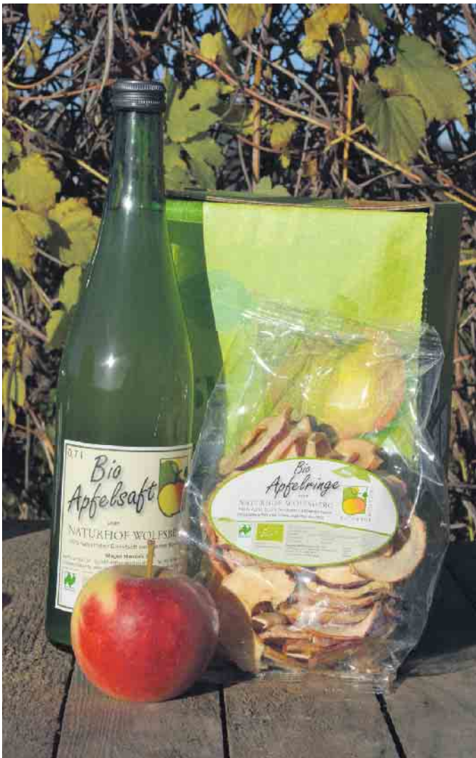
Der hofeigene Bio-Apfelsaft - heiß getrunken ein absolutes Muss in der Winterzeit. Und ein paar schmackhafte Bio-Apfelringe vollenden ein tolles Geschmackerlebnis.