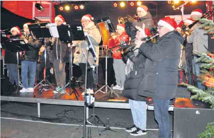
Weihnachtliche Musik begeistert die Gäste der Advents Charity stets aufs Neue.

wunderbare Gelegenheit, die besinnliche Atmosphäre der Vorweihnachtszeit in lockerer Partystimmung zu genießen und sich zugleich für einen guten Zweck zu engagieren. Mit einem bunten Programm aus festlichen Ständen