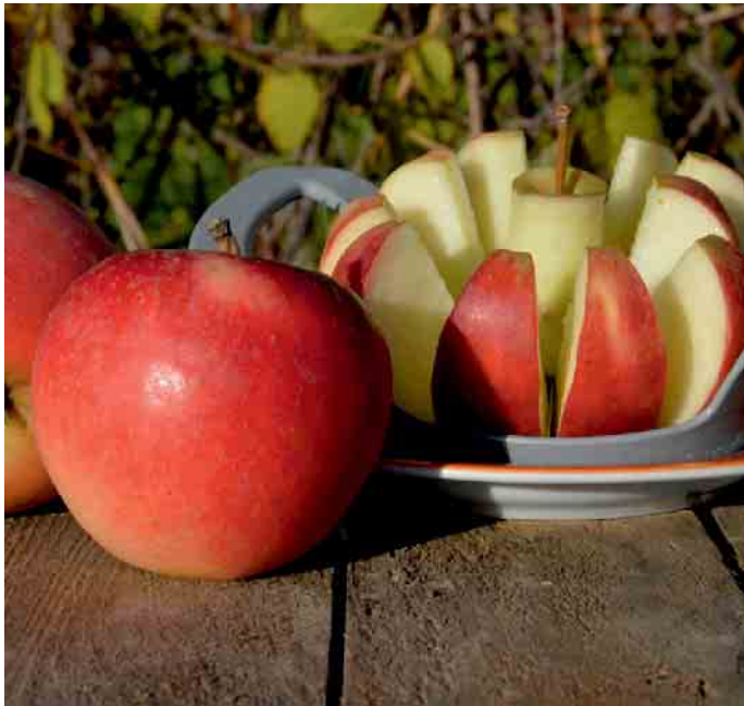
Wem läuft nicht das Wasser im Munde zusammen, wenn ihn diese prächtigen Äpfel des Naturhofs Wolfsberg anlachen.

ren. Und ich bin sicher, dass wir diesbezüglich eine gelungene Mischung getroffen haben. Am besten überzeugen Sie sich persönlich davon, indem Sie uns an einem der Aktionstage besuchen. Und nutzen Sie die Einkaufsmöglichkeiten im Hofladen. Wir freuen uns auf Sie.“ Weitere Informationen zum Adventsmarkt, dem ökologischen Obstbaubetrieb Naturhof Wolfsberg und seinem Hofladen: www.naturhof-wolfsberg.de (WDK)