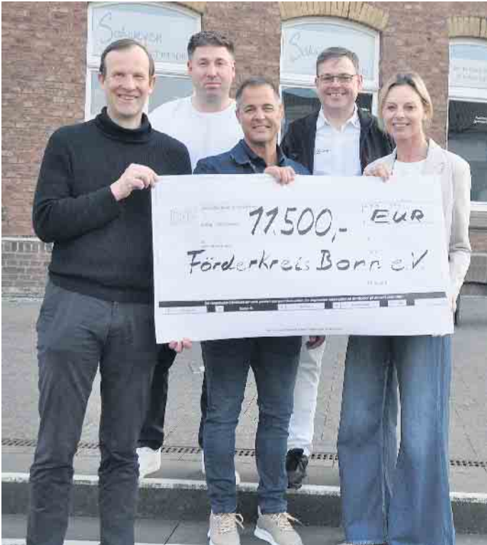
Das jetzige Orga-Team hofft wie in den vergangenen Jahren wieder auf einen hohen Spendenerlös für den guten Zweck. Im Bild: 2024 konnte das damalige Team 11.500 Euro an die Bonner Kinderkrebshilfe übergeben.