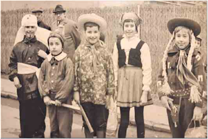
Gäste aus aller Welt beim Roisdorfer Wierfastelovendzoch, 1964