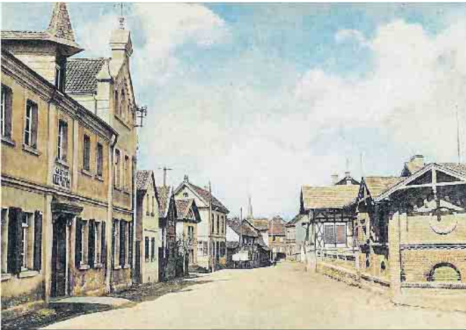
Blick in die „Roisdebe Buënjass“ (Brunnenstraße), 1920er Jahre

Die Heimatfreunde bieten ihren neuen Kalender „Roisdorf, wie es war“ 2026 an