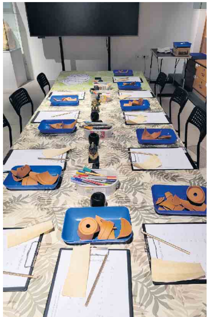
Seminarraum im Museum