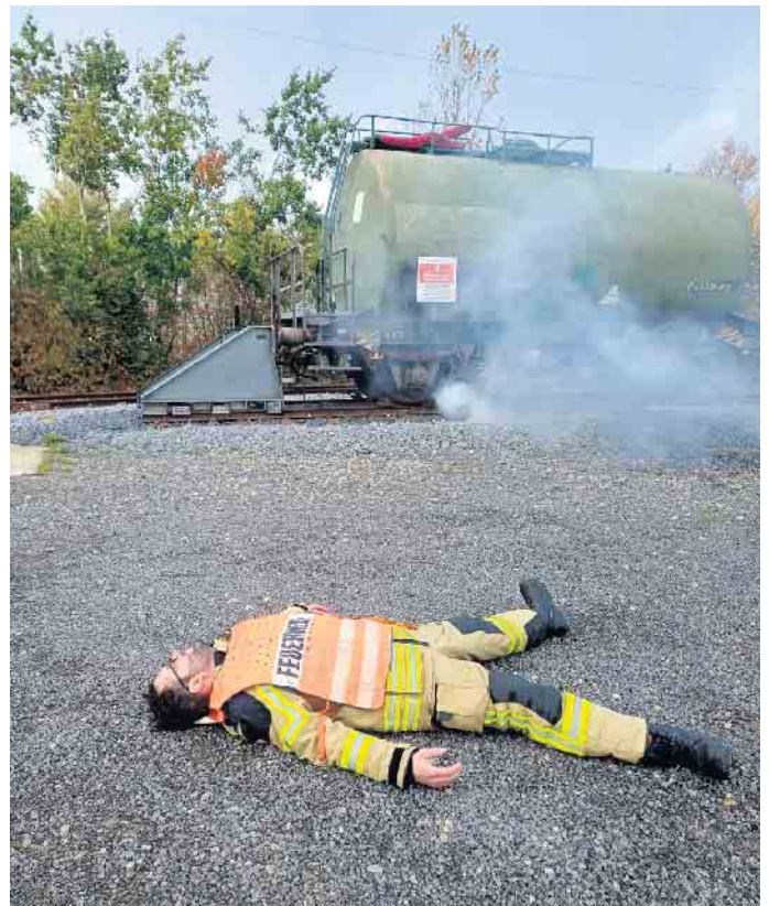
Mal Darsteller, mal Einsatzkraft: Die Rollen der Feuerwehrleute wechselten bei diesem Übungstg.