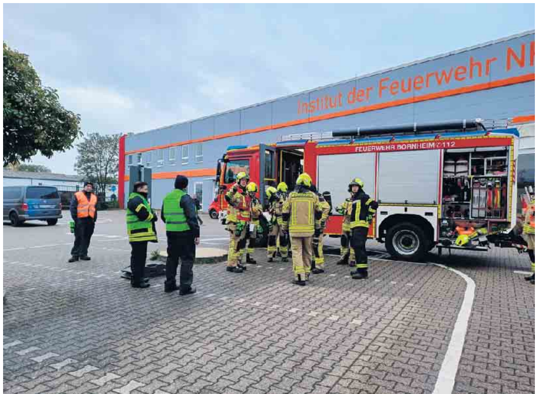
Am Institut der Feuerwehr in Düren übten die Feuerwehrleute verschiedene Übungsszenarien.

Eine Erkenntnis war unter anderem, wie wichtig die gründliche Erkundung am Anfang eines Einsatzes ist. Während die Einsatz-