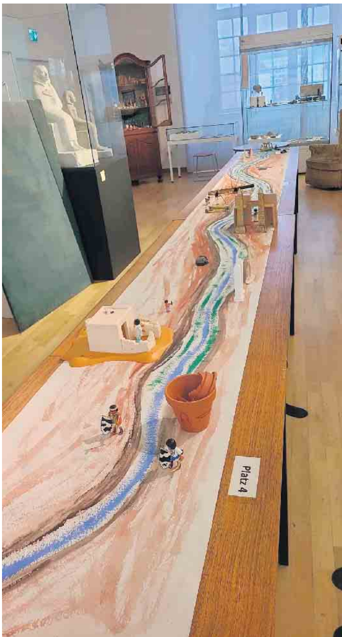
Stilisierte Verlauf des Nils

Das Museum ist barrierefrei. Hinweisen möchten wir noch auf das Angebot „Geburts-tag im Ägyptischen Museum“. Es steht ein dekorierte Raum für eine kleine Feier und Platz für ein mitzubringendes Büfett zur Verfügung. Ebenso gibt es einen spannenden Bastelnachmittag im Ägyptischen Museum.