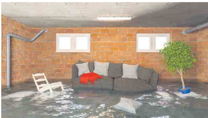
Zu Überschwemmungen im Keller soll es gar nicht erst kommen.

Wie sich Grundstückseigentümer:innen rechtlich und technisch gut absichern, vermitteln kostenlose Seminare „Schutz vor Starkregen“. Termine unter www.klimakoffer.nrw/veranstaltungen Verbraucherzentrale NRW