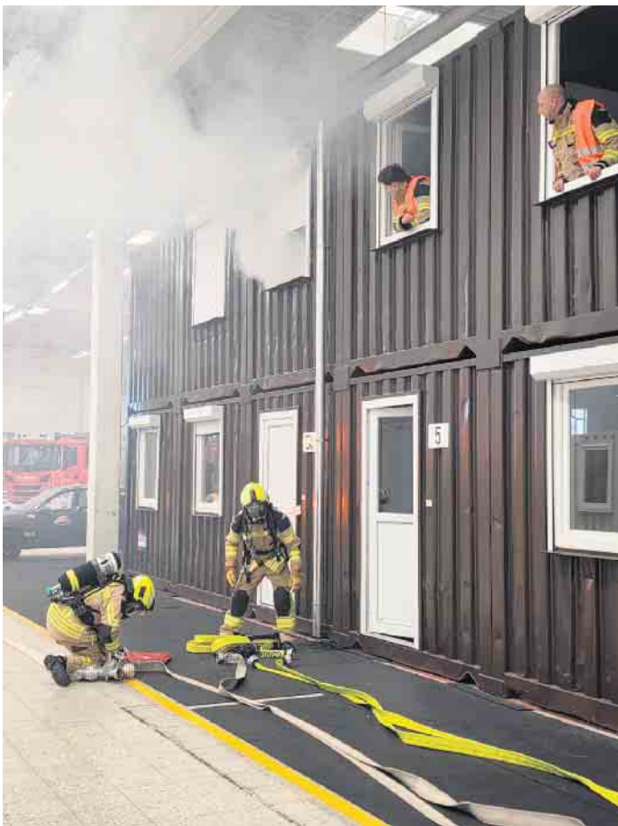
Gebäudebrand mit Menschenleben in Gefahr: Hier müssen alle Handgriffe sitzen.

Weiter ging es mit einem ausgetretenem Gefahrstoff an einem Kesselwagen der Bahn, sowie einer zu rettenden Person, die einen Stromschlag erlitten hatte. Wichtig war hier das Vorgehen nach „GAMS-Regel“ in solchen sogenannten ABC-Einsätzen: Gefahr erkennen, absperren, Menschen retten, sowie Spezialkräfte alarmieren. Mit einem Verkehrsunfall und einem weiteren brennenden Gebäude, aus dem Menschen gerettet werden mussten, ging es durch den Nachmittag. Die Rollen zwischen Einsatzkraft und Darsteller haben dabei immer wieder ge-