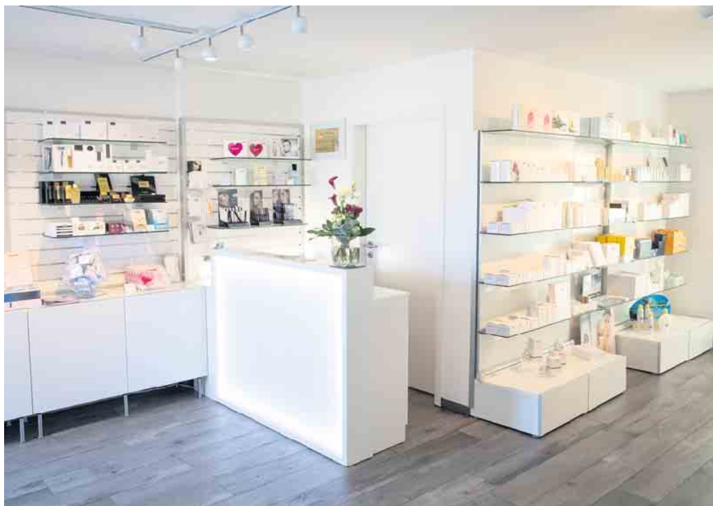
Die freundlichen Räumlichkeiten schaffen eine ganz besondere Wohlfühlatmosphäre im Cosmetic-Institut BB.