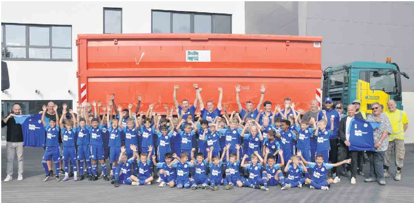
Große Freude bei den jungen Spielern, ihren Betreuern und den Repräsentanten des Sponsors Hünten bei der Übergabe der 100 Trikotsätze.

SSV Bornheim erhielt Spende - Sieben Jugendmannschaften wurden ausgestattet