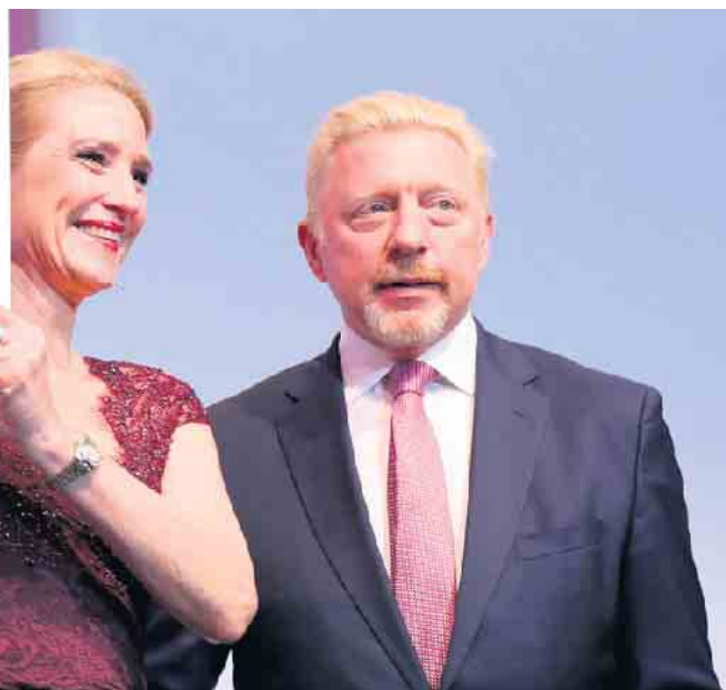
Krönung eines erfolgreichen Geschäftslebens: Birgit Ruland mit Tennislegende Boris Becker bei der Verleihung des „Gloria Kosmetikpreises“