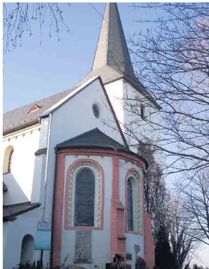
St. Walburga in Walberberg.

Chor wird unterstützt von einem Orchester sowie Solistinnen der Musikhochschule Köln. Die Gesamtleitung liegt bei Jan Maasmann. Wer sich also musikalisch in den Advent einstimmen lassen möchte ist am 1. Dezember herzlich eingeladen in die Walberberger Pfarrkirche St. Walburga. Der Eintritt ist frei, für eine Spende sind die Aufführenden dankbar.