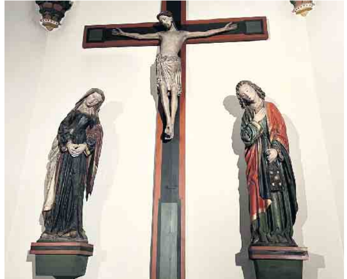
Kreuzigungsgruppe in St. Severin in Schwadorf.

Dazu gibt es weitere Chorsätze zum Advent und auch die Gelegenheit zum Mitsingen. Das Konzert findet statt am Sonntag, 27. November um 17 Uhr . (Die gültigen Corona-Vorschriften sind zu beachten. Ein Mund-Nasenschutz in Innenräumen gilt als Empfehlung.) Neben dem musikalischen Genuss bietet sich die Möglichkeit St. Severin in Schwadorf zu besuchen. Eine Kreuzigungsgruppe aus dem 13. Jahrhundert, die aus der alten Bornheim Kirche stammen soll, ist Blickfang dieses Kleinodes. Für den Besuch des Konzertes wird kein Eintritt erhoben, der Chor freut sich über eine freiwillige Spende zur Deckung der Kosten.