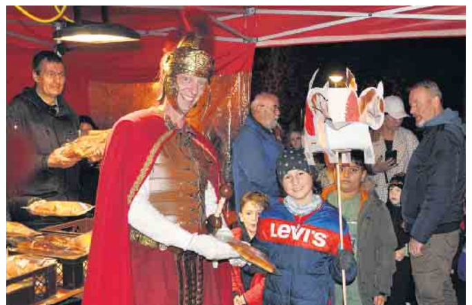
Am Ende des Tages sorgte Sankt Martin für leuchtende Kinderaugen, als er ihnen einen Weckmann überreichte.