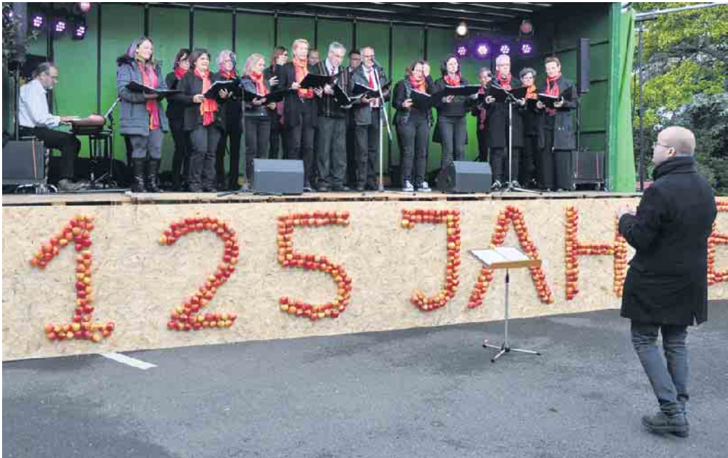
Eine Kostprobe seines Könnens gab der Chor „Esperanza“ beim Apfelfest des Obstbaubetriebes Schmitz-Hübsch.

Chor „Esperanza“ probt für sein Adventskonzert - Sängerinnen und Sänger herzlich willkommen