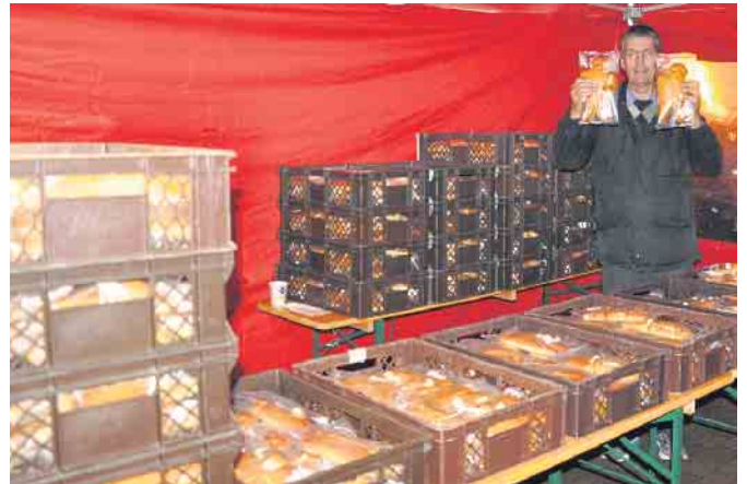
Weckmänner, Weckmänner und nochmals Weckmänner. Mit dieser saisonalen Spezialität aus der Nelles Backmanufaktur wurden die teilnehmenden Kinder belohnt.

Der Tag fand seinen Abschluss bei wärmenden Getränken und deftigen Speisen im Festzelt. Über 1.000 Weckmänner stellte die Nelles Backmanufaktur auch dieses Jahr dem Martinsausschuss zu äußerst günstigen Konditionen zur Verfügung. Natürlich gab es auch einen mit viel Liebe und Können von den Nelles-Profis gestalteten besonders