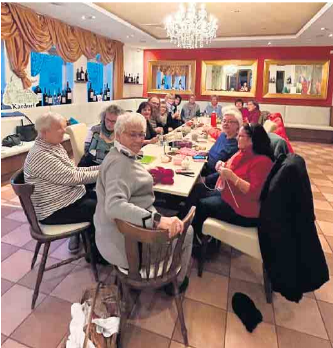
Immer gut besucht ist der Handarbeitstreff im Kardorfer Bürgerhaus.

Kardorf ins Leben gerufen. Alle, die Spaß am Handarbeiten haben, sind hier herzlich willkommen. Und nicht nur Damen sind in der Runde vertreten, es gibt durchaus auch einige Herren, die Spaß am Handarbeiten haben. Es wird gestrickt, gehäkelt, gestickt oder was auch immer das Herz begehrt. Es wird „gefachsimpelt“ und jeder hilft jedem und hat gute Ideen oder Tipps parat. Während man mit seiner mitgebrachten Handarbeit beschäftigt ist, entwickeln sich auch vielerlei interessante Gespräche. Mitunter werden neue Freundschaften geknüpft. Ein Hobby bringt die Menschen eben zusammen. Die freundliche und harmonische Umgebung im Kardorfer Handarbeitstreff begeistert alle und man freut sich immer auf die nächste Veranstaltung. Wir freuen uns besonders über den regen Zuspruch, den die Veranstaltung erfährt. Der Handarbeitstreff Kardorf trifft sich jeden 1. und