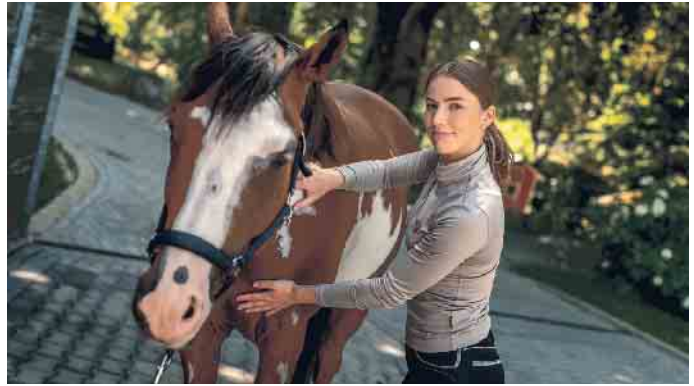
Mit der richtigen Weiterbildung zum Traumberuf.

Wissbegierig war sie schon immer. Und fundiertes Hintergrundwissen ist für eine erfolgreiche Tätigkeit entscheidend, gerade im Pferdebereich. „Denn hier haben wir im Gegensatz zu vielen anderen Berufen auch die Verantwortung für uns anvertraute Lebewesen. Von daher war es mir wichtig, mich im Sinne der Professionalisierung entsprechend