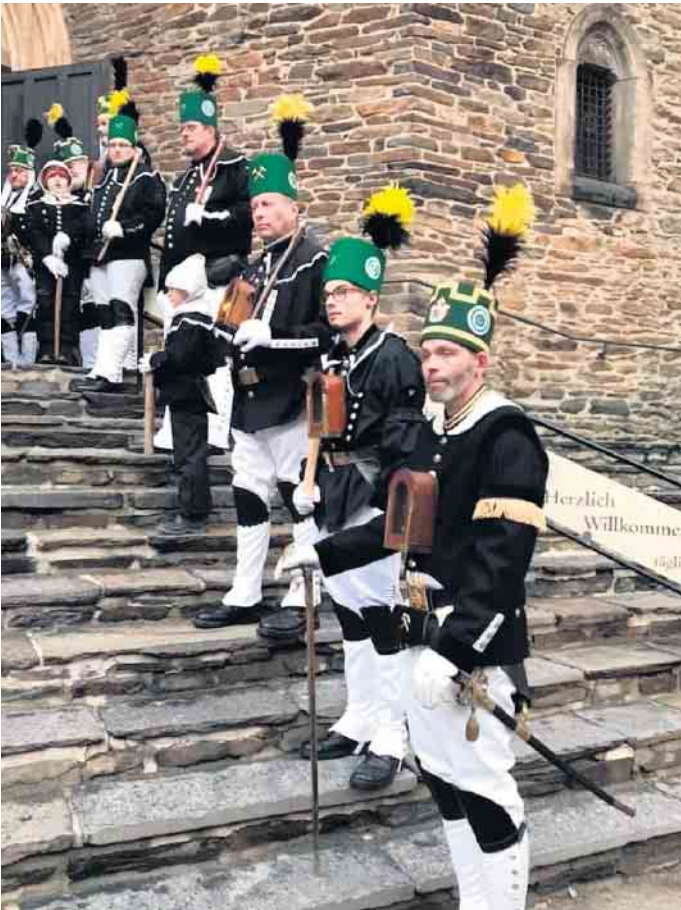
Auf dem Programm der Fahrt steht auch das Erzgebirge.

Hier sind noch einige wenige Plätze frei. Wer sich informieren möchte und Interesse hat, mitzufahren kann sich bei Hans Dieter Wirtz unter 02227/81359 melden.