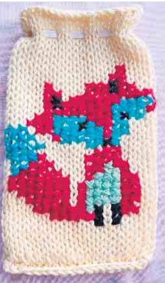
Die Ergebnisse können sich sehen lassen.

Gemeinsam mit Walburga Werle hat der Seniorenbeirat der Stadt Bornheim einen regelmäßigen kostenlosen Handarbeitstreff in