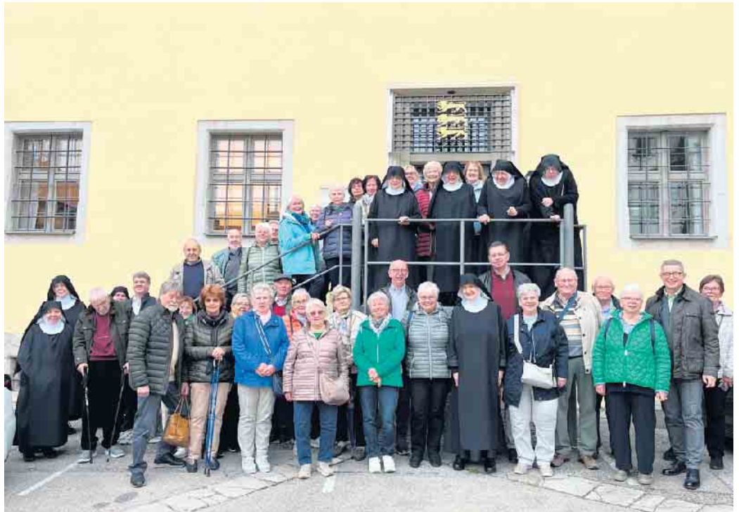
Fast ein Familienfoto: Die Walberberger Wallfahrer mit Nonnen von St. Walburg.

Neben der Erkundung Eichstatts und eines Teils des Altmühltals, standen Ausflüge nach Wemding, Heidenheim sowie eine Donauschiffahrt nach Kloster Weltenburg auf dem Programm. Natürlich durfte auch die Teilnahme an der obligatorischen Sonntagsvesper mit den Nonnen von St. Walburg in der Klosterkirche nicht fehlen. Obwohl einige Teilnehmer die Pilgerfahrt schon mehrfach unternommen haben, ist der Ausflug nach Eichstätt immer wieder ein kleiner Höhepunkt im Jahreslauf und jedes Jahr gibt es Neues zu entdecken und bereichern neue