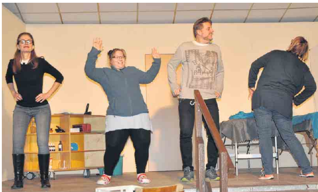
„Zickenalarm auf der Schönheitsfarm“ (Proben-Foto) begeisterte 2019 das Publikum. Dieses Jahr startet die Komödie „Für die Familie kann man nichts“ einen Angriff auf die Lachmuskeln der Zuschauer.