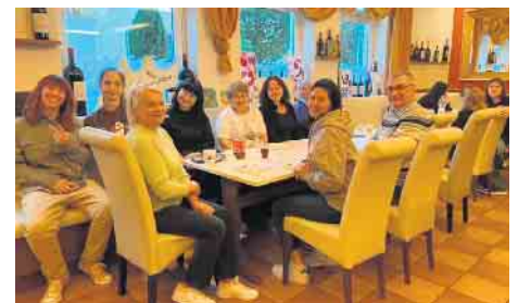
Die ehrenamtlichen Näherinnen, die adaptive Kleidung für verletzte Soldaten herstellen.

„Das heutige Treffen hat einmal mehr gezeigt, wie wichtig solche Veranstaltungen für das soziale Miteinander sind. Wir sind stolz darauf, ein Teil dieser Initiative zu