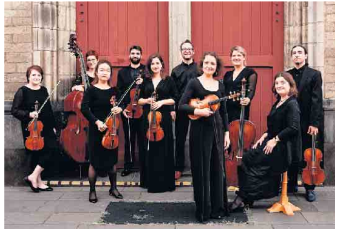
Cölner Barockorchester.

IBAN: DE83 3705 0299 0050 3117 52 | BIC: COKSDE33XXX Spendenzweck: „Klassik-Bühne 2024“