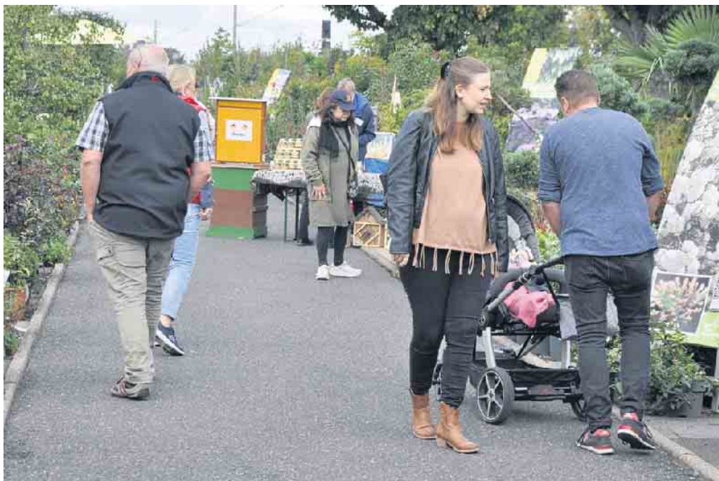
Viel zu sehen gab es im Außengelände, in dem auch die Imker über die Nützlichkeit von Bienen und wohlschmeckenden Honig informierten.