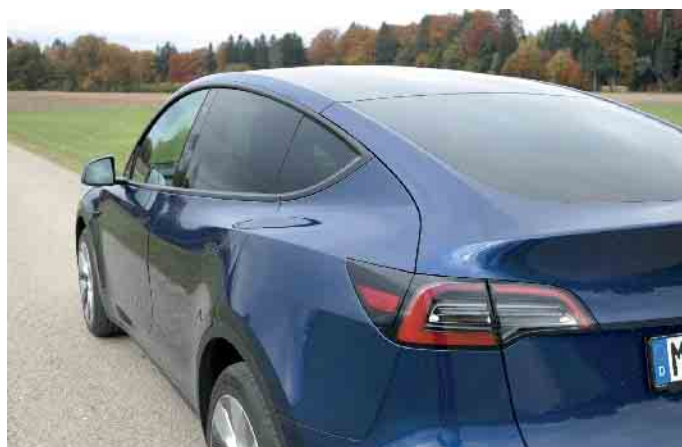
Wie weit man mit einer Akkufüllung kommt, hängt von verschiedenen Faktoren ab.