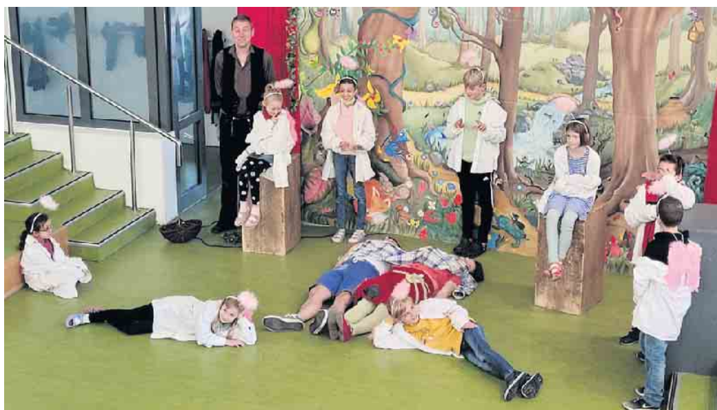
Mit großem Engagement und viel Spaß waren die Schülerinnen und Schüler selbst aktiv bei den Aufführungen.