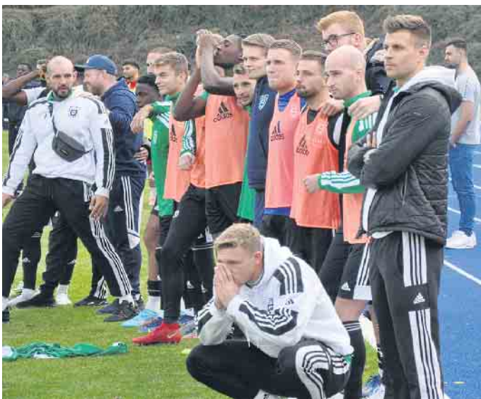
Angespannt verfolgten die nicht beteiligten Spieler das Elfmeterschießen.