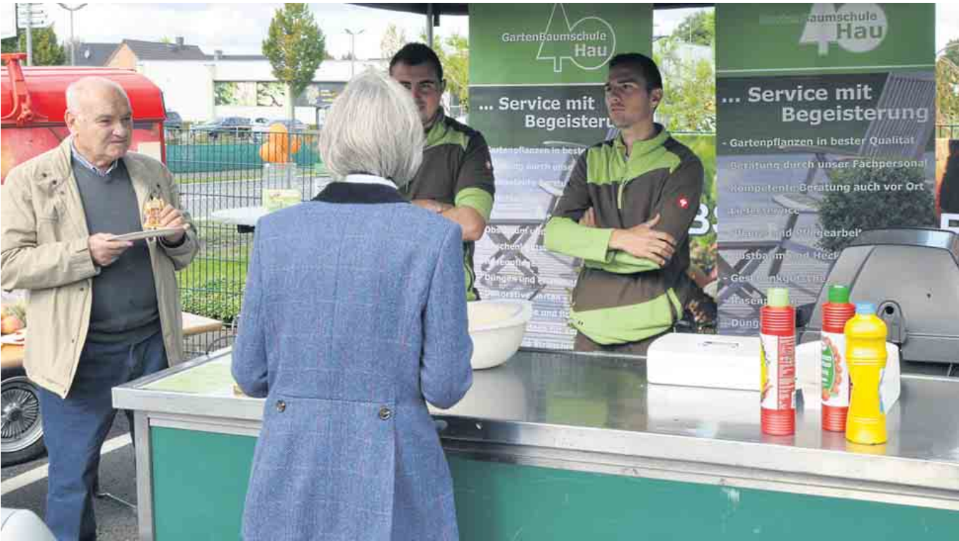
Neben Information und Beratung sorgten die Mitarbeiter der GartenBaumschule auch für das leibliche Wohl der Gäste.