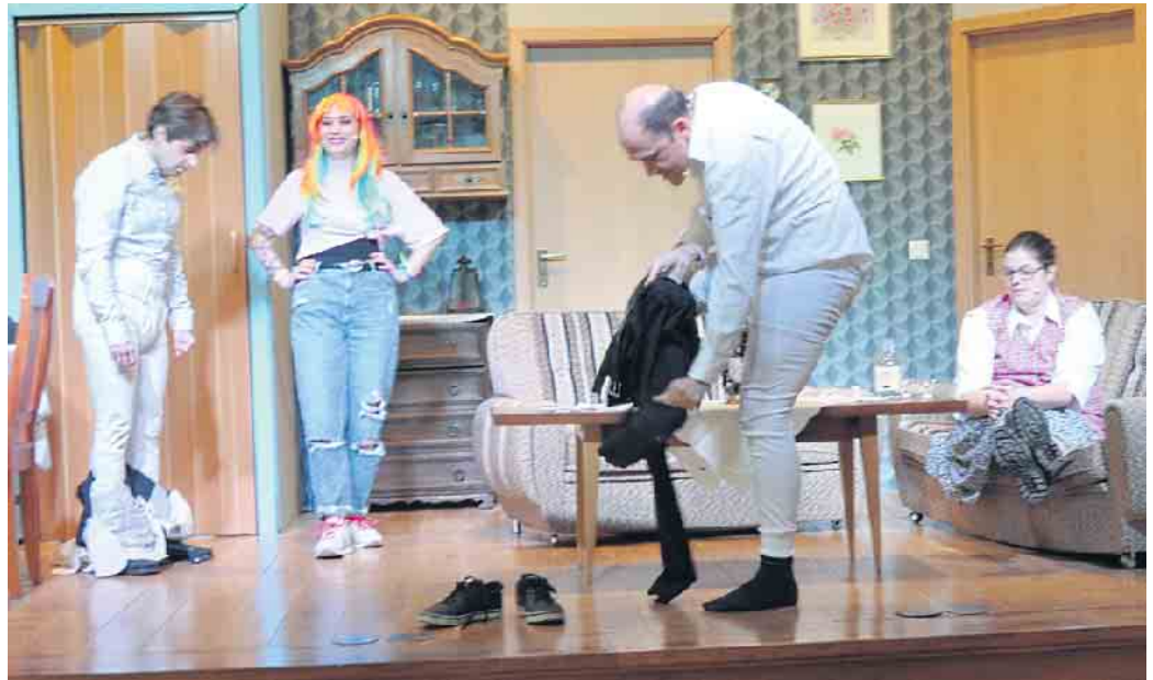
Hosentausch auf offener Bühne. Die Herren haben Stress, die Damen freut's.