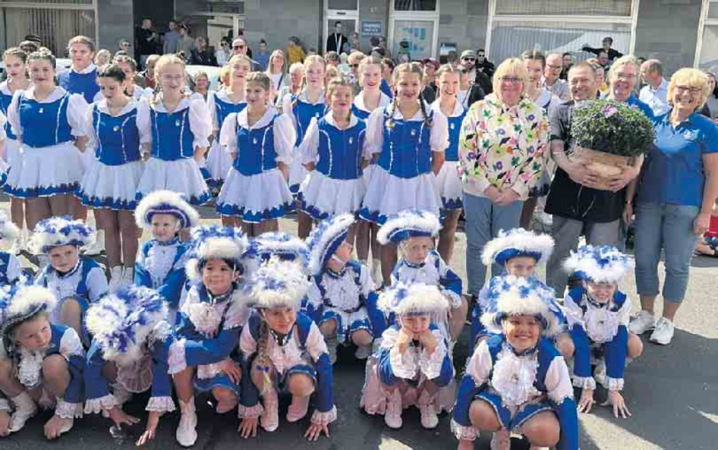
Die „Germania-Funken“ gehören mit ihren Auftritten seit Jahren zum festen Repertoire des Herseler Herbstes.

Ginspezialitäten, Bier vom Fass, fair produzierte Schokolade und Pralines, spanische Street-Food-Spezialitäten (Eriks live Cooking) sowie Leckeres aus dem „Lieblingsburger“ lassen keine Wünsche offen. Beim Crêpes-Stand kann man zwischen 83 verschiedenen Variationen wählen. Nicht zu vergessen die bunte Haribo-Welt der Gummibärchen und Co. zum Selbermischen. Und auf dem Kirchplatz lockt das „Café unter den Linden“ mit selbstgebackenem Kuchen. Frischer Federweißer und -roter, feine Weine und alkoholfreie Weine stehen im Zentrum des Angebots der Weinhandlung Antwerpen und können natürlich auch verkostet und erworben werden. Darüber hinaus gibt es an diversen Infoständen vielfältige Informationen zu den unterschiedlichsten Themen. Die Freiwillige Feu-