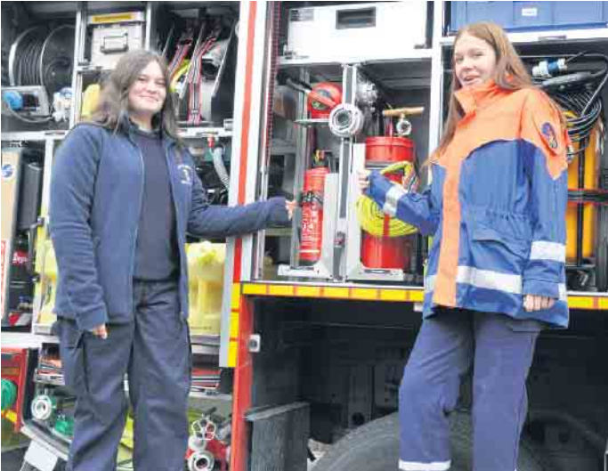
Die Jugendfeuerwehr gibt Einblicke in ihre ehrenamtliche Tätigkeit.