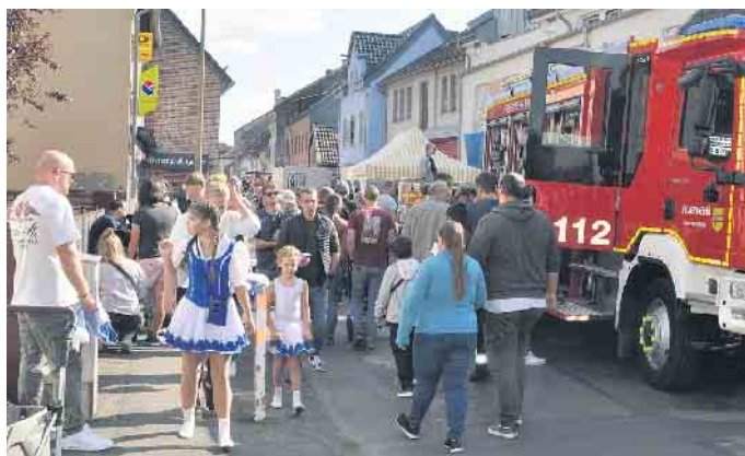
Die Herzen der Organisatoren schlagen höher, wenn die Besucher beim „Herseler Herbst“ Jahr für Jahr die vielfältigen Angebote genießen.