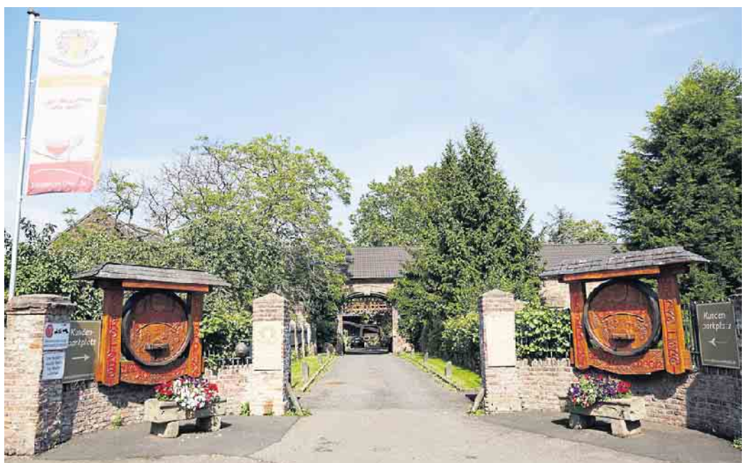
Gepflegte Weine und ein beeindruckendes Ambiente verspricht schon die imposante Einfahrt des Marienhofes.