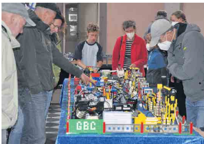
Nicht nur Lego-Freunden geht das Herz bei der Ausstellung im Aegidiussaal auf.

erwehr Hersel präsentiert ihre Einsatzfahrzeuge und die der Wasserwacht. Ein besonderes Highlight nicht nur für die Kleinen wird eine Hüpfburg in Form eines Feuerwehrautos sein.