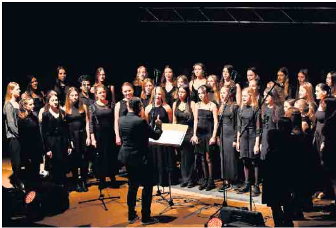
Das Vokalensemble des AvH wird in diesem Schuljahr bei verschiedenen Jubiläums-Veranstaltungen mitwirken.

Mit der Bezahlkarte können Geflüchtete künftig Lebensmittel und Dinge des täglichen Bedarfs direkt in Bornheim einkaufen. Bargeldzahlungen würden entfallen. Ziel ist eine transparente, zielgerichtete und sichere Unterstützung.