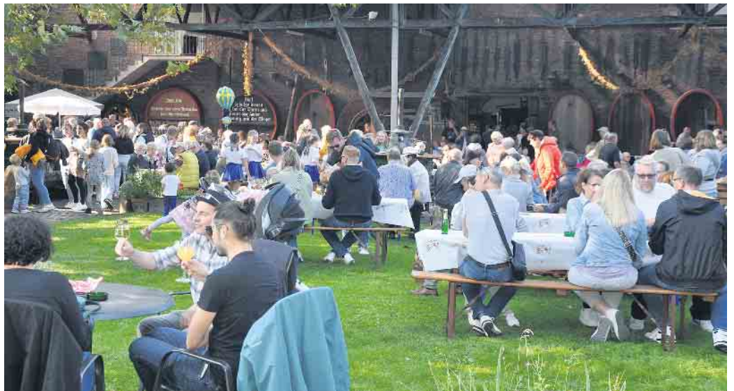
Es gibt wohl kaum etwas Schöneres, als im Innenhof des historischen Marienhofes fröhliche Stunden mit Freunden beim Glase Wein zu verbringen.