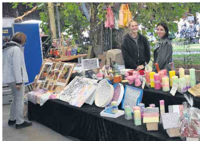
Bereits zum achten Mal präsentieren die Bonner Werkstätten ihre selbstgefertigten Artikel im Hof der Weinhandlung Antwerpen.

Die Legogruppe der Ursulinschule und des Bonner CoJoBo zeigt alles rund um Lego und Lego-Technik im Aegidiussaal. Im historischen Marienhof von 1867 der Weinhandlung Antwerpen kann das historische Museum besichtigt werden, das über 500 Ausstellungsstücke zum The-