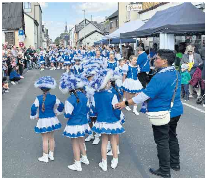
Egal wo sie auftreten: Die Garden der Germania Funken begeistern das Publikum jedes Mal.

15 Uhr: Auftritt der Germania Funken (WDK)