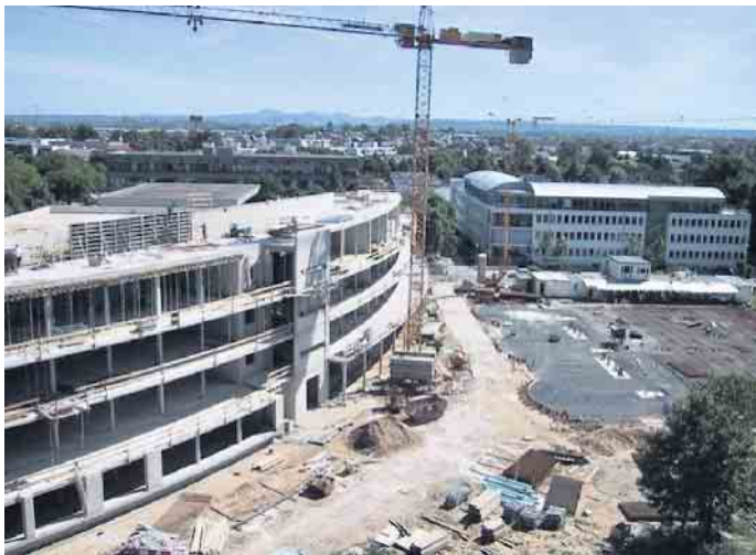
Der Rohbau (ca. 1998/99)