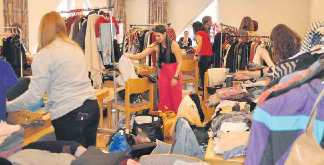
Stöbern und Shoppen nach Herzenslust in angenehmer Atmosphäre - dafür sind die Mertener Kinder- und Mädelsflohmärkte allererste Adresse im Vorgebirge.

Kinder- und Mädelsflohmärkte im Pfarrzentrum Merten locken mit tollen Angeboten - Stöbern und Shoppen nach Herzenslust