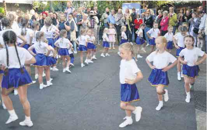
Auch der Nachwuchs der KG Blau-Gold Hersel-Widdig wird wieder die Besucher mit ihren Tänzen verzaubern.