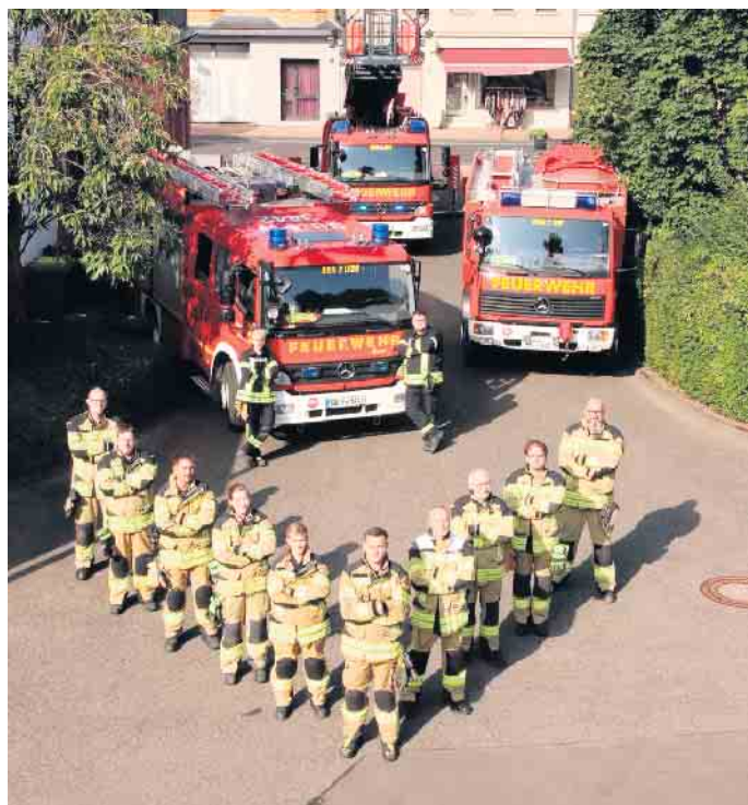
Mitglieder und Fahrzeuge der Löschinheit Bornheim