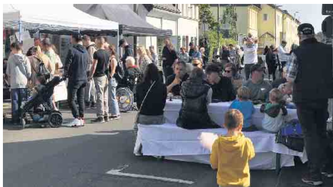
Genussvoll und entspannt lässt sich das bunte Treiben genießen.