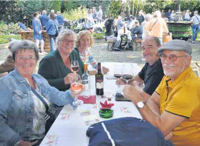
Im historischen Marienhof der Weinhandlung Antwerpen lässt es sich bei Wein, Snacks, Musik und Auftritten bestens aushalten.

Ginspezialitäten, Bier vom Fass, fair produzierte Schokolade und Pralines, spanische Street-Food-Spezialitäten (Eriks live Cooking) sowie Leckeres aus dem „Lieblingsburger“ lassen keine Wünsche offen. Beim Crêpes-Stand kann man zwischen 83 verschiedenen Variationen wählen. Nicht zu vergessen die bunte Haribo-Welt der Gummibärchen und Co. zum Selbermischen. Und auf dem Kirchplatz lockt das „Café unter den Linden“ mit selbstgebackenem Kuchen. Frischer Federweißer und -roter, feine Weine und alkoholfreie Weine stehen im Zentrum des Angebots der Weinhandlung Antwerpen und können natürlich auch verkostet und erworben werden. Darüber hinaus gibt es an diversen Infoständen vielfältige Informationen zu den unterschiedlichsten Themen. Die Freiwillige Feu-