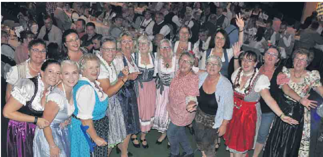
Wer wird Dirndl-Queen 2023? Auch dieses Jahr werden sich hoffentlich wieder jede Menge Kandidatinnen finden.

Rheinhalle), Tabakwaren K&M in Bornheim und eventim erhältlich. Weitere Informationen: rheinhalle.eu/events/oktoberfest-2023 (WDK)