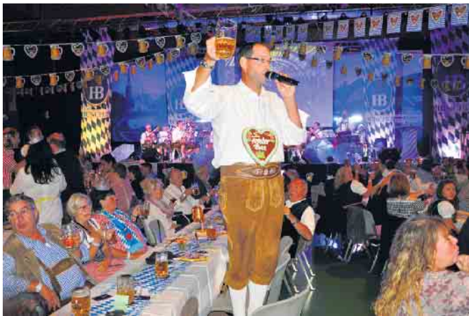
In der stimmungsvoll, zum Anlass passend dekorierten Rheinhalle lässt sich prima feiern.

Rheinhalle), Tabakwaren K&M in Bornheim und eventim erhältlich. Weitere Informationen: rheinhalle.eu/events/oktoberfest-2023 (WDK)