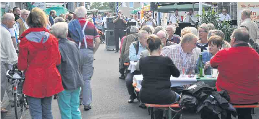
Es lässt die Herzen der Organisatoren höher schlagen, wenn die Besucher beim „Herseler Herbst“ die vielfältigen Angebote wie hier in der Mertensgasse genießen.

„Herseler Herbst“ ermöglicht gemeinsames Auftreten der Gewerbetreibenden - Veranstaltung fand erstmals 2009 statt