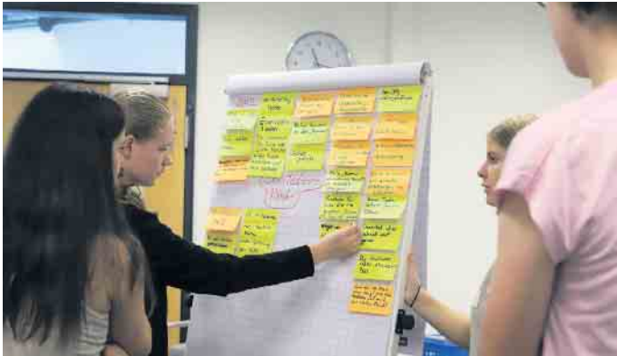
Schülerinnen, die an den Workshops der Kick-off-Veranstaltung teilnehmen.

Schülerinnen entwickeln kreative Ideen im MINT-Bereich