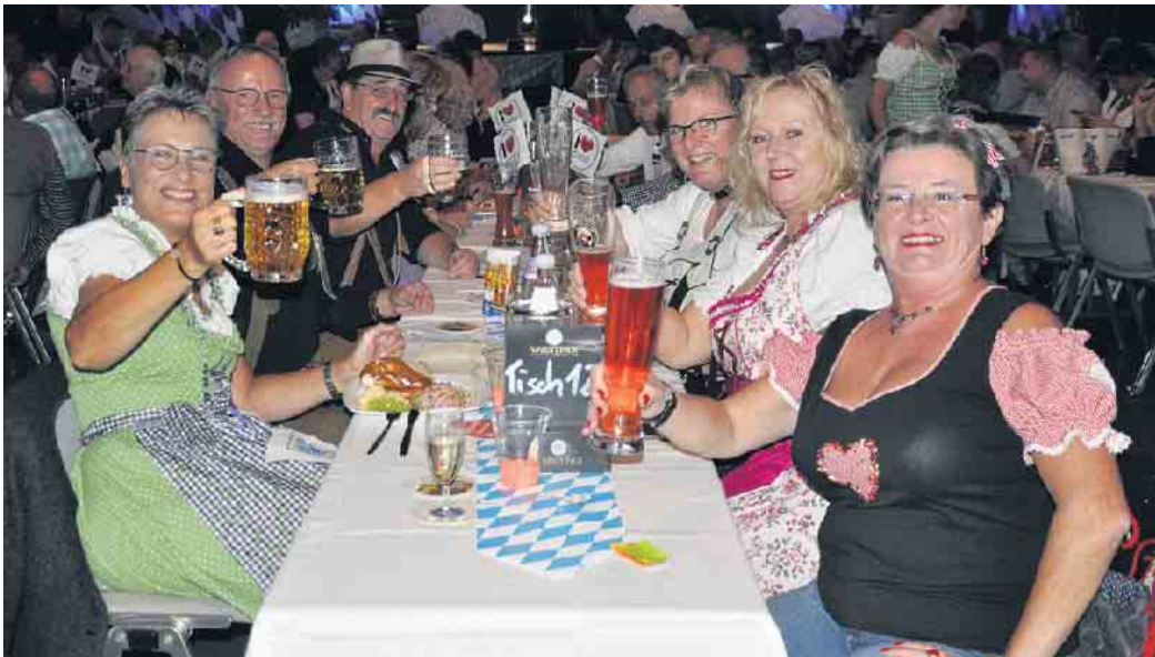
Oans, zwoa, gsuffa, heißt es nicht nur beim Münchener Oktoberfest, sondern genauso bei der Sause in der Herseler „Hall mit Hätz“.

Für gute Laune und Stimmung sorgen dieses Jahr „Die Egerländer vom Rhein“, das „Alpentrio Colonia“ und wie im letzten Jahr die Gruppe „Spökes“. Anschließend werden die Disc Jockeys des Fördervereins auflegen. Am Abend wird natürlich wieder der Nagelkönig und die Kranzelkönigin gekürt. Außerdem wird das schönste Dirndl prämiert. Bei wohlschmeckenden bayerisch/rheinische Schmankerln und bei süffigem Original Hofbräu Oktoberfestbier ist für das leibliche Wohl bestens gesorgt. Es fehlt an nichts, sodass die Party mit Tanz losgehen kann. Einlass ab 18 Uhr, Beginn 19 Uhr. Karten sind bei Schreibwaren Classen, dem Förderverein Rheinhalle (Dienstags von 17 bis 20 Uhr am Ticketschalter der