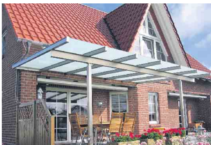
Terrassendächer sind vielseitig einsetzbar und bieten das besondere Etwas.

kann mit natürlich reinigendem Glas ausgeführt werden: Regen und Sonne übernehmen dann die Säuberung. „Ab und zu den Wasserschlauch benutzen reicht schon und die Oberfläche erstrahlt in neuem Glanz“, erklärt Grönegras abschließend. (BF/FS)