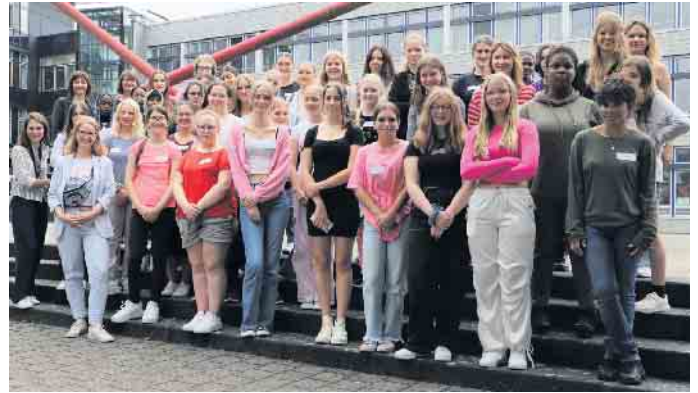
Alle teilnehmenden Schülerinnen

Jugendliche stoßen bei der Berufswahl oft unbewusst auf Hindernisse, da bestimmte Fähigkeiten als stereotypisch männlich oder weiblich angesehen werden. Diese strukturellen, sozialen und persönlichen Erwartungen verhindern häufig, dass Jugendliche ihr volles Potenzial entfalten können.