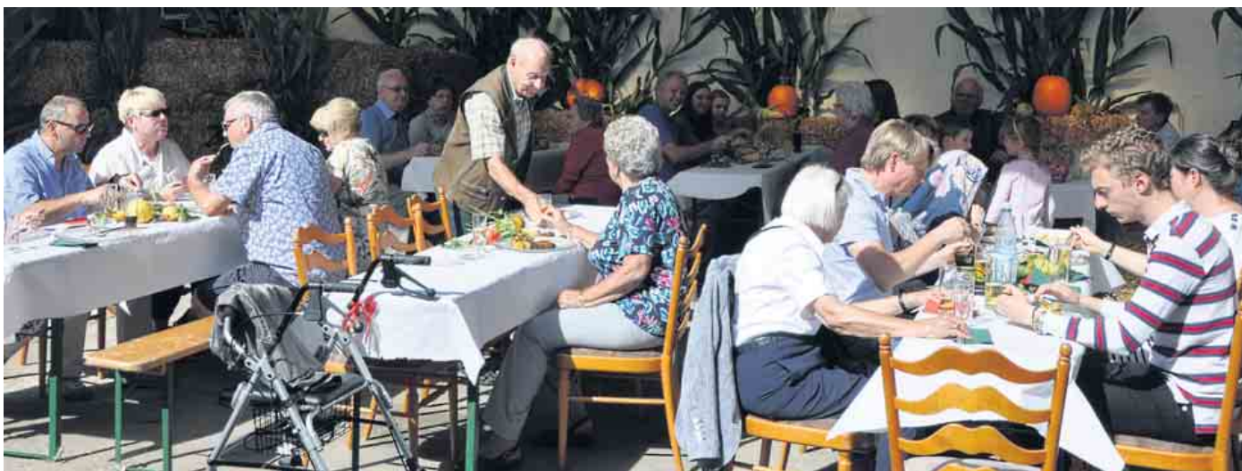
Schmackhafte hausgemachte Gerichte servieren die Höfe Decker und Mertens.