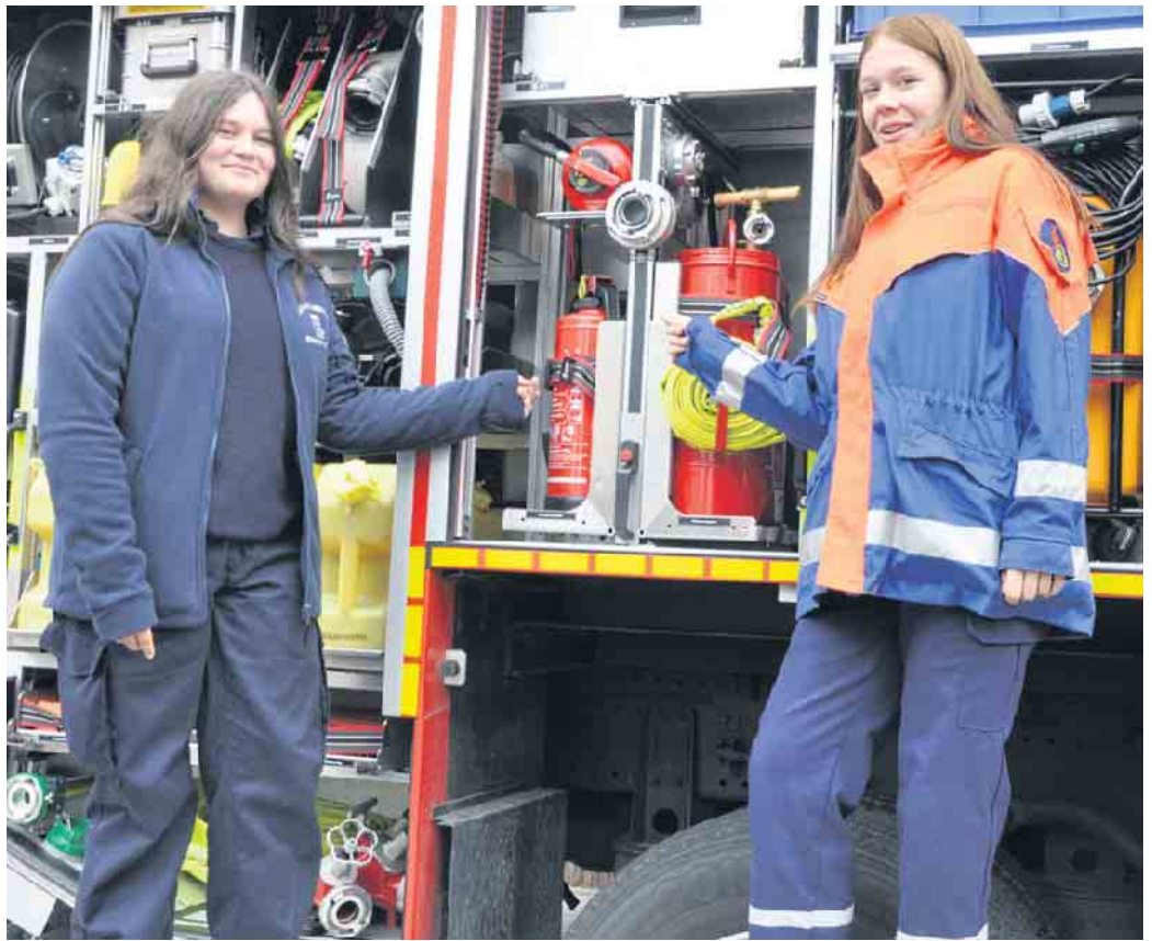
Die Jugendfeuerwehr wird wieder Einblicke in ihre ehrenamtliche Tätigkeit geben.