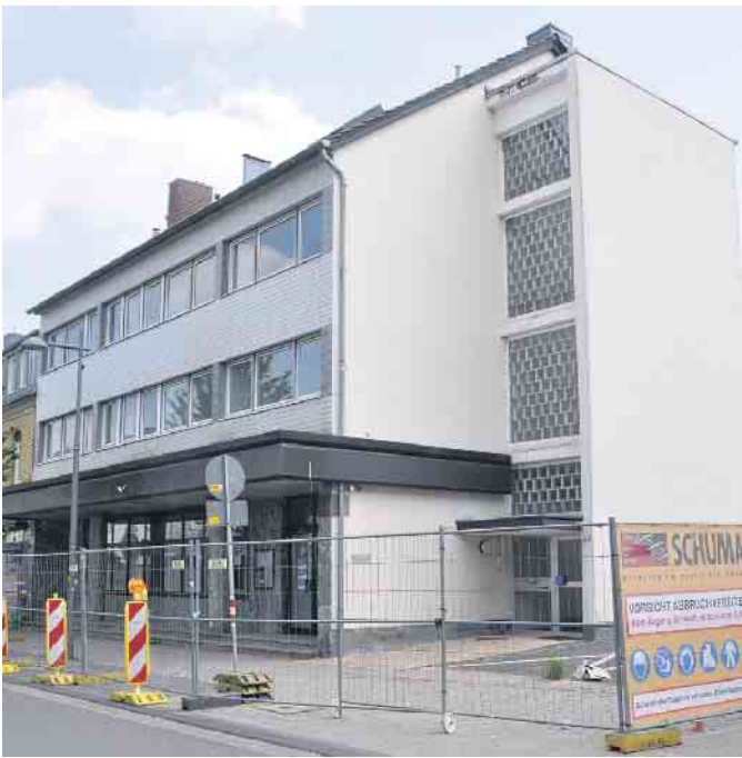
Manche werden sich noch an das frühere Volksbank-Gebäude an der Königstraße erinnern. An seiner Stelle entsteht ein modernes ErlebnisCenter, das im Sommer 2024 eröffnet werden soll.